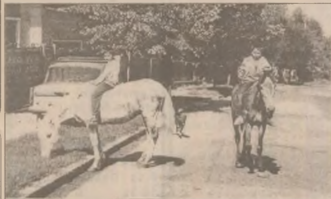
Cowboy de... municipiul!