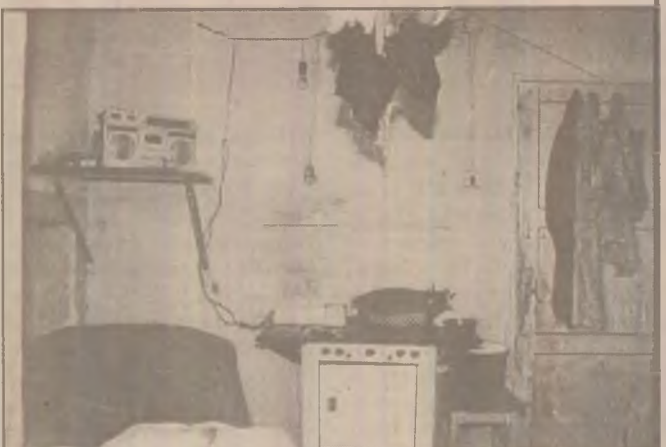
Condiții mizere de locuit, camerele fiind în același timp dormitoare și bucătărie.