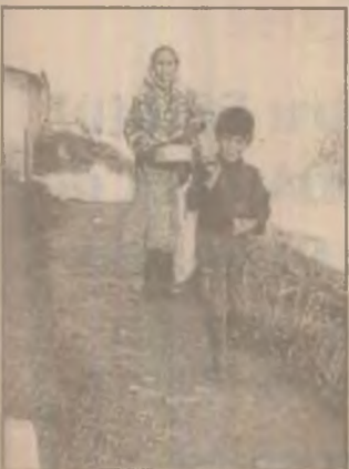
În colonia de la Mintia sărăcia se transmite din generație în generație

Azi la vreme de tranziție majoritatea românilor o duc greu, pentru că țara e săracă. Acești oameni judecați prin prisma etniei lor, dar și a defectelor lor reale, cunoscute și recunoscute, au cu atât mai mult de suferit. Viața în tranziția românească e grea pentru toți, pentru că e guvernată mai mult de legea junglei și de interese, iar destinul și-l face omul. Adevărul e că în actualele condiții prin muncă cinstită nu o duci (încă) bine, dar nici nu ajungi în situația acestor oameni.