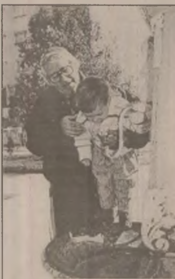
Noroc cu bunicul, altfel muream de sete!