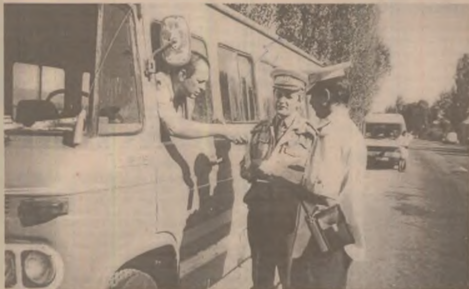
Pentru unii dintre conducătorii de microbuze, dialogul "de sus" cu polițiștii pare a fi un lucru normal.