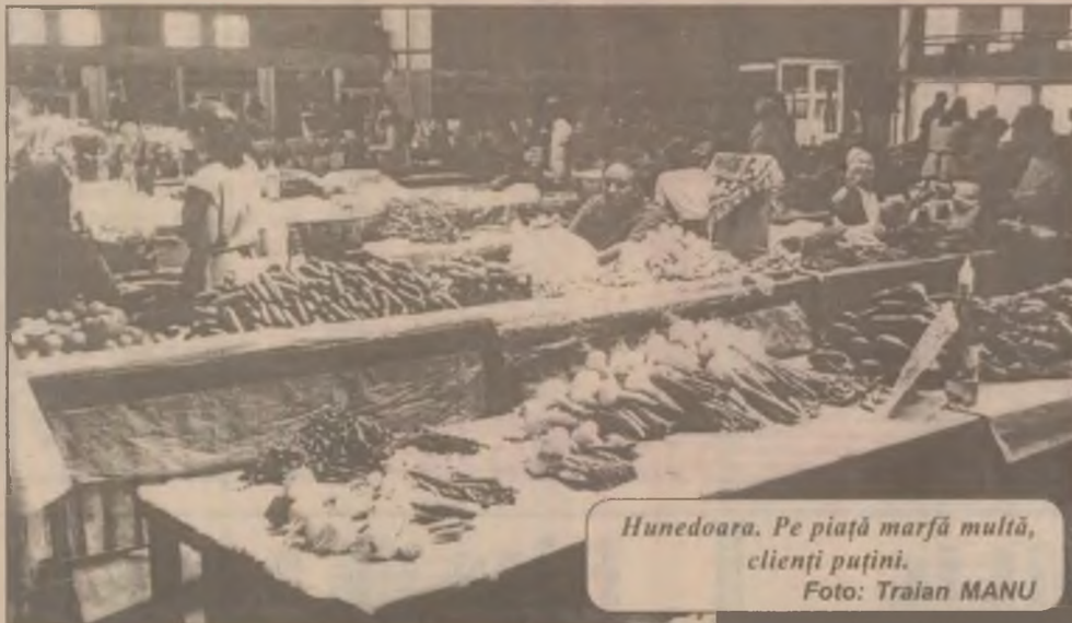
Hunedoara. Pe piață marfă multă, clienți puțini.

Vremea va fi caldă. Cerul va prezenta innoirări temporare în vestul, nordul și centrul țării, unde local va ploua. Vântul va sufla slab până la moderat. Temperaturile maxime vor fi cuprinse în general între 22 și 30 de grade, iar minimele între 10 și 18 grade Celsius.