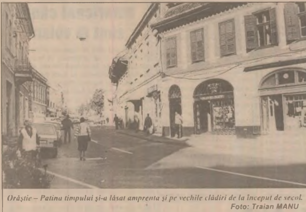
Orăștie - Patina timpului și-a lăsat amprenta și pe vechile clădiri de la început de secol.