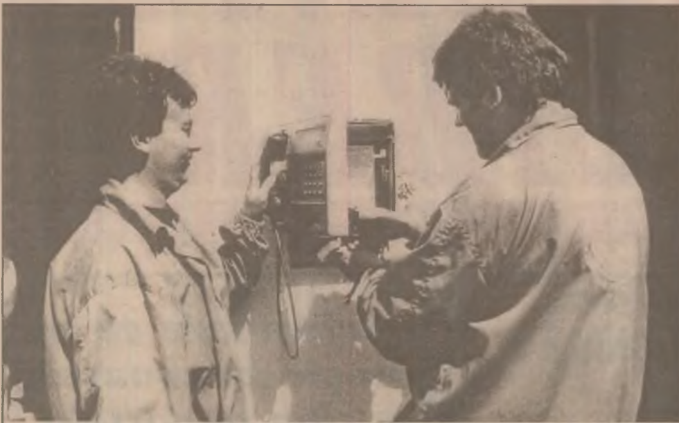
Formația posturi publice a Romtelecom din Hunedoara instalează un nou post telefonic în centrul orașului Hațeg.

VREMEA Vremea va fi în general frumoasă și caldă. Cerul va fi variabil. Izolat, la deal și la munte se vor semnala ploii slabe. Vântul va sufla slab la moderat, cu intensificări în zona montană din sector sudic. Temperaturile maxime vor oscila între 25 și 27 grade, iar minimele între 10 și 15 grade Celsius. Izolat se va semnala ceață. (Octavian Jucu)