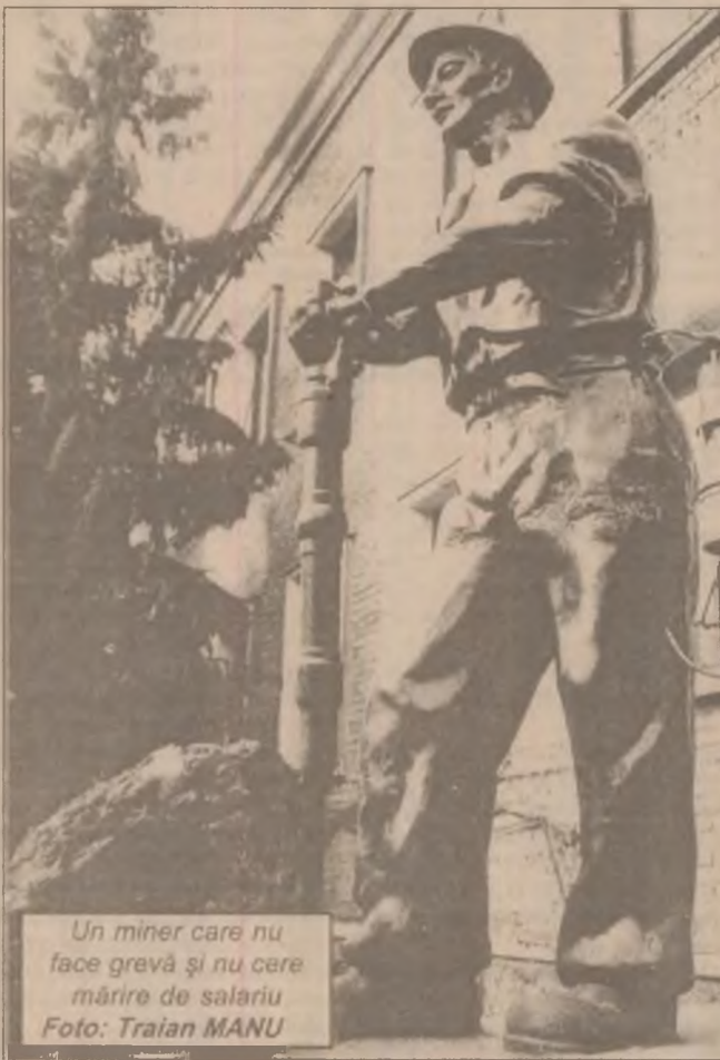
Un miner care nu face grevă și nu cere mărirea de salariu

Acesta este primul dosar românesc de la Strasbourg privind încălcarea dreptului la liberă exprimare, de acum înainte toate dosarele din România pe această speță urmând să fie judecate în raport cu soluția Dalban.