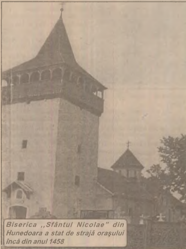
Biserica „Sfântul Nicolae” din Hunedoara a stat de strajă orașului încă din anul 1458

Traian BONDOR, Andrei NISTOR, Cornel POENAR