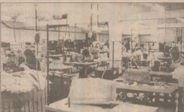
Printr-un efort investițional s-au creat condiții optime pentru întreg fluxul de producție și implicit pentru oameni. Vedere de ansamblu a secției de producție din Brad a fabricii SC Fraly East Europe SA.

Un lucru foarte important va fi și acela că într-un viitor apropiat va exista posibilitatea de comercializare a produselor sub sigla Fraly în toate țările europene, inclusiv pe piața românească.