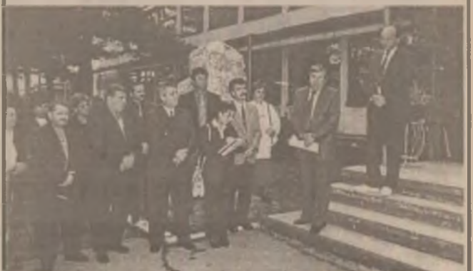
Aspect din timpul festivității dedicate aniversării a 25 de ani de existență a Grupului Școlar Industrial Material Rulant Simeria.