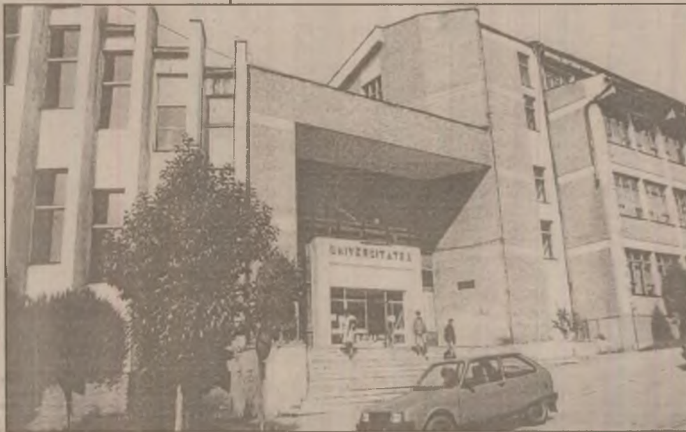
Amfiteatrele Universității din Petroșani