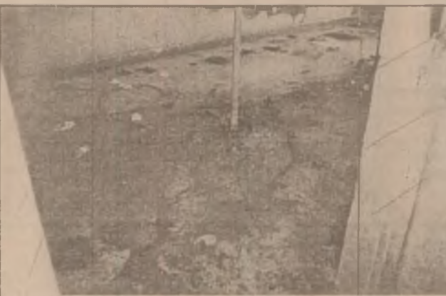
Așa arată toaleta pe care o folosesc locatarii din blocul nr. 2 de pe strada Romanilor.