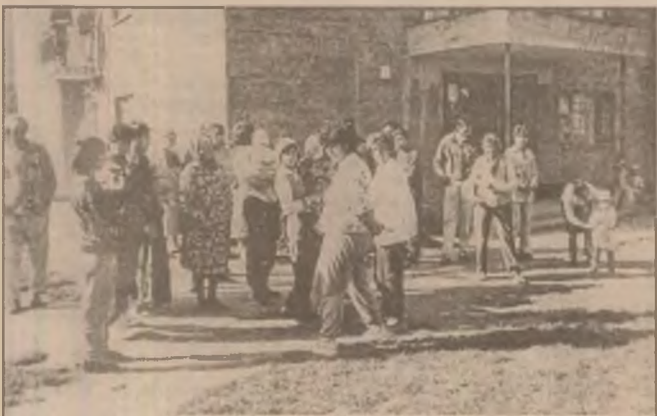
Cu mic cu mare locatarii s-au strâns să-și verse năduful și să ceară condiții mai bune de trai.

Pagină realizată de Sorina POPA, Andrei NISTOR