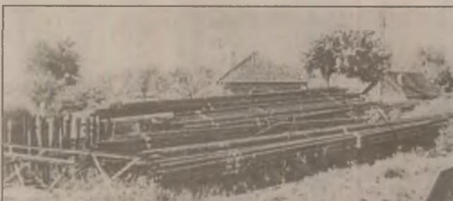
Pentru că nu are voie să execute lucrarea, societatea respectivă și-a abandonat materialele la marginea satului.