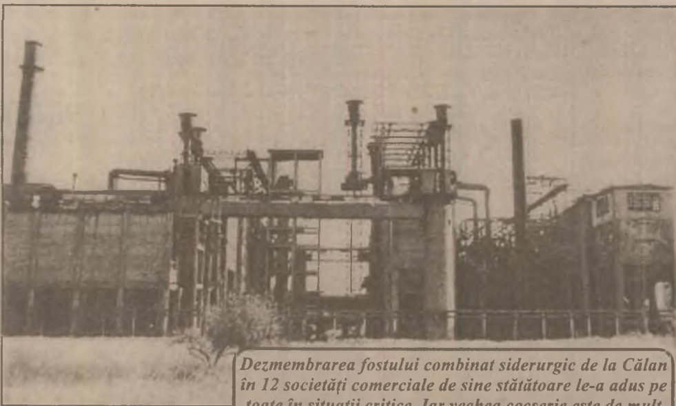
Dezmembrarea fostului combinat siderurgic de la Călan în 12 societăți comerciale de sine stătătoare le-a adus pe toate în situații critice. Iar vechea cocserie este de mult un depozit de fier vechi. Nu-l vrea nimeni?

Din acest credit vor primi împrumuturi în tranșe, pentru o perioadă de trei ani și cu termen de garanție de un an, IMM-urile cu capital majoritar privat, cu până la 250 de angajați și situație financiară bună. Valoarea unei tranșe va fi de maximum un milion de mărci, iar dobânda va fi de 9 la sută.