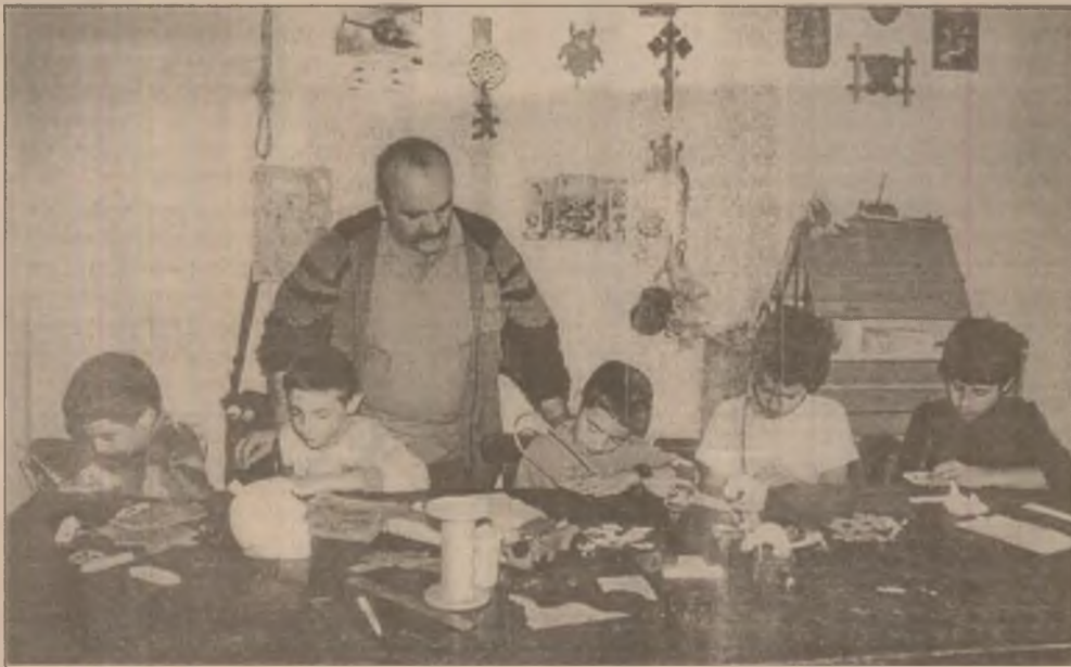
La vârsta jocului, ei își fac singuri jucării