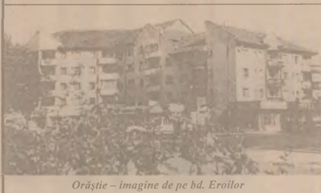
Orăștie - imagine de pe bd. Eroilor

asemenea, spitalul are și el o datorie de 146 de milioane de lei. Pe de altă parte, S.C. Activitatea S.A. are și ea datorii către furnizori, în special pentru gaz și curent electric, în același timp având și linii de creditare pentru care trebuie să plătească sume relativ mari. Este așadar un cerc vicios, cetățeanul fiind cel care trebuie să deblocheze totul prin plata la timp a datoriilor. "Mulți spun că nu au bani, dar nu renunță de exemplu la televiziunea prin cablu, ci la încălzire. De asemenea, multe dintre asociații am constatat că au datorii mici de 1-2 milioane, bani pe care refuză să îi plătească. Or, eu refuz să cred că acolo unde oamenii au plătit sunt doar niște excepții, iar la blocul următor cetățenii sunt atât de săraci încât nu pot plăti; este absurd, ba mai mult, oameni care sunt șomeri sau au probleme mari plătesc la timp, în vreme ce alții care ar avea bani nu vor să își achite datoriile. Rezultatul este acela că suferim toți."