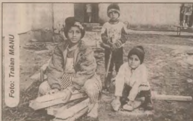
Astea sunt lemnele mele și nu le dau la nimenea!

N.C. locuiește la etajul 4 din blocul F1, Micro 6 și vrea să renunțe la caloriferele din apartament pentru că nu-și mai are rostul în condițiile în care agentul termic nu urcă mai sus de etajul doi. Radiatorul nu poate să-l utilizeze pentru că l-ar costa curentul prea mult. Soția câștigă 800.000 lei/lună și trebuie să întrețină încă 2 persoane, soțul și fiul, ambii suferind de TBC. Deși nu au căldură în casă, ei trebuie să achite totuși 50 la sută din taxele pe care le plătesc cei care beneficiază de acest serviciu. De aceea vor să scoată caloriferele ca să nu mai fie nevoiți să plătească și să stea în frig.