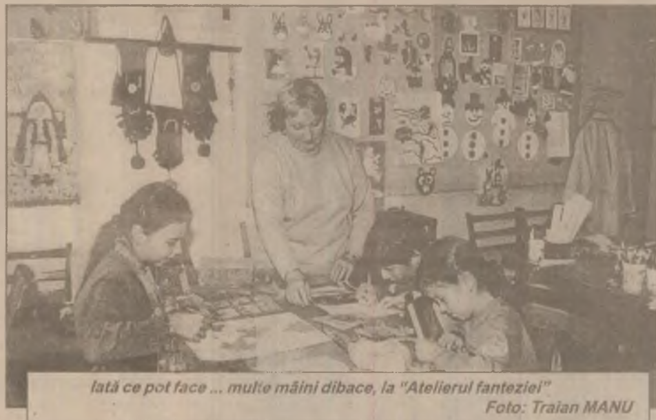
Iată ce pot face... multe mâini dibace, la "Atelierul fanteziei"

Doi tineri la bar: - Babacu' mi-a zis să nu mă prezint la examen nepregătit?! - Și?! - Nu m-am mai prezentat!