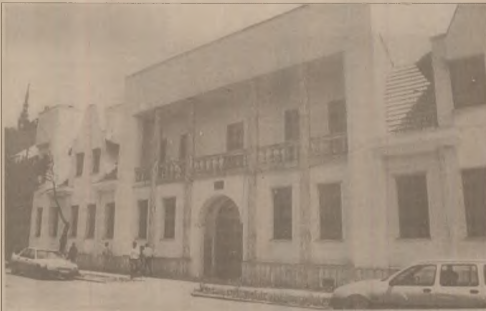
Noua clădire a Curții de Conturi din Deva