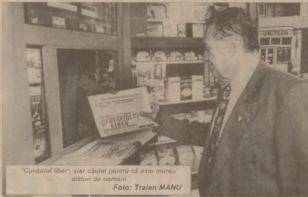
"Cuvântul liber", ziar căutat pentru că este marele aliatul de oameni