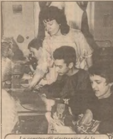
La construcții electronice, de la pasiune la meserie nu-i decât un pas...