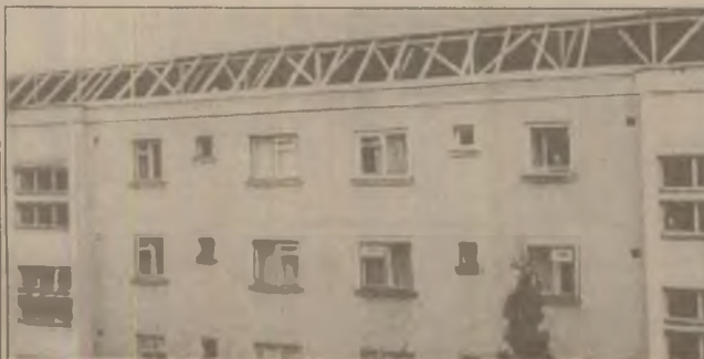
După lupte "seculare", care au durat mai bine de 7 luni, așa arată acoperișul blocului 2 de pe str. G. Enescu din Deva