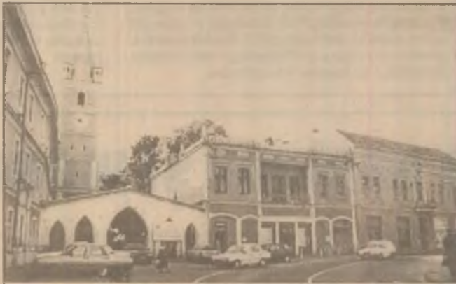
Orăștie. Centrul vechi.