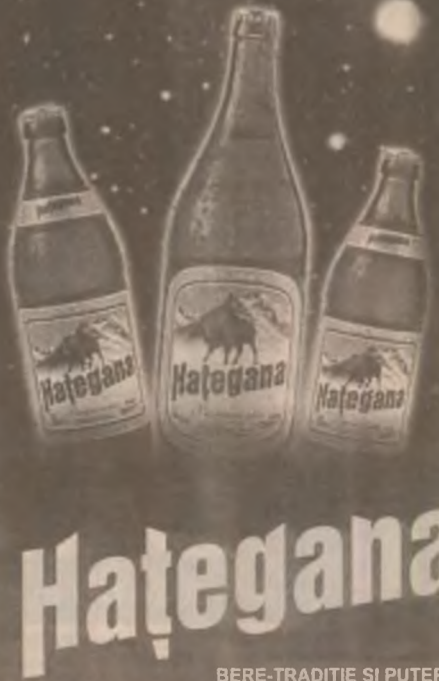
BERE-TRADIȚIE ȘI PUTERE!

Scrive-ți pe o foaie numele, prenumele, adresa, telefonul și răspunde la următoarea întrebare: "Care este sloganul berii Hațegana?" Trimite foaia împreună cu 3 capace de bere Hațegana la CP 7, OP Hațeg și poți fi unul din câștigătorii numeroaselor premii în bani oferite de "Tombola Anului 2000": - Hațegana: - 25 de premii a 1.000.000 lei oferite în urma tragerii la sorți din ziua de luni, 6.12.1999 - 25 de premii a 1.000.000 lei oferite în urma tragerii la sorți din ziua de luni, 20.12.1999 - 12 premii a 4.000.000 lei și Marele Premiu de 50.000.000 lei oferite în urma tragerii la sorți din ziua de marți, 28.12.1999. Plicurile necâștigătoare rămase vor intra și în următoarele trageri la sorți. Câștigătorii premilor vor fi anunțați în presă și la posturile de radio. Tombola se adresează numai persoanelor peste 18 ani.