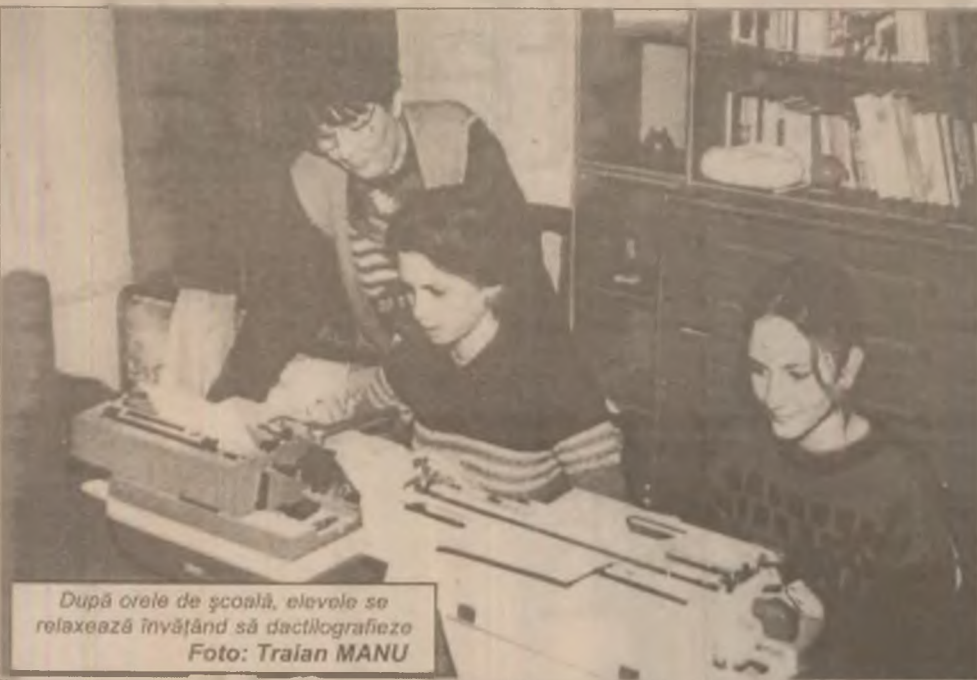
După orele de școală, elevii se relaxează învățând să dactilografieze