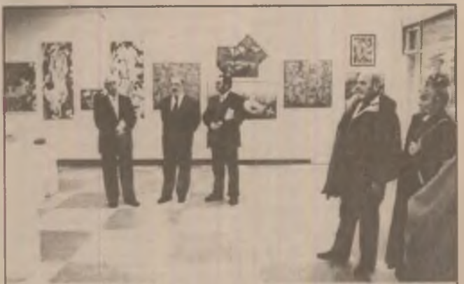
Aspect de la vernisajul „Salonului de iarnă” deschis la Galeria de artă „Forma” din Deva, dedicat Zilei Naționale a României.