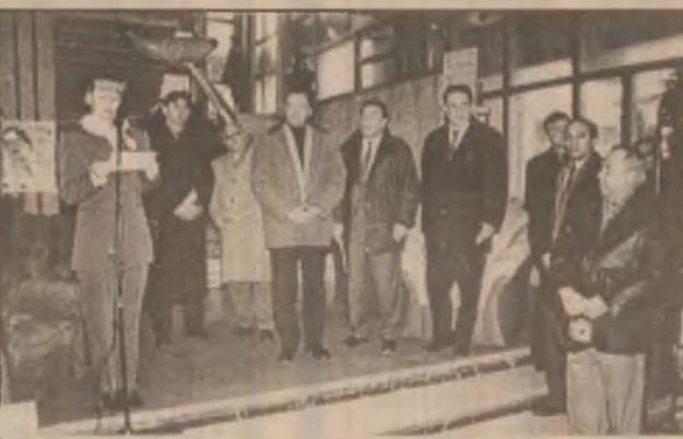
Instantaneu din cadrul manifestării de deschidere a Târgului cadourilor de Sfântul Nicolae

Târgul cadourilor de Sfântul Nicolae va fi deschis până în data de 5 decembrie a.c., zilnic, între orele 10-18, cu excepția duminicii când se va închide la ora 14. Dincolo de interesul mercant, expoziția merită oricum vizionată ambianța realizată de organizatori fiind mult peste nivelul auster cu care tranziția ne-a obișnuit. (A.S.)