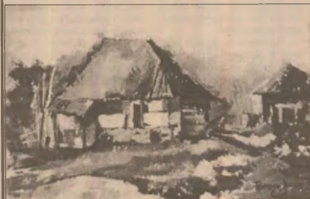
Florescu Dana - Csiri - "Pelsaj"