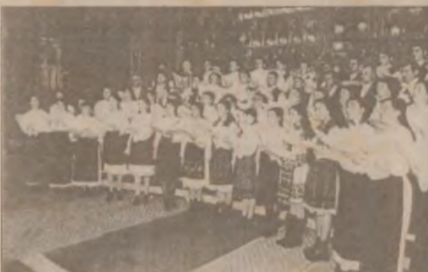
Corul din Șomcuta Mare - Maramureș