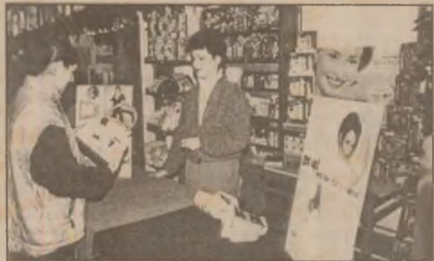
O prezentă... frumos mirositoare la Târgul Cadourilor de Crăciun - cea a SC Leo SRL Deva, cu produse diverse de parfumerie, după preferințe și după pungă.

În 22 decembrie aici va fi organizată marea tombolă a târgului, care va acorda 100 de premii surpriză.