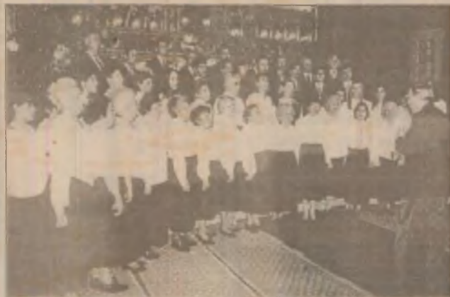
Corul Catedralei Sf. Nicolae din Deva