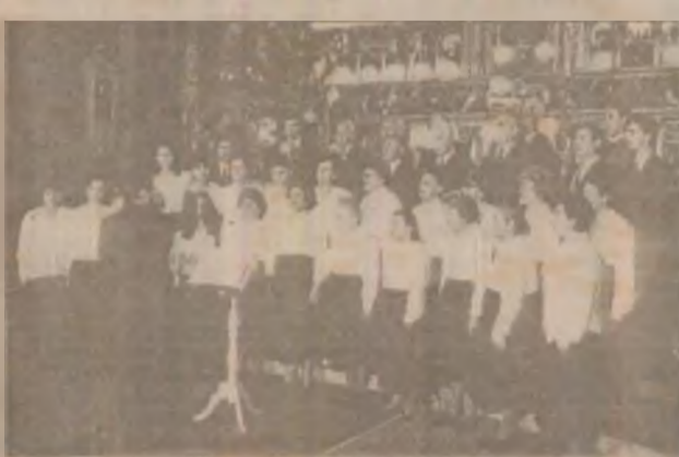
Corul Catedralei ortodoxe "Sf. Mihail și Gavril" din Orăștie