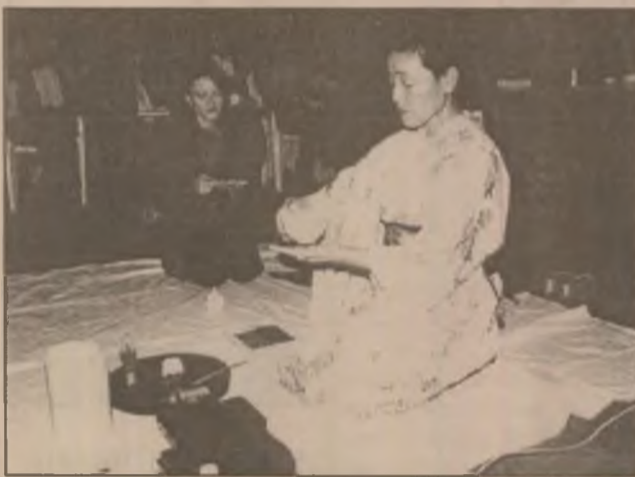
Pregătirea ceaiului japonez - o artă.