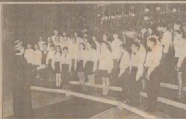
Corul Școlii generale nr. 2 Brad