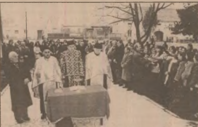
Așa a început aniversarea celor 80 de ani de existență a Liceului "Aurel Vlaicu" din Orăștie...

de carte, că până la urmă au vărsat din ea atât cât putea încapa și atât cât aveau timp în orele de curs, ci dorința de a învăța, respectul față de