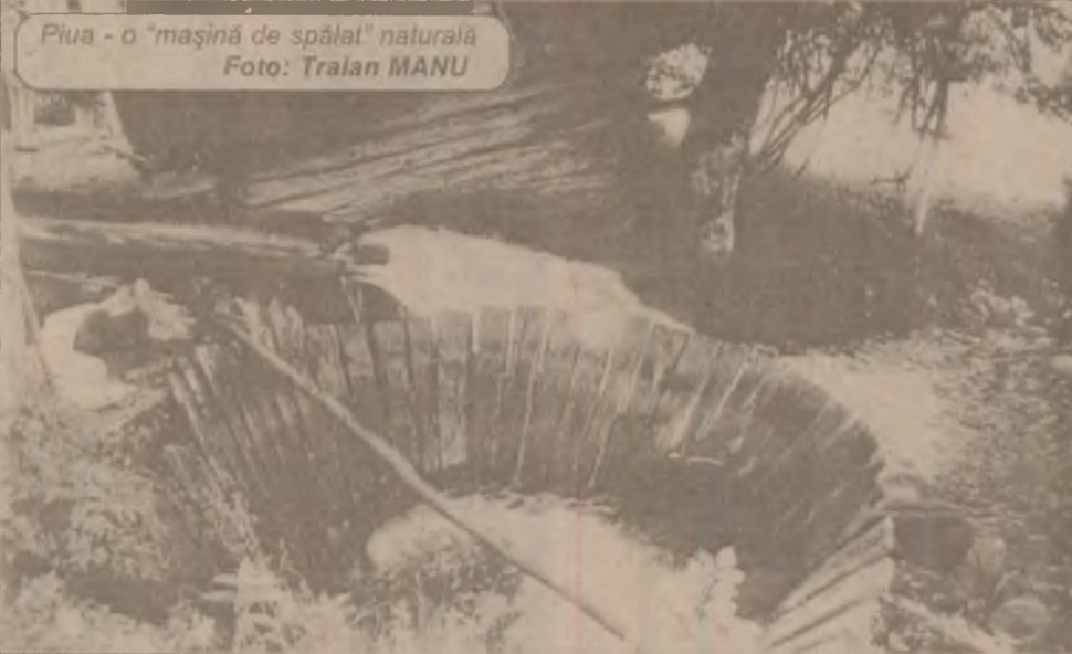
Puia - o "mașină de spălat" naturală

Afirmația aparține dlui primar Traian Bașiu care este total nemulțumit de lipsa de interes a Romtelecom față de problema telefoniei în comuna Pui. Deși s-a cerut de nenumărate ori schimbarea vechii centrale din comună, Romtelecom nu a făcut acest lucru. A fost pus la dispoziție de mai bine de un an de zile un spațiu pentru noua centrală, dar au rămas doar promisiunile.