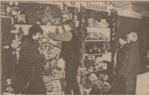
La standul SC „Diamaris” SRL Hunedoara - o mare diversitate de produse-cadou și ornamentații, podoabe pentru Pomul de Crăciun

Târgul sărbătorilor de iarnă din municipiul Hunedoara este deschis până în data de 18 decembrie a.c. și poate fi vizitat zilnic între orele 10-17. (D.G.)