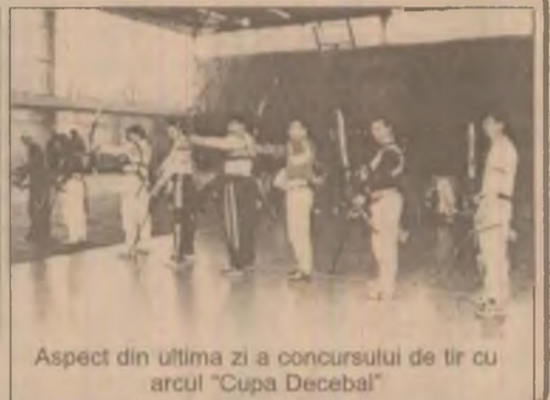
Aspect din ultima zi a concursului de tir cu arcul "Cupa Decebal"