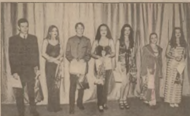
Laureații celei de-a XVII-a ediții a festivalului - concurs "Stelele Cetății".

Directorul ANOFP a mai spus că din împrumutul de la Banca Mondială, de 8,5 milioane de dolari, pentru măsurile active de combatere a șomajului au fost cheltuiți aproape șapte milioane, aproximativ 1,7 milioane de dolari urmând a fi folosiți în același scop în cursul anului viitor.