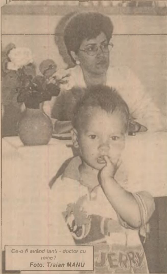
Co-o fi având tanti - doctor cu mine?

Da, e foarte bine să râdem. Și e specific românului să facă haz de necaz pentru a mai uita de necazuri. Dar râsul face bine nu numai la sănătate ci și la frumusețe. Un râs din toată inima vă dă imediat o stare de spirit pozitivă, vă face să străluciți. Ca să puteți râde, căutați anturajul unor oameni veseli, cumpărați-vă cărți și casete video hazlii, chicotiți fără jenă. Râsul are efectul unei pastile de fericire. Și pot fi urâte persoanele posomorâte, niciodată cele fericite.