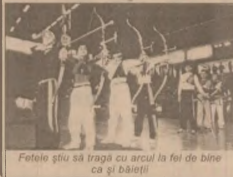
Fetele știu să tragă cu arcul la fel de bine ca și băieții