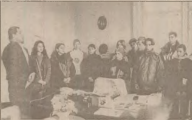
Un grup de elevi de la Școala Waldorf Simeria, colindând colectivul ziarului nostru.

cu mobilier și aparatură modernă, s-au publicat reviste, un anuar, s-a obținut o mulțime de premii. Numai în ultima perioadă școala noastră a fost cea dintâi și, deocamdată, singura unitate de învățământ din județul Hunedoara care a câștigat, grație rezultatelor de excepție, Programul "P&G 2000 - un calculator, o șansă pentru viitor", cabinetul nostru de informatică îmbogățindu-se astfel cu cinci calculatoare performante IBM, precum și conectarea la