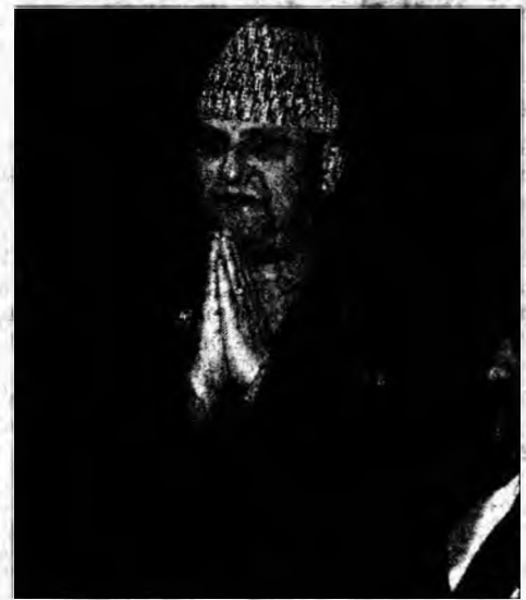
Regele Gyanendra al Nepalului

Nol arestări. Patru cetățeni marocani au fost arestați, marți, la Leganes, periferie a Madridului, în cadrul anchetei referitoare la atentatele de la 11 martie 2004. În prezent, 18 persoane sunt arestate pentru presupusă participare la atentatele soldate, la 11 martie 2004, la Madrid, cu 191 de morți și 1.900 de răniți.