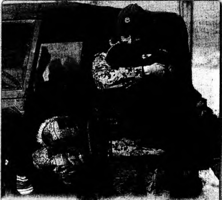
Caritate. Un grup german, membru al organizației de Menținere a Păcii, ține în brațe un copil afgan în timpul unei parcuri organizate din Kabul

La București a avut loc ieri întâlnirea dintre conducerea centrală a PSD și liderii ai organizațiilor județene.