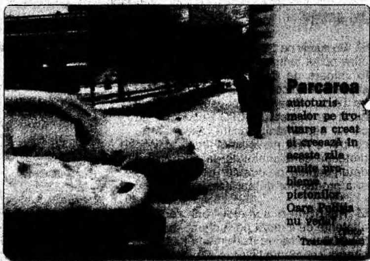
Parcarea autoturismelor pe trotuare a crescut și creează în aceste zile multe probleme pentru pietonilor. Oare Poliția nu vede?

Consilierii au atras apoi atenția asupra unor solicitări ale cetățenilor. Este vorba de faptul că, în zonele de periferie, programul de patrulare al polițiștilor să fie corelat cu cele ale jandarmilor și gardienilor publici. De asemenea, este necesar să fie organizate acțiuni permanente de legitimare a persoanelor suspecte din oraș, mai ales sâmbăta și duminica.