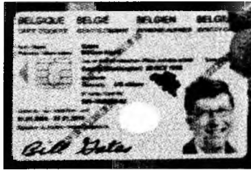
Pe numele lui Gates

Bruxelles (MF) - Cartea de identitate electronică belgiană, a cărei difuzare la scară largă a început cu câteva luni în urmă, va fi integrată în MSN Messenger, produs de compania Microsoft, a anunțat marți, la Bruxelles, Bill Gates.