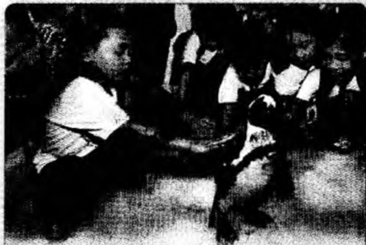
Spectacol Copiii din Manila au avut parte ieri de un spectacol pe zăpadă artificială, sub auspiciile unei organizații de protecție a copiilor.

Carnavalul de la Rio se desfășoară în perioada 5-8 februarie.