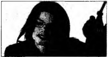
Marți, la tribunal

Părțile s-au reîntâlnit marți, în prezența acuzatului, pentru a audia sute de potențiali jurați. Dintre aceștia trebuie aleși 12, care vor decide soarta cântărețului judecat pentru agresiune sexuală a unui minor. O primă serie de potențiali jurați a fost chestionată luni, la tribunalul din Santa Maria, asediat de presa mondială și de o mulțime de fani. Potrivit specialiștilor, apărarea are interesul de a alege jurați celibatari, fără copii, tineri, căci aceștia au crescut cu muzica lui Michael Jackson. La rândul său, acuzarea va privilegia fără îndoială persoane conservatoare, părinți, mai ales mame, care ar putea stabili o relație de empatie cu presupusa victimă. Procesul de selecție a juraților ar trebui să dureze între trei și patru săptămâni.