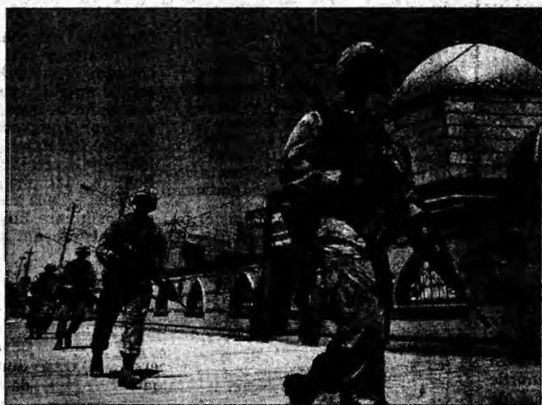
Soldații americani în patrulare în Bagdad

Responsabilii militari au anunțat că vor să reducă pierderile generate de implicarea trupelor americane în lupte prin folosirea unităților irakiene pe care le instruiesc.