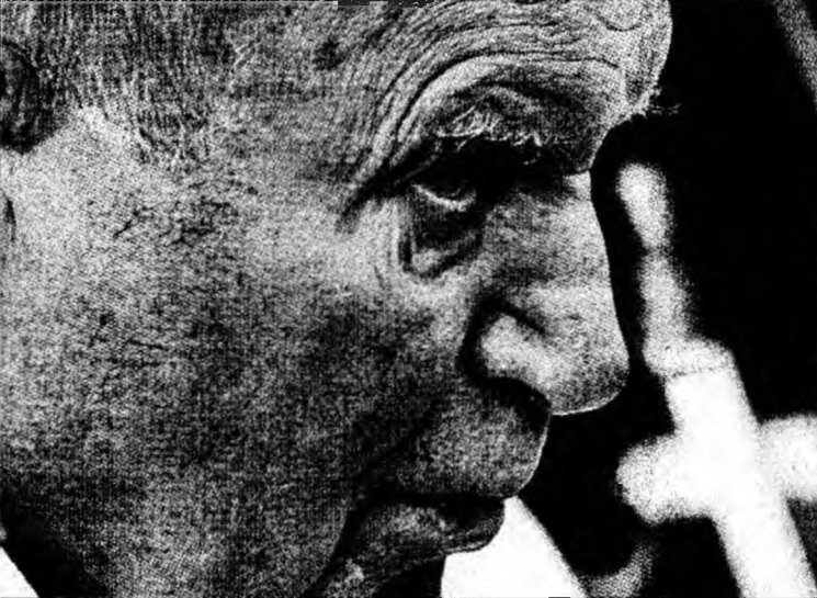
Papa Ioan Paul al II-lea mai rămâne în spital.

„În prezent, parametrii cardio-respiratori și metabolici sunt în limite normale. În consecință, putem confirma diagnosticul de laringo-traheită acută cu episoade de spasm laringian, așa cum