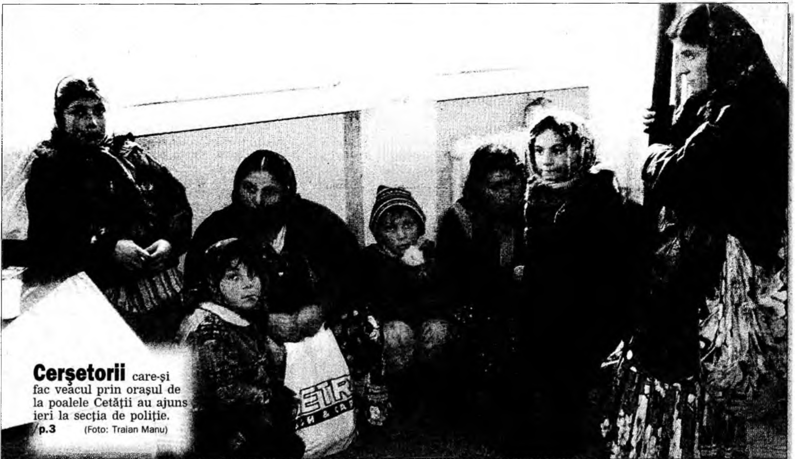
Cerșetorii care-și fac veacul prin orașul de la poalele Cetății au ajuns ieri la secția de poliție. p.3