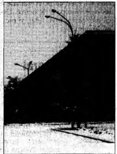
Bloc de locuințe în Orăștie.

Impozitele locale se achită la casieriile Primăriei Orăștie, după următorul program: luni, marți, miercuri: 8,30 -12,00 și 13,00 -15,30; joi: 8,30 -12,00 și 13,00 -17,00; vineri: 8,30 -12,00 și 13,00 -14,00.