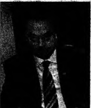
Ministrul Administrației și Internelor, Vasile Blaga

Cu ocazia unei operațiuni antislamiste de anvergură desfășurată în Germania, la 12 ianuarie, coordonată tot de autoritățile din Munchen, 15 suspecți au fost plasați în arest preventiv, fiind bănuți de apartenență la o rețea islamistă care fabrica documente false și promova războiul sânt.