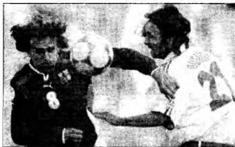
Christophe Dugarry (d), la Euro 2004

Paris (MF) - Fostul internațional francez Christophe Dugarry, în vârstă de 32 de ani, a declarat, într-un interviu acordat cotidianului L'Equipe, că își încheie cariera de jucător. Dugarry este cel de-al optulea component al selecționatei Franței, campioană mondială în 1998, care se retrage, după Lionel Charbonnier, Stephane Guivarc'h, Alain Boghossian, Bernard Lama, Laurent Blanc, Didier Deschamps și Emmanuel Petit. El s-a retras de la echipa națională după Cupa Mondială din 2002. „Decizia de a-mi încheia cariera am luat-o în urmă cu patru sau cinci zile, chiar dacă am primit o ofertă de la Benficia Lisabona”, a spus Dugarry, care a menționat că nu se retrage din motive medicale. Dugarry, care și-a început cariera profesionistă la Girondins Bordeaux (1988-1996), a mai evoluat la AC Milan (1996-1997), FC Barcelona (iulie 1997 - decembrie 1997), Olympique Marseille (1998 - 1999), Birmingham City (2003 - 2004) și Qatar Club (mai 2004 - ianuarie 2005).