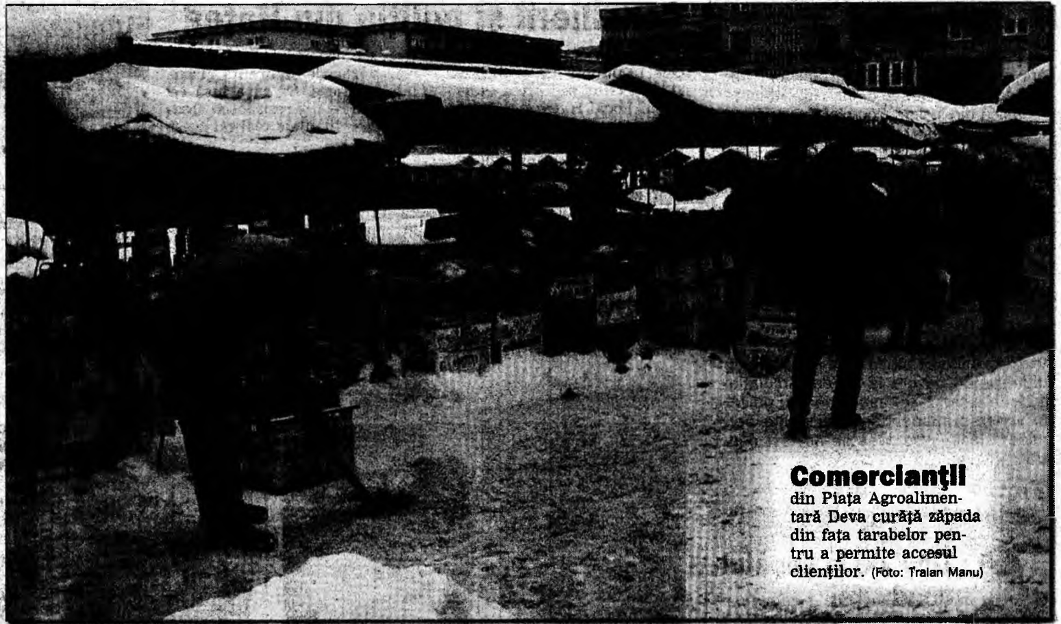
Comerclanții din Piața Agroalimentară Deva curăță zăpada din fața tarabelor pentru a permite accesul clienților.

Restituirea sumelor reprezentând diferențe de impozit pe venit mai mici de 50.000 lei se va face numai la solicitarea contribuabilului, și nu din oficiu, au precizat reprezentanții DGFP Hunedoara. Aceasta din cauza faptului că în multe cazuri costurile restituirii sunt mai mari decât sumele de restituit. (C.P.)