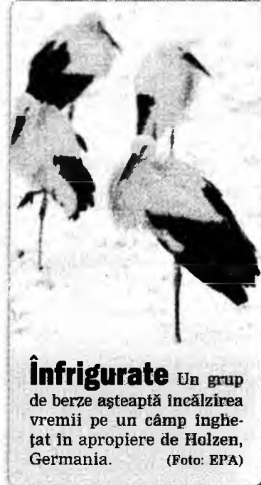
Înfrigurate Un grup de berze așteaptă încălzirea vremii pe un câmp înghețat în apropiere de Holzen, Germania.