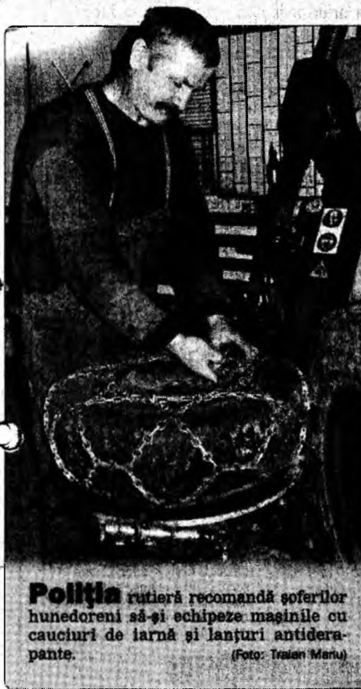
Poliția rutieră recomandă șoferilor hunedoreni să-și echipeze mașinile cu cauciuci de iarnă și lanțuri antiderapante.