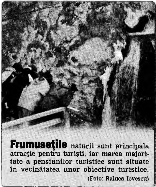
Frumusețile naturii sunt principala atracție pentru turiști, iar marea majoritate a pensiunilor turistice sunt situate în vecinătatea unor obiective turistice.

1395 - Prima mențiune documentară a Cetății Neamțului. 1924 - A murit al 28-lea președinte al SUA, Thomas Wilson Woodrow, la vârsta de 67 de ani. 1950 - Au fost stabilite primele relații diplomatice la nivel de ambasadă între România și Vietnam. 1957 - S-a creat, la București, Arhiva Națională de Filme. • Poetul Ștefan Augustin Doinaș a fost arestat și condamnat de regimul comunist la un an închisoare sub acuzația de „omisiune de denunț”. 1962 - SUA au instituit blocada economică asupra Cubei. 1995 - Este lansată naveta spațială „Discovery”. 1997 - PNȚCD a anunțat că regele Mihai poate reveni în țară. 2002 - Papa Ioan al II-lea a pledat pentru recunoașterea juridică a embrionului uman.