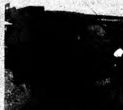
Daewoo Damas , af. 1997. Preţ negociabil. Tel. 0722/521935 ; 0724/996847.