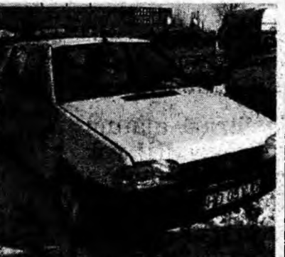
Dacia Nova , af. 1990. Preţ 85 mil. lei. Tel. 0741/567790.