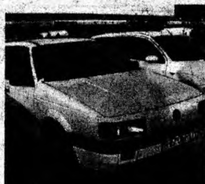
VW Passat , af. 1991, închidere centralizată, benzină. Preţ 3 900 euro. Tel. 0722/663724.