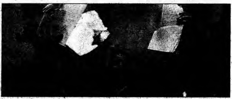
Irakul a fost zguduit de noi atentate.

Moțiunea lui Stoică susține realizarea unui pol politic de centru-dreapta, prin fuziunea formațiunii liberale cu PD. Liberalii au ales, sâmbătă, componența structurilor de conducere a partidului, respectiv membrii Comitetului Executiv, Comisia de cenzori și Curtea de onoare și arbitraj, ce vor avea termen de mandat de un an. Valeriu Stoică a participat la congres. Vineri seara, Călin Popescu Tăriceanu a fost desemnat drept președinte al formațiunii liberale.