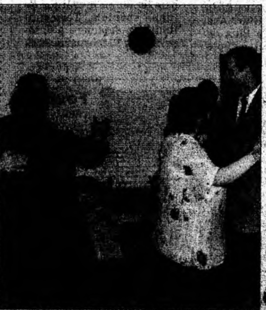
Perechile mai tinere n-au ezitat să fie invitate.