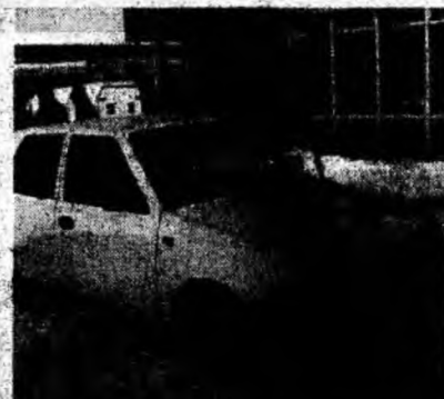
Dacia Nova GT , af. 1998. Preţ 85 mil. lei. Tel. 0744/865450.