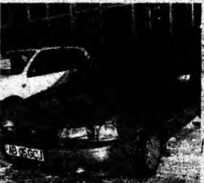
Cielo Daewoo , af. 1997, servo, ABS, climă. Preţ 3 800 euro, negociabil. Tel. 0726/811296.