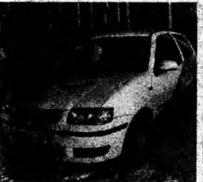
VW Polo 1.0 MPI , af. 2001, benzină, servo, airbag, ABS, climă. Preţ 6 400 euro, negociabil. Tel. 0722/639426 ; 0744/567063.