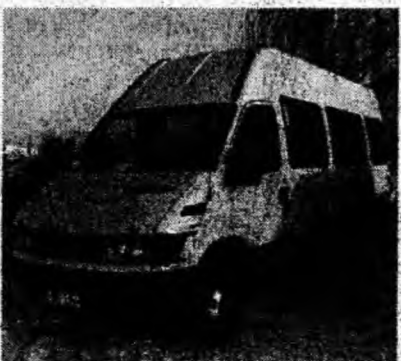
Iveco 50 C13 , af. 2002, transport persoane, 17 locuri. Preţ 20 500 euro, negociabil. Tel. 0723/617840.