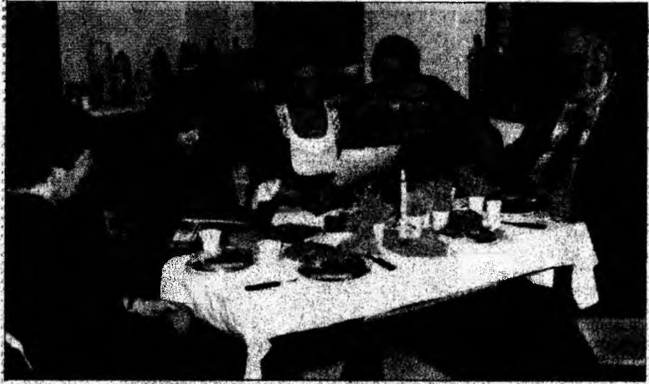
Petrecerea s-a deschis cu „Cântecul Transilvaniei”, imnul comunității germane.