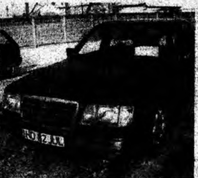
Mercedes 250 , af. 1994, diesel, airbag, ABS, climă. Preţ 10 500 euro, negociabil. Tel. 0722/826924.