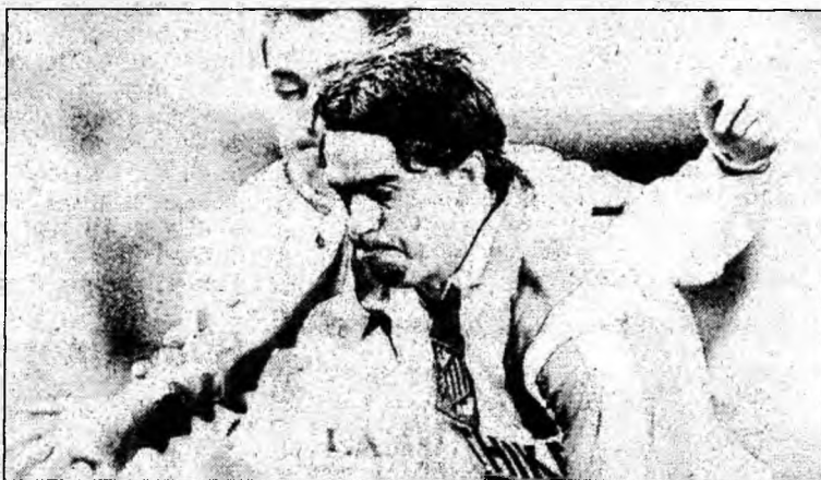
Cosmin Contra nu mai e dorit la Atletico.