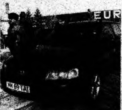
VW Passat TDI , af. 1998, diesel, fulloption. Preţ 8 200 euro, negociabil. Tel. 0724/261039.