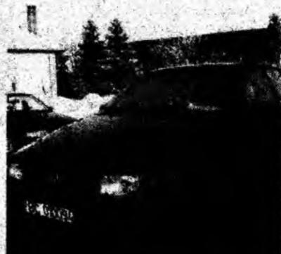
VW Passat , af. 1990, diesel. Preţ 4 400 euro, negociabil. Tel. 0741/372822.