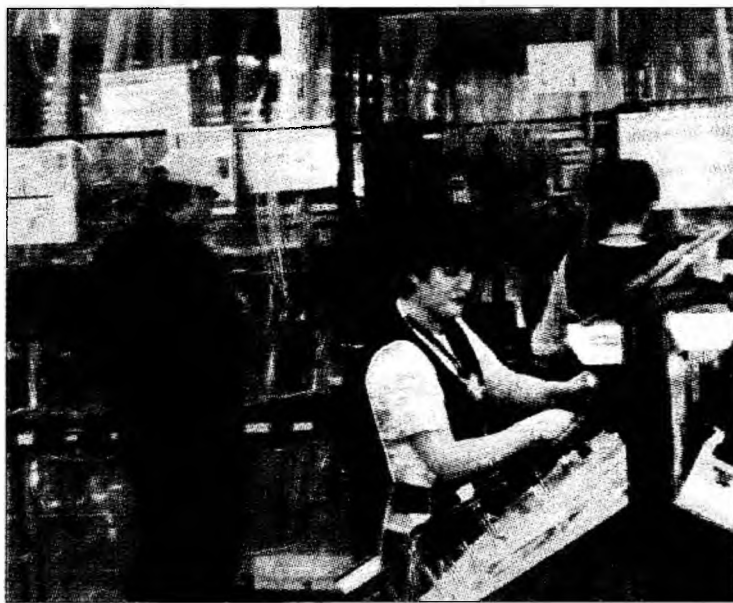
Salariții SEWS Deva în timpul procesului de producție.