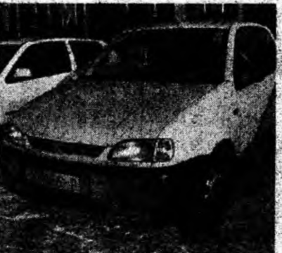
Seat Arosa 1.0 MPI , af. 2001, benzină, euro 4, radiocas şi CD. Preţ 5 300 euro, negociabil. Tel. 0722/639426 ; 0744/567063.