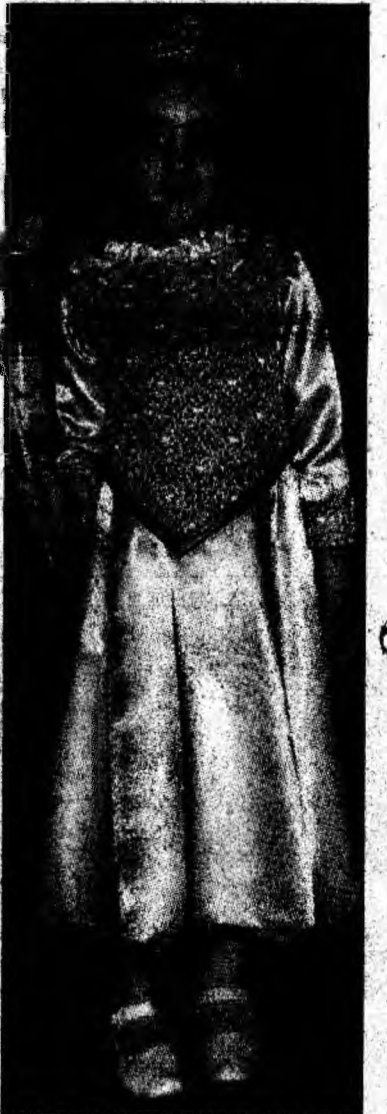
Micuța prințesă a balului.