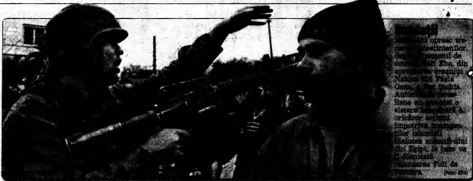
George W. Bush și Vladimir Putin în timpul unei discuții la Casa Albă. În spate: Barack Obama și Hillary Clinton.

Premierul thailandez în exercițiu, Thaksin Shinawatra, a anunțat că partidul său, Thai Rak Thai, a câștigat alegerile legislative în Rusia, obținând 399 de mandate din totalul de 500. Thaksin a mulțumit alegătorilor pentru „susținerea masivă” acordată.