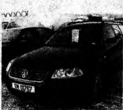
VW Passat Variant 2.0 I , af. 2001, climatronic, fulloption. Preţ 10 500 euro, negociabil. Tel. 0742/394479.