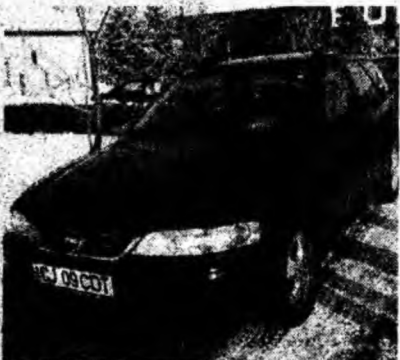
Opel Vectra 2.0 DTI , af. 2001, fulloption, diesel. Preţ 9 200 euro, negociabil. Tel. 0720/248818.