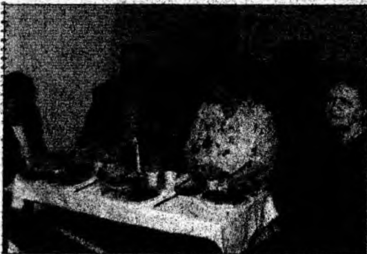
Cina festivă a inclus alimente interzise în post.