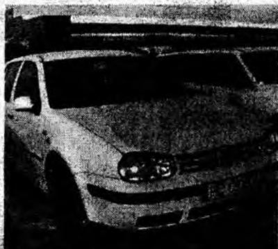
VW Golf IV , af. 2001, diesel. Preţ 7 950 euro. Tel. 0722/663724.