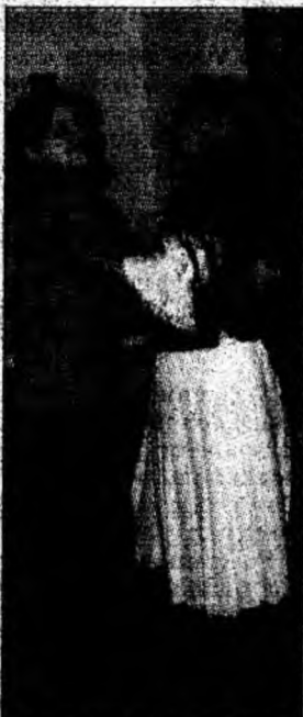
...nici doamnele și domnișoarele