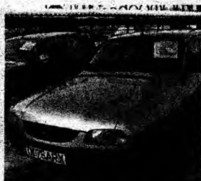
Dacia 1310 L I , af. 2003, 19 000 km reali. Preţ 143 mil. lei. Tel. 0723/270548.