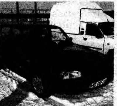
Dacia 1310 , af. 1999. Preţ 95 mil. lei, negociabil. Tel. 0254/743536.