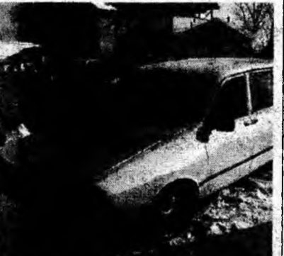
Dacia 1310 TLX , af. 1988. Preţ 31 mil. lei, negociabil. Tel. 0743/837752.