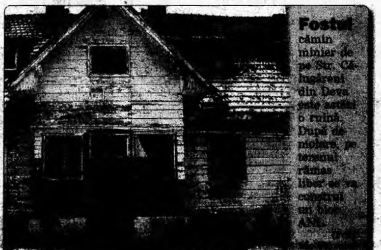
Fostul câmin minier de pe Str. Călugărașilor din Deva este într-o ruină. După de moștenire pe terenul rămas liber se va construi un bloc de apartamente.

Formatul electronic al situațiilor financiare anuale se obține prin folosirea programului elaborat de M.F.P. Acest program este pus la dispoziție în mod gratuit de către DGFP Hunedoara sau poate fi descărcat de pe serverul de web al M.F.P..