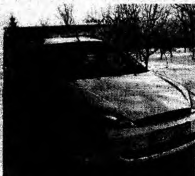
Ford Focus Turnier , af. 2001, diesel, fulloption. Tel. 0745/364948 ; 0254/233566.