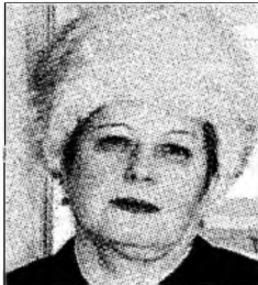
Ed. Silvia Urs.