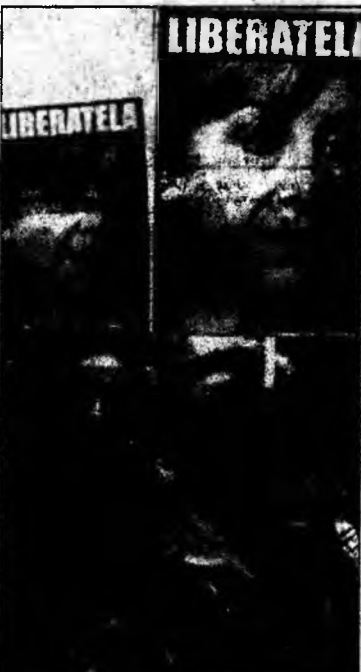
Italienii cer eliberarea ziaristei

Un responsabil de rang înalt al Departamentului de Stat a declarat că Rice a avut o discuție de două ore și jumătate cu Lavrov, la Ankara, a patra etapă a turneului pe care șeful diplomației americane îl întreprinde în Europa și Orientul Mijlociu.