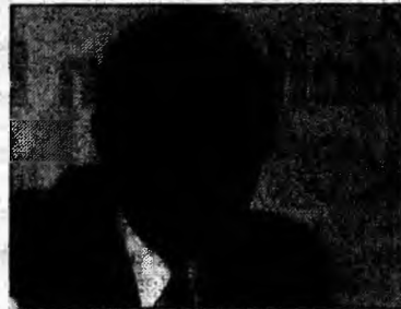
Dr. Mircea Artean.

Ministrul Sănătății a semnat un ordin prin care a decis reducerea taxelor care trebuie plătite anual pentru a obține a doua specialitate, de la 2.000-3.000 euro la sume cuprinse între 200 și 300 euro. Candidații interesați trebuie să depună dosare la Ministerul Sănătății în perioada 1-21 martie 2005 inclusiv sau le pot transmite prin poștă, cu confirmare de primire. Pentru a fi luate în considerare, cererile de înscriere la programul de pregătire în cea de-a doua specializare, transmise până acum la ministerul de resort, trebuie actualizate.