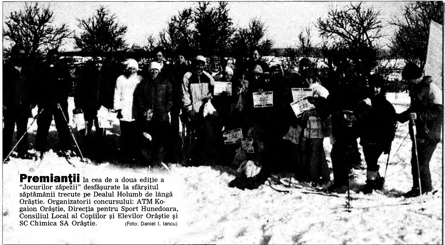
Premianții la cea de a doua ediție a „Jocurilor zăpezii” desfășurate la sfârșitul săptămânii trecute pe Dealul Holumb de lângă Orăștie. Organizatorii concursului: ATM Kogaion Orăștie, Direcția pentru Sport Hunedoara, Consiliul Local al Copiilor și Elevilor Orăștie și SC Chimica SA Orăștie.