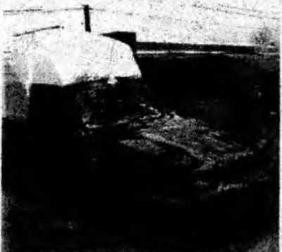
Dacia papuc , af. 1995, benzină şi gaz. Preţ negociabil. Tel. 0722/521935 ; 0724/996847.