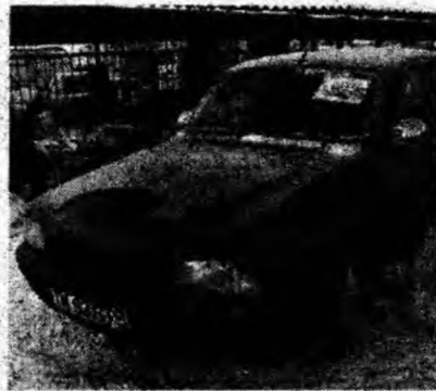
Dacia 1310 L I , af. 2000, injecţie, geamuri ionizate, închidere centralizată. Preţ 105 mil. lei. Tel. 0723/270348.