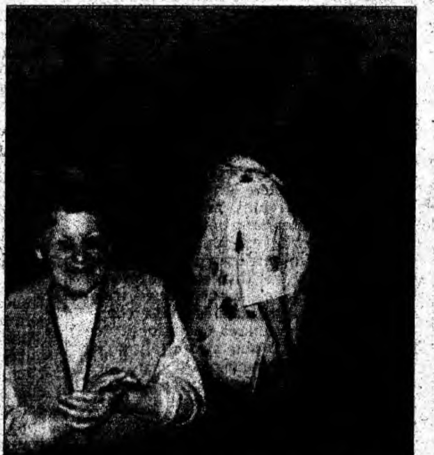
Până la urmă toată lumea a intrat în dans.