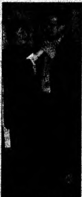
...nici responsabilul cultural.