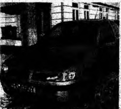
Seat Ibiza , af. 2002, diesel, servo, airbag, trapă. Preţ 6 950 euro. Tel. 0740/063487.