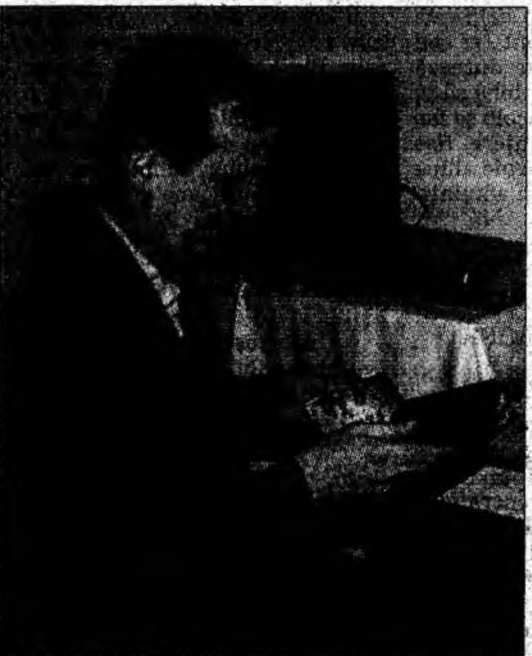
DJ-ul alege muzica potrivită pentru dans.