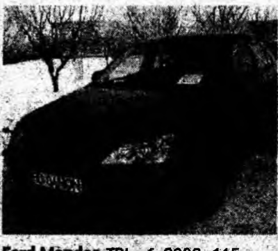
Ford Mondeo TDI , af. 2002, 115 cp. Climatronic, navigaţie color mare, diesel, fulloption. Preţ 10 950 euro, negociabil. Tel. 0727/228473.