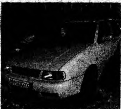
VW Polo 1.4 MPI , af. 2001, benzină, servo, airbag, trapă. Preţ 6 500 euro, negociabil. Tel. 0722/639426 ; 0744/567063.