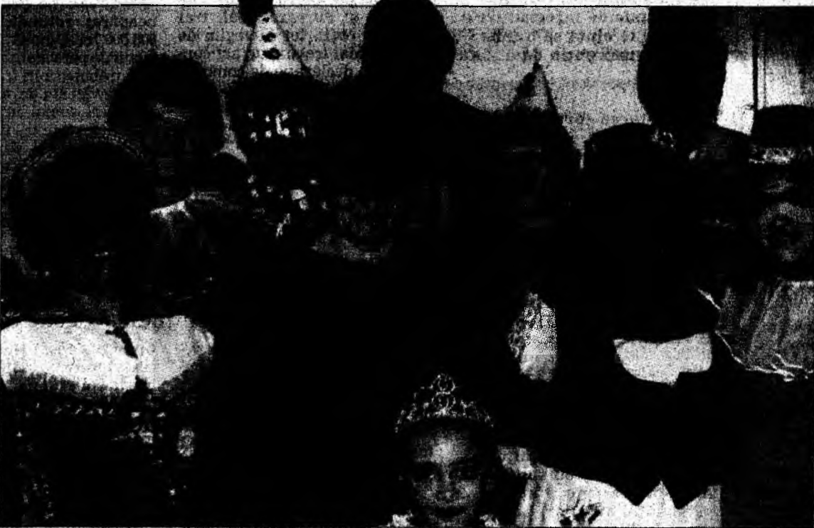
Zâmbete fericite în spatele măștilor.