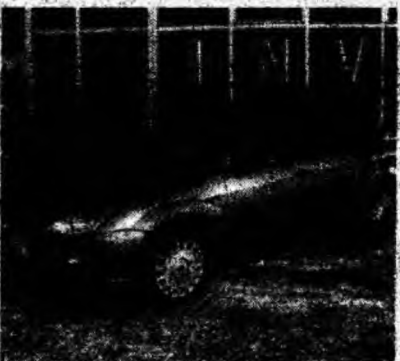
Ford Focus Sedan , af. 2000, fulloption, diesel, 5%, se dă şi factură. Preţ 9 200 euro. Tel. 0721/707741.