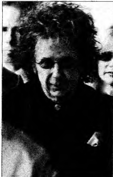
Phil Spector