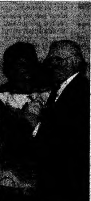
Nu e un băiat nici bunicii...