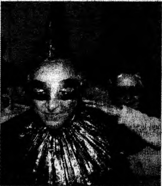
Pregătire pentru participarea la parada măștilor.