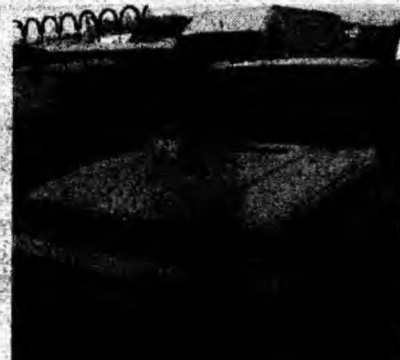
Volvo 340 , af. 1987, economizor, motor Renault. Preţ 65 mil. lei. Tel. 0722/794788 ; 0254/225578.