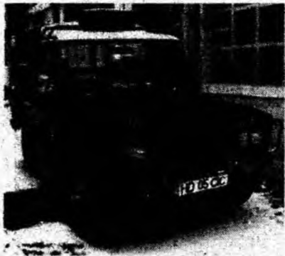
Aro 234 , af. 1989, 8 locuri, motor de Braşov, stare foarte bună. Preţ 79 mil. lei. Tel. 0726/761478.