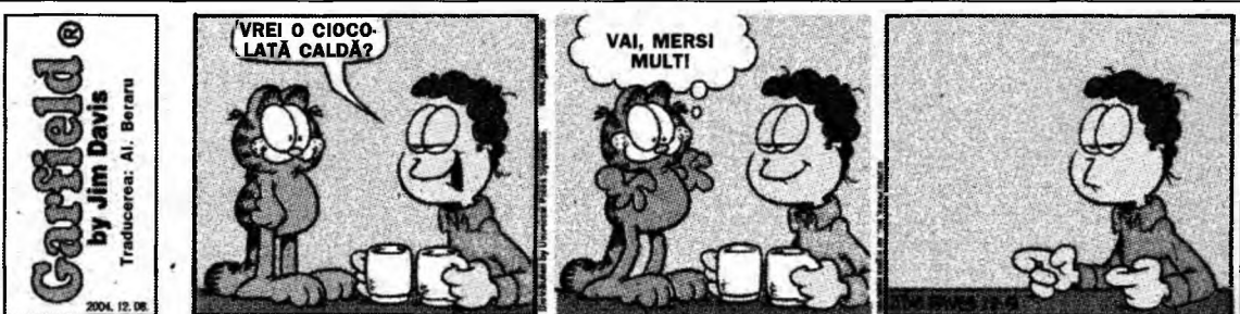
Garfield® by Jim Davis Traducerea: Al. Beraru 2004, 12, 08