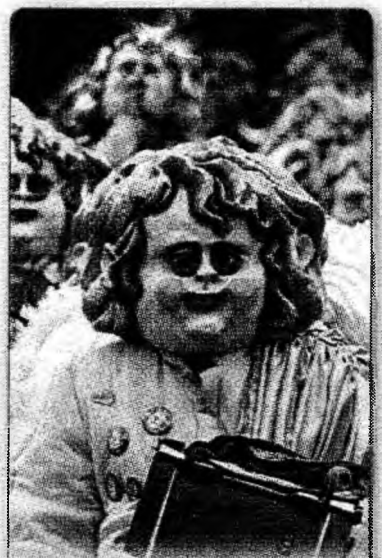
La carnaval Mascarii au sărbătorit joi începutul sezonului de carnavaluri în Lucerna, Elveția.

„Opernball”, reluat din 1877 cu câteva întreruperi, rămâne cel mai frecventat dintre cele trei sute de baluri care au loc în timpul carnavalului vienez („Fasching”), dar și cel mai scump: cele 4.700 de bilete, vândute cu un an în avans, au prețuri situate între 215 și 16.000 de euro.