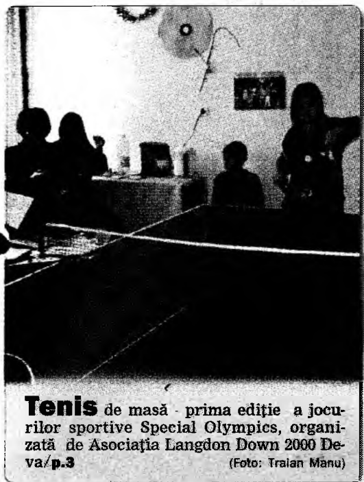
Tenis de masă - prima ediție a jocurilor sportive Special Olympics, organizată de Asociația Langdon Down 2000 Deva/p.3