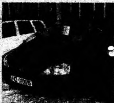
Opel Corsa C , af. 2001, servo, airbag, ABS, benzină. Preţ 6 200 euro. Tel. 0722/639426, 0744/567063.