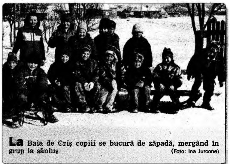
La Baia de Criș copiii se bucură de zăpadă, mergând în grup la săniuș.

nicipiului Orăștie. Pe de altă parte, consilierul PSD, Ioan Pașca, a cerut să fie vândute și terenurile aflate sub garajele construite între blocuri, idee susținută și de colegul său de partid Petre Arapu, dar acest amendament nu a fost aprobat. „Știu că o să apară discuții asupra acestui aspect, dar am decis să vindem acele terenuri de pe urma cărora ar putea intra în bugetul local aproximativ trei miliarde de lei. Avem mare nevoie de bani, dar de pe terenurile de sub garaje nu putem obține prea mult”, a mai declarat Iosif Blaga. Astfel că totul a rămas la fel cum a propus inițial primarul.