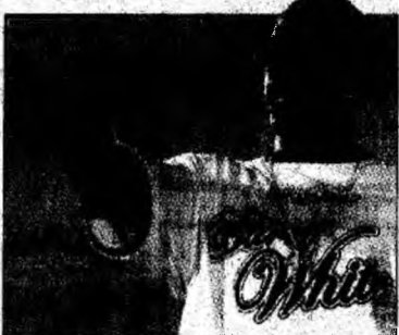
Starul hip-hop P Diddy

O altă celebritate care a fost de acord să-și scrie memoriile, dar nu a făcut-o, este Mick Jagger, care a primit avans o sumă cu șapte cifre. Solistul trupei Rolling Stones a returnat însă avansul, spunând că nu-și poate aminti nimic interesant.