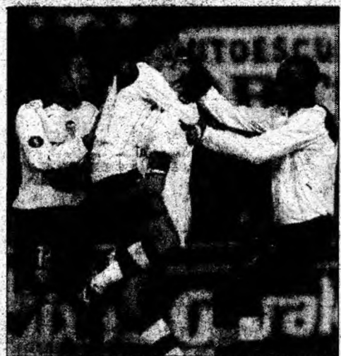
"Lillecii" au avut motive de bucurie.

Site-ul forumului fotbalistic european remarcă eleganța lui Aymar, care a orchestrat jocul de pe partea dreaptă, oferind mingi lui Di Vaio și Baraja. "Palop a arătat că merită să fie inclus titular în locul lui Santiago Canizares, zădărniciind fiecare contraatac al Stelei. Andrei Cristea și Mircea Rădoi au fost cei mai periculoși jucători ai echipei adverse, dar Valencia a controlat meciul", notează UEFA.