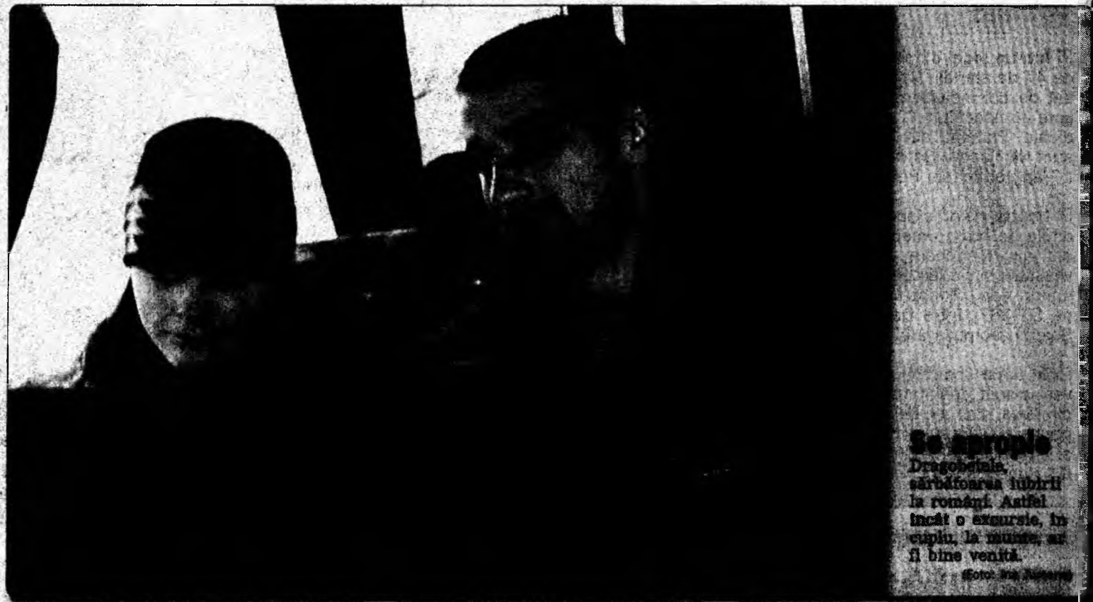
Se apropie Dragobetele, sărbătoarea iubirii la români. Astfel, încălci o excursie în cuplu, la munte, ar fi bine venită.

Realizată realizată de SIVM SIB FINWEST SA DEVA, b-dul Decebal, bl. R. parter (faza QUASAR), tel.: 221277.