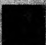
PETRE MĂRGINEAN, PREȘEDINTELE PUR HUNEDOARA

Deși s-a semnat de foarte puțină vreme, în toate județele s-a transmis ca Protocolul să se respecte. În acest fel se va crea o majoritate în consiliile locale și județene. Nu se mai putea continua în felul în care s-a procedat în anumite locuri. La nivel central se respectau înțelegerea, dar la nivel local, consilierii votau împotriva Coaliției.