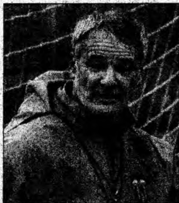
Claudio Ranieri și Walter Zenga, doi italieni celebri

"Victoria a venit la momentul potrivit. Am trecut printr-o perioadă grea și este un succes important. Sunt bucuroși. Steaua