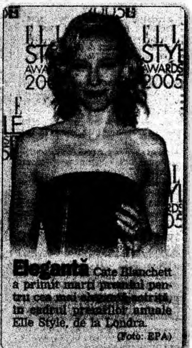
Elegantă Cate Blanchett a primit marți premiul pentru cea mai frumoasă actriță, în cadrul premiilor anuale Elle Style, de la Londra.