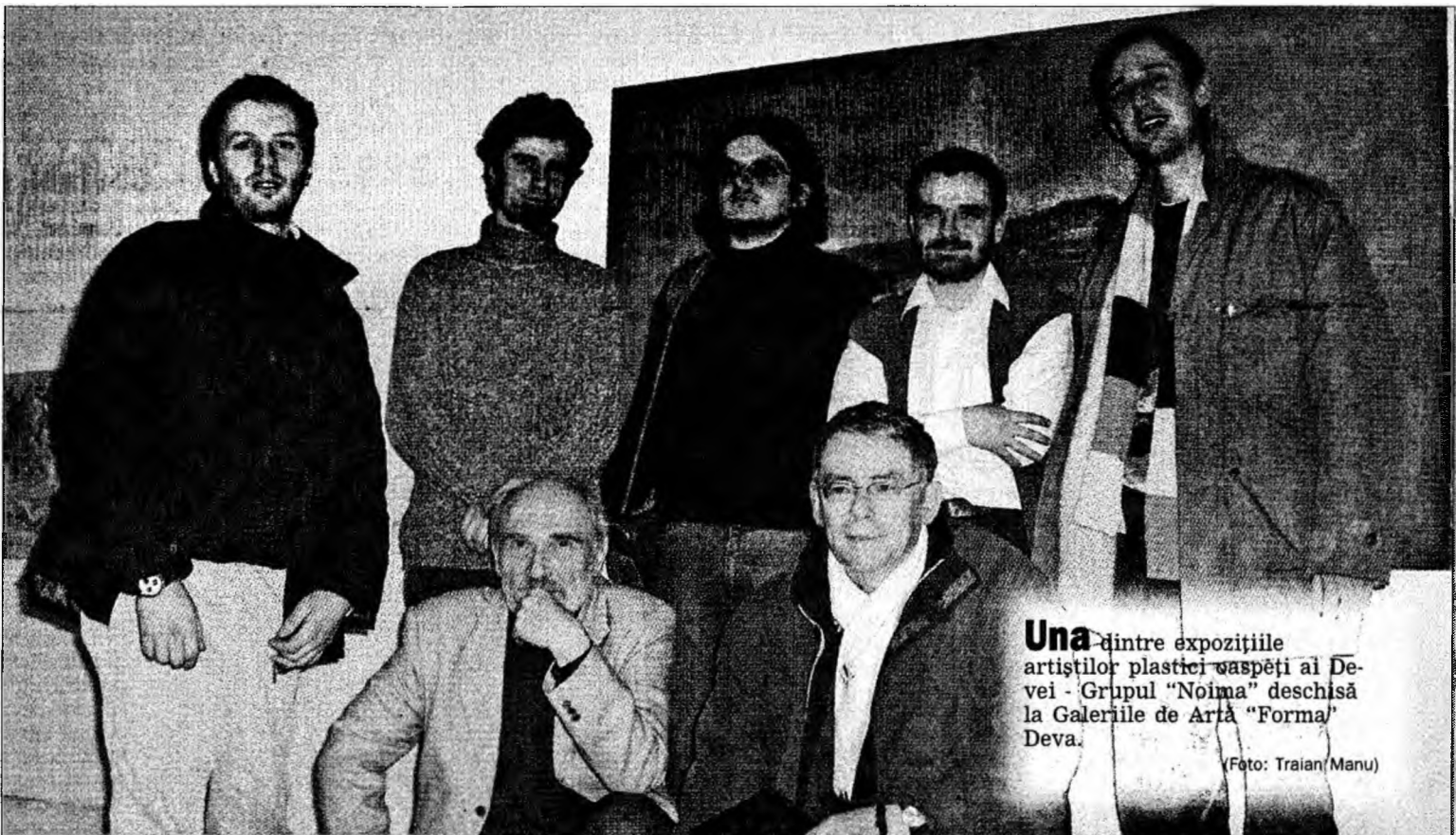
Una dintre expozițiile artiștilor plastici vaspedei ai Devei - Grupul "Noima" deschisă la Galeriile de Artă "Forma" Deva.