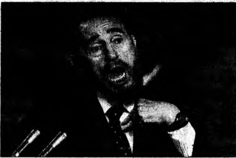
Președintele Cubei, Fidel Castro