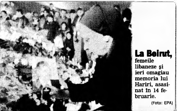
La Beirut, femeile libaneze și ieri omagiau memoria lui Hariri, asasinat în 14 februarie.