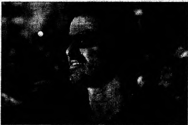
George Michael aplaudat de fani la Berlin

Discret de obicei în ceea ce privește viața personală, cântărețul a ales de data aceasta să fie deschis. „Nu este greu să-ți găsești un partener dacă ești homosexual în 2004; mai ales pentru mine”, declară el cu umor în documentarul cu o durată de o sută de minute. Cântărețul vorbește pentru prima dată în acest