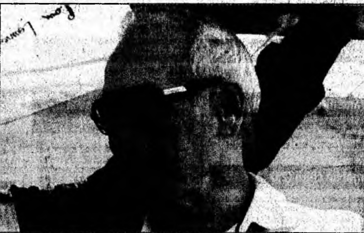
Newman va renunța și la actorie, și la cursele de mașini.

Newman, care a fost nominalizat la Premiile Oscar de zece ori de-a lungul carierei sale, a declarat că va renunța și la actorie, și la practicarea curselor de mașini, pasiunea sa de o viață. El a spus însă că înainte de a se retrage vrea să facă un ultim film,