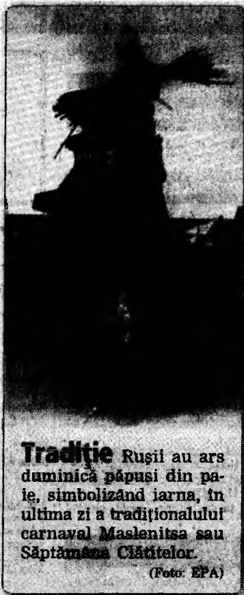
Tradiție Rușii au ars duminică păpuși din paie, simbolizând iarna, în ultima zi a tradiționalului carnaval Maslenitsa sau Săptămâna Ciătitorilor.