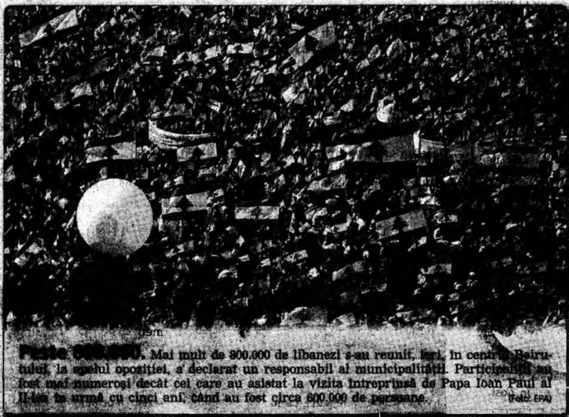
Peste 500.000. Mai mult de 500.000 de libanezi s-au reunit, ieri, în centrul Beirutului, la apelul opoziției, a declarat un responsabil al municipalității. Participanții au fost mai numeroși decât cei care au asistat la vizita întreprinsă de Papa Ioan Paul al II-lea în urmă cu cinci ani, când au fost circa 600.000 de persoane.

Haga (MF) - Fostul premier al provinciei Kosovo, Ramush Haradinaj, împotriva căruia TPI a formulat 37 de capete de acuzare pentru crime de război și crime împotriva umanității, a pledat nevinovat, ieri. Avocatul său a precizat că va solicita eliberarea provizorie a clientului său, în așteptarea procesului. Haradinaj este acuzat de declanșarea unei campanii de persecuții împotriva civililor sârbi și romi, în timpul conflictului din Kosovo.