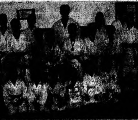
Componenta CS Heian Deva câștigătoare la Campionatul Național.

Deva (C.M.) - Primele șase clasate în ierarhia Diviziei A la fotbal în sală s-au calificat pentru play-off, unde vor juca pentru titlul național. Tragerea la sorți a play-off-ului are loc miercuri, 16 martie. Echipele Pandurii Tg. Jiu (locul 18) și Poli Timișoara (locul 14) retrogradează direct în Divizia B, de unde promovează pe prima scenă ocupantele locurilor 1 și 2, Athletic Club Pitești și Dunărea Galați. Echipele clasate pe locurile 11 și 12 în Divizia A, CS Semic Craiova și Eurolines București vor disputa meci de baraj (joc unic pe teren neutru), cu formațiile clasate pe locurile 3 și 4 în Divizia B, Unirea Seini și IMI Tg. Jiu.