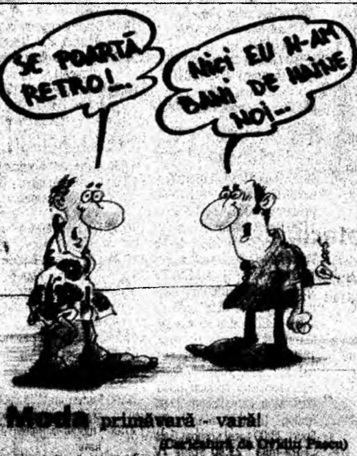
Moda primăvară - vară! (De la stânga la dreapta: Păruș)

Deva (C.P.) - Nivelul apelor râurilor din județ este sub cotele de atenție, fapt pentru care până luni nu au fost semnalate inundații, au declarat reprezentanții Compartimentului de Apărare împotriva Dezastrelor al SGA Deva. Există însă o avertizare hidrologică conform căreia până joi se menține riscul producerii de astfel de evenimente în bazinul Crișului Alb, dacă vremea se va încălzi brusc. Prognoza meteo arată că astăzi, în județ, temperaturile se vor încadra între 4 și 14 grade. Izolat va ploua slab.