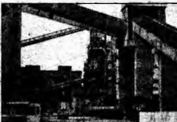
Fabrica de la Chișcădaga.