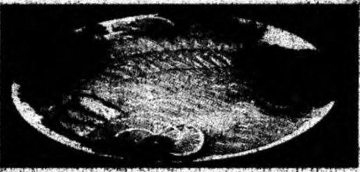
Pește vom mânca doar de două ori în post.

Deva (V.R.) - De luni a început Sfântul și Marele Post, care se mai numește și postul patruzecimii, Păresimile sau Postul Paștilor și urmărește curățirea sufletului prin ajunare, rugăciune, milostenie, svedenie și împărtășanie. El închipuiește postul de patruzeci de zile al Mântuitorului și ține șapte săptămâni. În acest post nu mănâncăm carne, ouă, lactate. Se poate mânca pește la Buna-Vestire (25 martie) și în duminica Floriilor. Se cuvine să postim mai ales în săptămâna de la începutul Postului Mare și în cea a Patimilor. Există însă și persoane exceptate de la ținerea postului, cum sunt copiii, bătrânii și bolnavii. Cei alții se pot hrăni cu produse din soia, legume, fructe (crude ori uscate), murături, măsline, zacuscă, mămăligă, fulgi din cereale, halva, dulceturi ș.a.