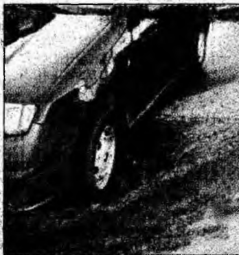
Gropiile distrug mașinile.

Deva - Abia astupate într-un loc, craterele de pe DN 7 răsar într-altul. După municipiul Orăștie, pe raza căruia se tot plombează la gropi fără vreun succes evident, e rândul Devei să se confrunte cu gropile din asfalt transformate în adevărate capcane. Practic, administrația publică locală este obligată, în temeiul unui act normativ care îi stabilește