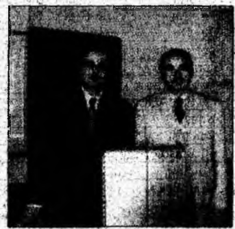
Prezentarea purificatorului de aer "Sharp"