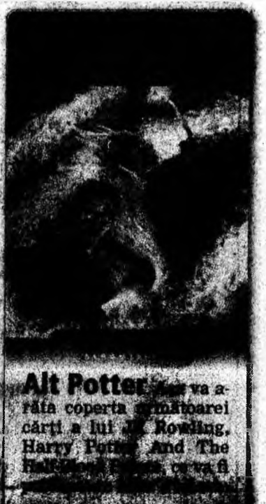
Alt Potter va apărea pe coperta următoarei cărți a lui J.K. Rowling, Harry Potter and The Half-Blood Prince, care va fi lansată în vara următoare.