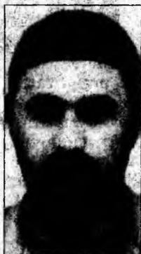
Abu Mussab al-Zarqawi

Ierusalim (MF) - Președintele Autorității Palestiniene, Mahmud Abbas, a cerut poporului israelian să-i acorde încrederea sa, exprimându-și speranța că procesul de pace va fi relansat. „Credem că soluția conflictului nu poate fi găsită decât prin dialog și că utilizarea armelor nu duce la nici un rezultat. Trebuie să aveți încredere în noi”, a afirmat Abbas, care a vorbit în limba arabă.