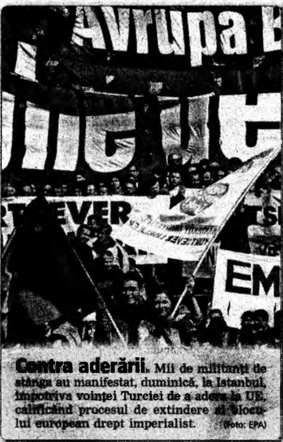
Contra aderării. Mii de militanți de stânga au manifestat, duminică, la Istanbul, împotriva voinței Turciei de a adera la UE, calificând procesul de extindere al blocului european drept imperialist.