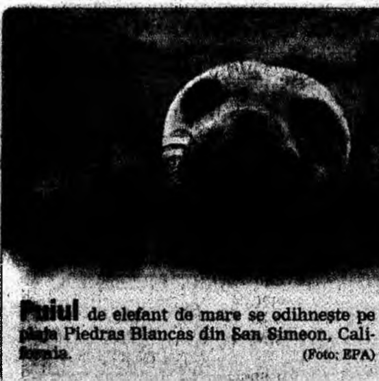
Fotul de elefant de mare se odihnește pe plaja Piedras Blancas din San Simeon, California.