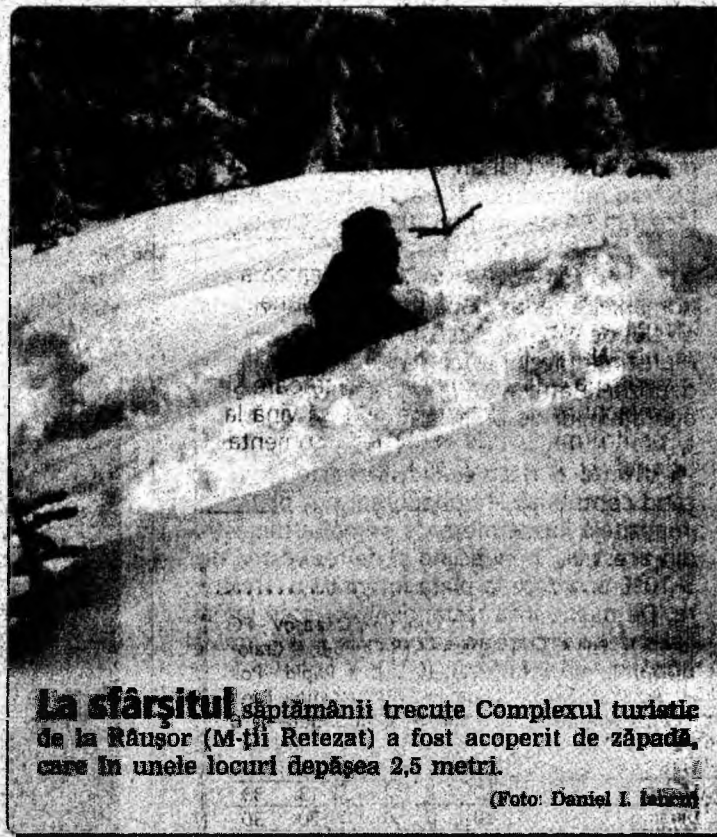
La sfârșitul săptămânii trecute Complexul turistic de la Răușor (M-ții Retezat) a fost acoperit de zăpadă, care în unele locuri depășea 2,5 metri.

„În noua legislație se stipulează că, în România, se instituie un sistem dual de ordine publică, cu polițiști și jandarmi, în cadrul cărora, jandarmii le revin sarcinile de a asigura ordinea și liniștea publică pe timpul desfășurării adunărilor, întrunirilor și manifestărilor publice, intervenția și restabilirea ordinii publice, menținerea ordinii și siguranței publice în stațiunile montane și balneoclimaterice. Într-un asemenea context, și la nivel județean au avut și vor avea loc mutații. Așadar, jandarmii nu vor mai patrula prin orașe. Vor asigura ordinea publică în stațiunile montane - Parîng, Straja, Cîmpu lui Neag, precum și în stațiunea Geoagiu Băi. Urmează, de asemenea, să preia paza la șapte judecătoria și tot atâtea parchete etc.