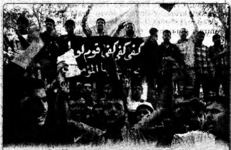
Contra atacurilor. Mii de irakieni au protestat la sfârșitul săptămânii trecute, în fața Ambasadei Iordaniei din Bagdad, pentru a condamnă atacul sinucigaș din 28 februarie, în urma căruia au murit 125 de oameni în Hilla.