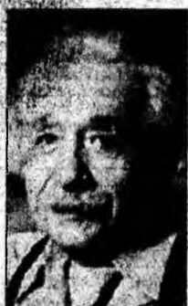
Albert Einstein

Los Angeles (MF) - Filmul de animație „Robots” a încheiat weekend-ul pe primul loc în box office-ul nord-american, cu încasări estimate la 36,5 milioane de dolari, potrivit cifrelor furnizate de compania specializată Exhibitor Relations. „The Pacifier” s-a clasat pe locul doi, cu 18 milioane dolari încasări.