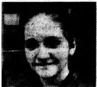
Zillmann R., VIII, lb.germ. (mat.), p.s.