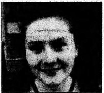
Giurgiu Al., XI, lb.franceză, m.