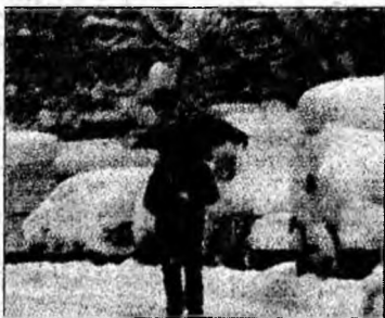
Zăpadă de primăvară

Denver - O neobișnuită furtună de zăpadă s-a abătut asupra statului american Colorado. Aeroporturile, drumurile, dar și activitatea comercială au fost paralizate din cauza zăpezii căzute în plină primăvară. Vremea nefavora-