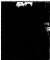
Cookie Monster

Conform notelor de contabilitate din 2004, excentricul Elton John cheltuiește nu mai puțin de 38.000 de lire sterline în fiecare lună pe flori și peste 5.000 de lire sterline la veterinar, pentru animalele sale de companie. Starul britanic poate cheltui dintr-un singur foc suma de 200.000 de lire sterline la bijuteriul său din Londra. Cântărețul britanic a recunoscut că nu se pricepe să economisească bani. Totuși, starul a fost numit cea mai generoasă persoană din Marea Britanie după ce, în 2004, a donat 22 milioane de lire sterline în scopuri caritabile.