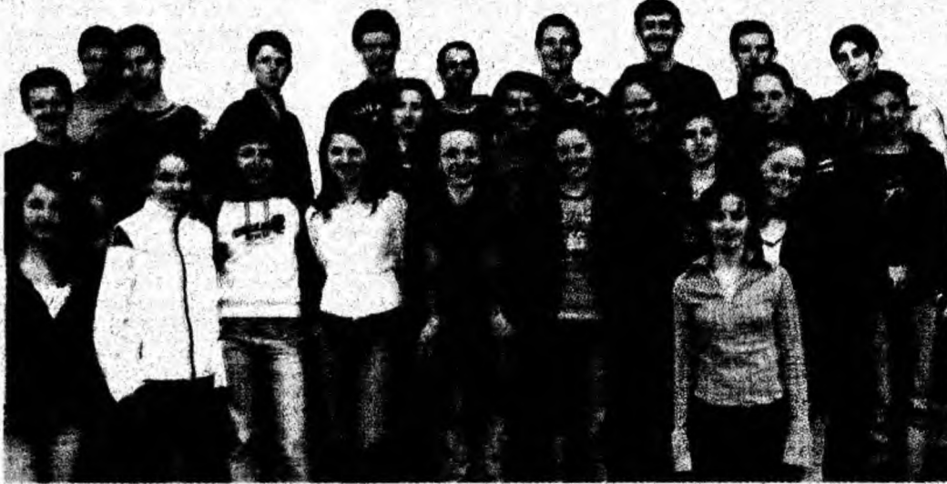
Participanți și premianți la faze naționale ale olimpiadelor școlare.