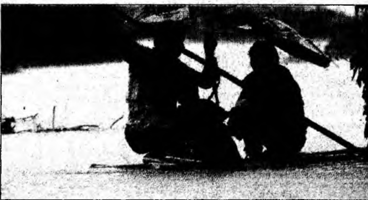
Tragedia s-a produs în statul Madhya Pradesh.

„Până acum am recuperat 38 de cadavre, dar alte 35 de