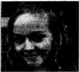
Mișca A., XI, lb.germ. (mat.), p.s.