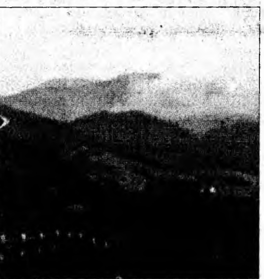
Incendiu pe o pășune din Blăjeni.