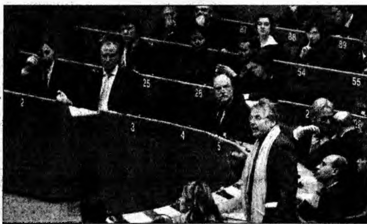
Parlamentarii europeni vor vota mâine.

De asemenea, textul precizează că Parlamentul aprobă tratatul de aderare cu condiția de a fi implicat deplin în procesul de luare a deciziei în