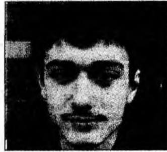
Safar L., X, lb.germ. (mod.), p.II