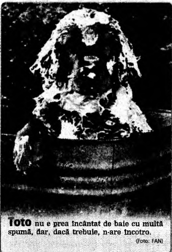
TOTO nu e prea încântat de baie cu multă spumă, dar, dacă trebuie, n-are încotro.

Los Angeles - Cookie Monster, păpușa cu o pasiune pentru dulciuri din „Sesame Street”, va încerca să mănânce mai sănătos, producătorii dorind să educe publicul pentru a preveni obezitatea. De asemenea, Elmo va începe să facă exerciții fizice. Vor apărea personaje noi - vinete și morcovi vorbitori, și vedete care vor vorbi despre importanța unui stil de viață sănătos. Producătorii serialului vor fi axați pe nutriție, exerciții și igienă. Aproape o treime din copiii americani sunt supraponderali în prezent, față de unul din 25 în Marea Britanie.