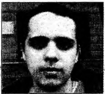
Homorodean R., X, lb.germ. (mat.)