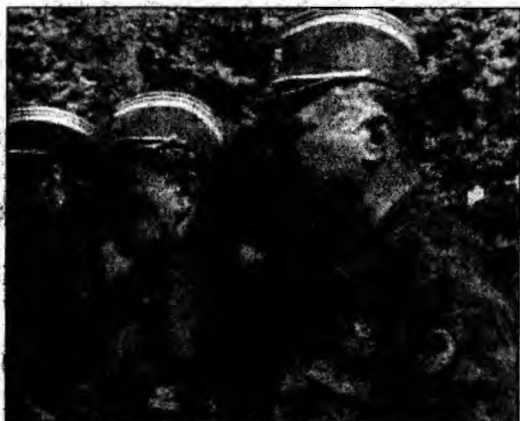
Mladic (d) este încă de negăsit.

Belgrad (MF) - Un subofițer al armatei din Serbia-Muntele Negru, care a dezertat în străinătate, a afirmat că fostul lider militar al sârbilor din Bosnia, Ratko Mladici, se ascundea, în 2004, într-o cazarmă din Belgrad, transmite AFP. Miroslav Petrovici afirmă că a făcut parte, pentru o perioadă, dintre soldații care trebuia să-i asigure protecția lui Mladici. Liderul militar al sârbilor bosniaci este dat în urmărire generală și se ascunde din 1995, când a fost inculpat pentru genocid de către Tribunalul Penal Internațional pentru fosta Iugoslavie (TPI). „Făceam parte din cel de-al treilea inel de securitate din jurul lui Mladici, sarcina mea era să asigur securitatea deplasărilor sale către sud, în cazul în care ar fi fugit în direcția Macedoniei”, mărturisește sergentul Petrovici. Subofițerul afirmă că această misiune i-a fost încredințată pentru că era un foarte bun cunoscător al terenului din sudul Serbiei. Mladici se afla în cazarma de la Topcider în acea perioadă, susține Petrovici.