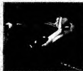
Peugeot-ul a fost distrus.