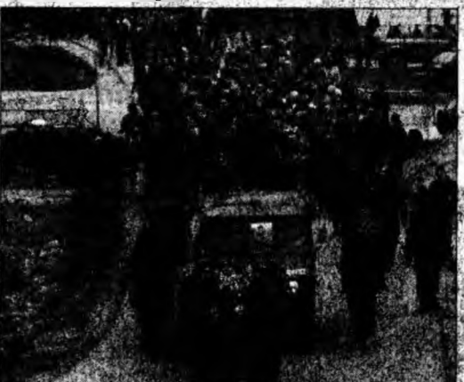
Duminică, la Kosovo au avut loc funeralii de amploare.

Ramush Haradinaj a demisionat din postul său de premier la începutul lunii martie, pentru a se pune la dispoziția tribunalului de la Haga.