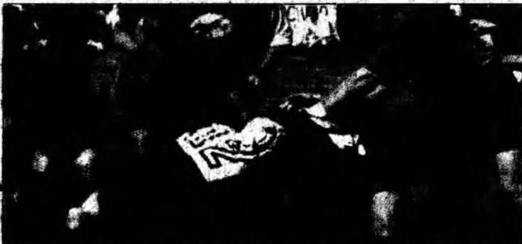
Luptă încinsă pentru posesia mingii