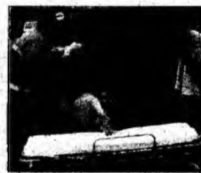
Se transportă victima.