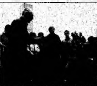
Copăceii vor fi adoptați de copii.

copăcel și tot felul de lucruri interesante despre speciile pe care le vor avea în grijă (larice, mesteacăn, scoruș, paltin, molid).