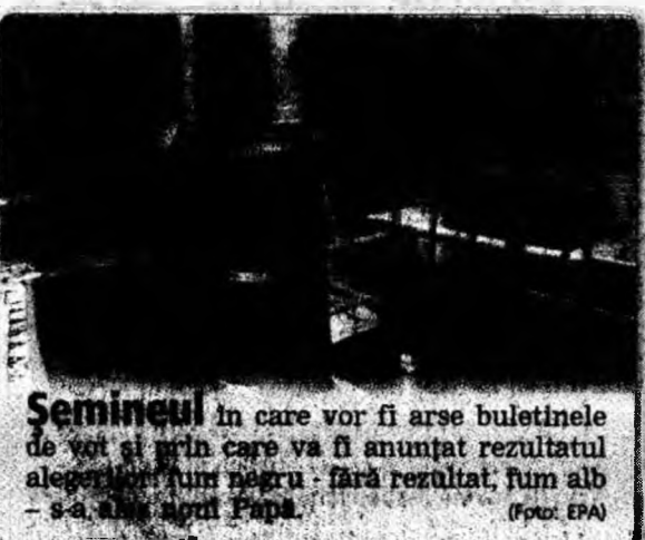
Semineul în care vor fi arse buletinele de vot și prin care va fi anunțat rezultatul alegerii: fum negru - fără rezultat, fum alb - s-a ales noul Papă.