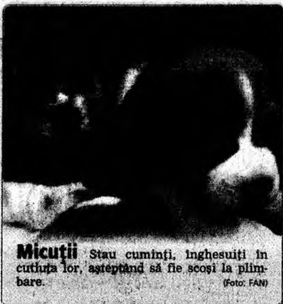
Micuții Stau cuminiți, înghesuți în cutruța lor, așteptând să fie scoși la plimbare.

● Gânduri sinucide. Cântărețul Tom Jones a mărturisit că s-a gândit la sinucidere înainte de succesul melodiei „It's not unusual”, care i-a rezolvat problemele financiare și i-a redat încrederea în sine.