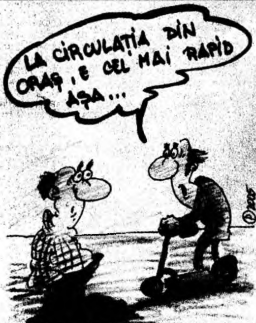
Intoarcere la copilărie. Caricatură de Ovidiu Pascu