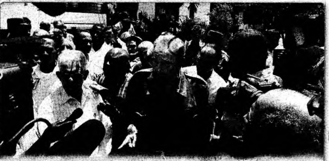
După vot Președintele cubanez Fidel Castro a fost asaltat de presă la ieșirea de la vot. Duminică au avut loc alegeri municipale la Havana, capitala Cubei.