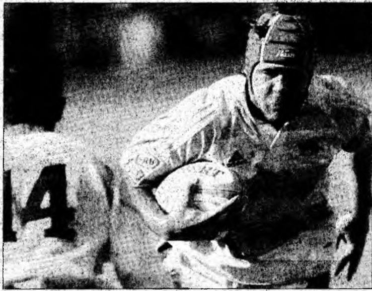
Victoria în fața „pumelor” a făcut înconjurul lumii.