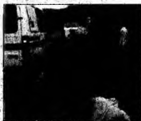
Se acordă primul ajutor.