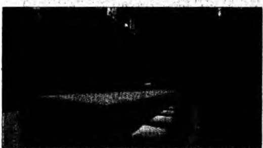
Mesele pentru cardinali

După trei zile fără nici un rezultat, scrutinul este întrerupt pentru o zi de rugăciuni. Apoi, procedura este reluată printr-o serie de șase. Dacă după 33 de scrutinuri tot nu s-a ajuns la un rezultat, cardinalii pot decide o alegere prin majoritate simplă.