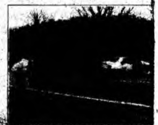
Măsurători la Gurasada.