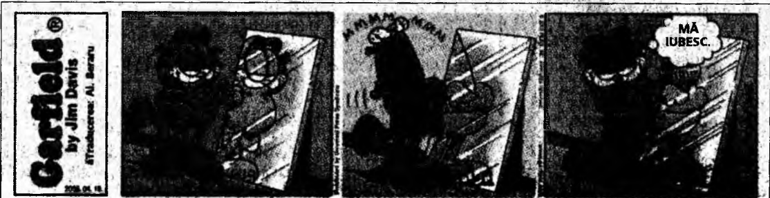
Garfield by Jim Davis

Pentru a vota, ei completează la început o foaie rectangulară care poartă, în partea superioară, mențiunea „Elijo in Summum Pontifi-