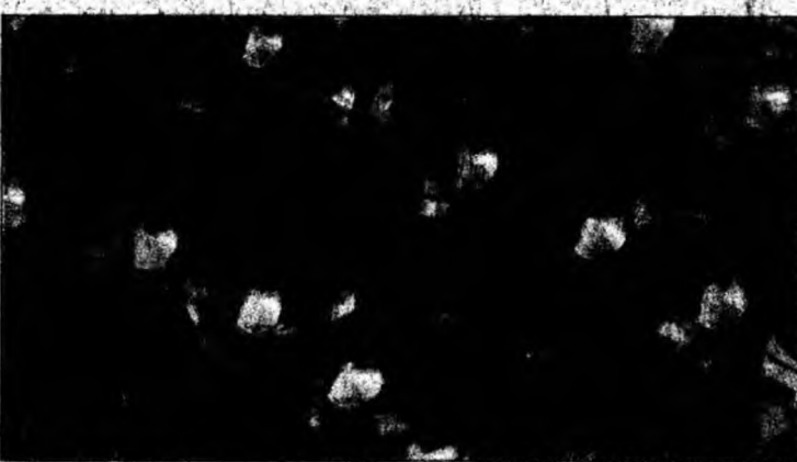
Cardinalii la Slujba consacrată alegerii Papei

După emiterea ordinului „Extra Omnes” (toți afară) și plecarea tuturor persoanelor care nu fac parte din Conclav,