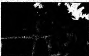
Dezinfectează după ridicarea victimelor.

Împotriva acestei maladii care se transmite prin contact cu fluidele corporale ale unui bolnav nu există un vaccin sau un tratament eficace.