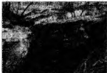
Alunecarea de teren continuă.

produsă în mai multe etape, a dezrădăcinat și rupt 10 copaci, a pus în pericol de pră-