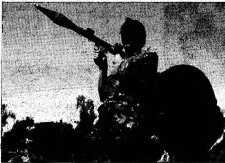
Forțele irakiene și ale coaliției au întreprins o serie de operațiuni pentru eliberarea prizonierilor.