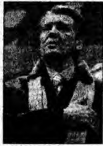
Viktor Iushchenko

Salzburg (MF) - Joerg Haider, liderul istoric al extremei drepte austriece, a fost ales duminică președinte al Alianței pentru Viitorul Austriei (BZOe), în urma Congresului constitutiv al acestui nou partid, rezultat din sciziunea fostei sale formațiuni, FPÖe. Într-un discurs fluviu, liderul populist a justificat crearea BZOe, pe care o anunțase la începutul lunii, menționând „criticile interne, care au împiedicat succesul FPÖe”.