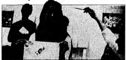
Aspect din timpul desfășurării proiectului.

Deva (R.I.) - Aproximativ 1000 de elevi din județul Hunedoara au participat la proiectul „Drogurileucid!”. Proiectul a constat într-un concurs de videoclipuri și de piese de teatru realizate de elevi de la 34 de licee din județ și a fost organizat de către Cen- trul Județean de Asistență Psihopedagogică Hunedoara. Concursul s-a desfășurat pe par- cursul lunilor februarie-mai, decernarea premiilor urmând să aibă loc în data de 23 mai. Elevii câștigători vor primi premii în bani din partea sponsorilor.