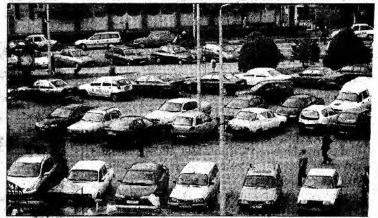
Nu toți primesc 30 de milioane de lei.