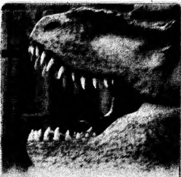
Jurassic Park din Baltow, sudul Poloniei, s-a redeschis duminică pentru public, după ce a fost închis pe perioada iernii.

● La Fatima. Papa Benedict al XVI-lea ar putea merge, în mai 2006, la sanctuarul de la Fatima, pentru a-i canoniza pe Francisco și Jacinta Martos, doi dintre cei trei martori care au asistat la aparițiile Fecioarei Maria în anul 1917.