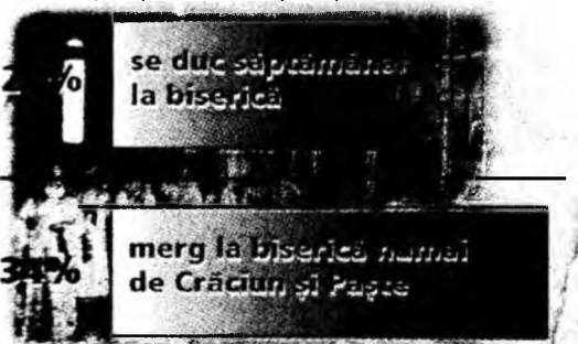
Grafică: Cuvântul liber

Considerați, prin excelență, oameni ai unui popor evlavios, românii își amintesc de biserica mai mult în preajma princi- palelor sărbători religioase. Aceasta reiese dintr-un sondaj recent din care, în final, s-a constatat faptul că peste 86% din intervievați au precizat că vor participa la Înviere.