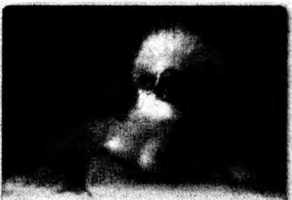
Puiul de vultur cu coada albă se află în țarcul pentru păsări de pradă din parcul Eekholt din Grossenasppe, Germania. În două luni va atinge o deschidere a aripilor de 2,4 m.

Accidente de tren sunt rare în Japonia. În octombrie 2004, calebrelul de viteză Shinkansen a deraiat pentru prima oară în 40 de ani, la un cutremur de pământ.