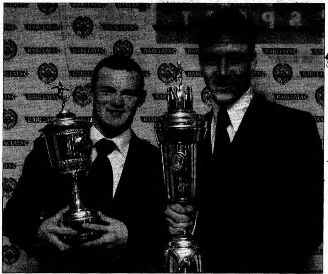
John Terry (dreapta) și Wayne Rooney, performerii campionatului englez de fotbal.

Cealalt nominalizat au fost portarul echipei Chelsea Londra, Petr Cech, mijlocișul formației Liverpool, Steven Gerrard, și atacantul de la Crystal Palace, Andy Johnson, al doilea în clasamentul golgheterilor Angliei (20 de goluri), după Henry (25).