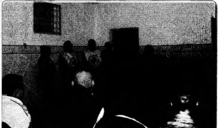
Minorii aflați în detenție la Penitenciarul Bărcea au primit ieri daruri de la Crucea Roșie Deva. /p.5

Boala provenea de la un porc, cumpărat din județul Arad, care a fost sacrificat, iar în zona Baia de Criș a fost instituită carantina.