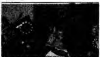
Copiii de la Grădinița din Simeria

Simeria (S.B.) - Centrul de Informare Europa al județului Hunedoara a prezentat, ieri, la sediul său