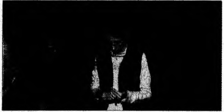
Pentru ortodocși a început Săptămâna Mare.

păcatelor prin spovedanie și împărtășanie. Din bătrâni se spune că sufletele celor care mor în aceste zile găsesc porțile Raiului închise. Tot tradițiile populare spun că în aceste zile sunt interzise tururile și cuvintele urâte.