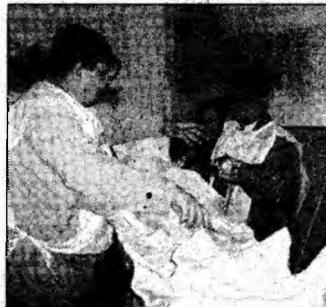
Se pregătesc pachetele