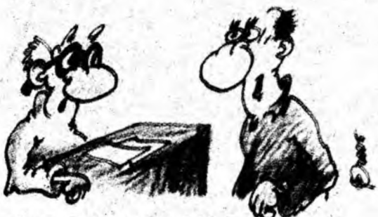
Birou de obiecte pierdute.