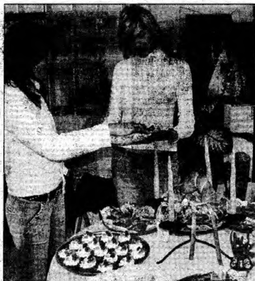
Cadouri de la HD-EXPO 2005.

Hunedoara (M.T.) - În doar câteva zile au fost găsite cinci persoane decedate, în împrejurări suspecte, în județul Hunedoara. Pentru luarea măsurilor legale se efectuează cercetări în cazul de la Orăștie, unde Mihai S., de 67 de ani, din municipiul Turda, a decedat în timp ce se afla cazat la un mini-hotel. La fel se procedează și în cazul bărbatului care a fost tăiat de tren la Zam. O altă persoană decedată a fost găsită într-o anexă a Asociației „Salvați-l pe Lăbuș”, din Deva; este vorba de Iosif H., de 68 de ani, din Deva, iar în cauză nu există suspiciuni de comitere a vreunei fapte penale. În cursul zilei de sâmbătă a fost găsit în Mureș, la stavila numărul 4 a Termocentralei Mintia, cadavru unei femei, de 50-60 de ani, a cărei identitate nu este încă cunoscută. Nici în cazul Floarei P., de 73 de ani, din Rapoltu Mare, găsită decedată în locul numit „Calea Albă”, la ieșirea din localitate spre pădure, într-un părau, nu există suspiciuni de comitere a vreunei fapte penale.