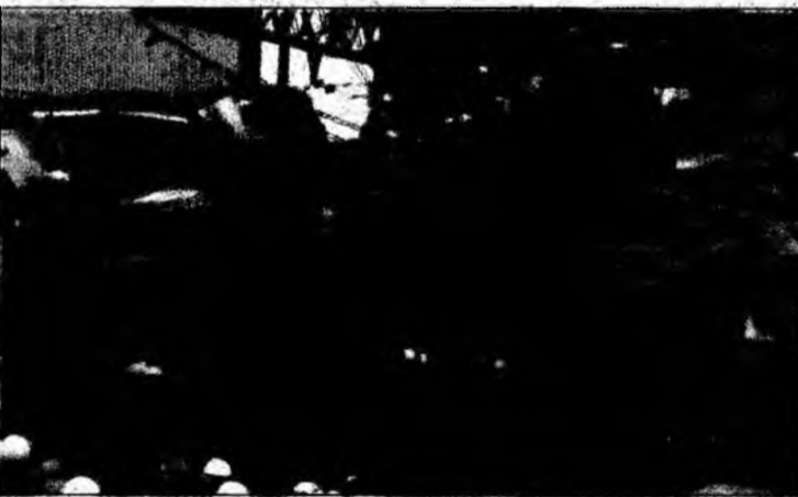
Călătorii au fost prinși între fiarele contorsionate.

Cel puțin 232 de persoane au fost rănite, conform bilan-