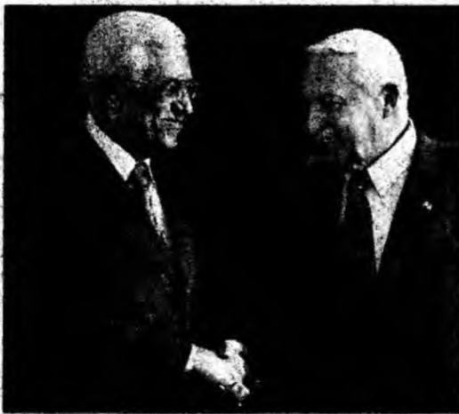
Ariel Sharon și Mahmoud Abbas ar putea reveni la masa negocierilor.

Moscova (MF) - Autoritățile ruse vor organiza, la 9 mai, o reuniune a celor patru garanți ai planului de parcurs, cel mai recent dintre planurile de parcurs între Israel și palestinieni. Această informație a fost confirmată de agenția de presă Itar-Tass, care a citat o sursă neidentificată din cadrul Ministerului rus al Afacerilor Externe. Președintele rus, Vladimir Putin, a anunțat, la 28 aprilie, când se afla în vizită în Egipt, că la data de 8 mai va avea loc o reuniune a celor patru autori ai Foii de parcurs (Statele Unite, UE, ONU și Rusia). Surse din anturajul Înalțului Reprezentant al UE pentru Politică Externă, Javier Solana, au precizat că reuniunea ar putea avea loc la 9 mai. Solana se va afla în vizită la Moscova, la acea dată, împreună cu Benita Ferrero-Waldner, comisarul european pentru Relații Externe și Politică de Vecinătate. Secretarul general al ONU, Kofi Annan, și secretarul de Stat american, Condoleezza Rice, se vor afla, de asemenea, în capitala rusă.