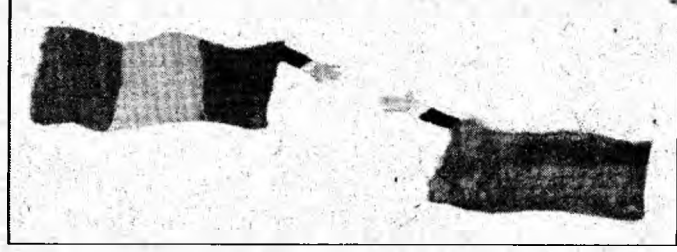
Ziua Europei - 9 Mai - va fi sărbătorită și la Brad

sfârșitul săptămânii, la Casa Memorială „Crișan” și la Panteonul Motilor de la Tebea. „Le-am vorbit elevilor despre faptul că pe 9 mai 1950, ministrul de externe al Franței, Robert Schuman, marca un moment istoric, prezentând ideea unei comunități de interese pașnice”, precizează Elena Coza.