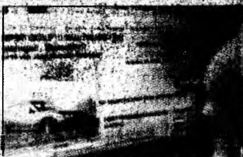
Mașina pe eBay

Licitatia a fost deschisă la 25 aprilie și, între timp, pagina cu oferta tânărului german a fost consultată de 7,4 milioane de utilizatori, un record pentru Germania.