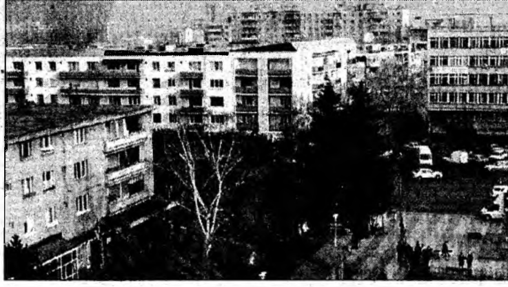
Românii preferă să aibă propria casă