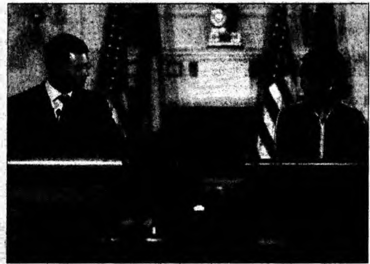
Condoleezza Rice (d) și Mihai Răzvan Ungureanu au discutat despre restructurarea forțelor SUA în Europa.

fi făcut într-un mod precipitat. Trebuie să facem eforturi, pentru că este vorba despre o restructurare pentru circa 50 de ani”, a declarat secretarul de stat la încheierea convorbirilor cu Ungureanu. „Este bine să avem un prieten și un aliat precum România, care este membră NATO, și dorim să concluzionăm cu Guvernul român în legătură cu acest subiect”, a mai spus Condoleezza Rice. La rândul său, Mihai Răzvan Ungureanu a subliniat voința Bucureștilor de a continua să fie alături de Statele Unite pentru „promovarea libertății și democrației în lume”. Potrivit declarației șefului diplomației române, decizia politică de amplasare de baze militare americane în România a fost luată, în urma vizitei președintelui Traian Băsescu în SUA și mai ales a discuției cu președintele George W. Bush, care a generat punerea în