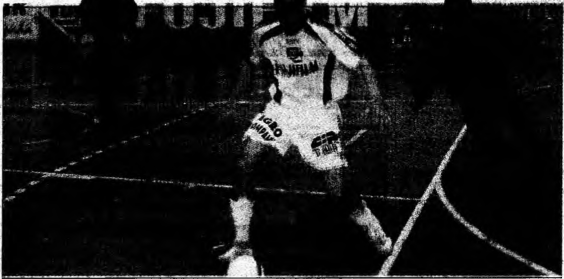
Molomfălean (la minge) a marcat golul egalizator din partida tur

■ CIP trebuie să învingă „lidera” turului în play-off pentru a rămâne în cărți pentru titlu.