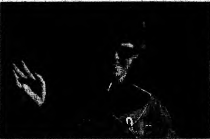
Eileen Collins va conduce echipajul de pe Discovery

Eileen Collins are 48 de ani, este prima femeie care a pilotat și comandat o navetă spațială. Cunoscută pentru sângele ei rece, Collins a condus deja o lansare dificilă în 1999. Alegerea ei pentru a comanda misiunea lui Discovery, cu atât mai importantă pentru că este prima după