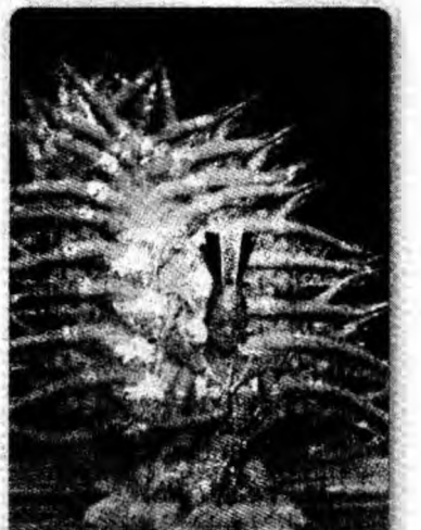
Surde. Un grup de 21 de dansatoare cu defect de auz din China au prezentat un dans ceremonial la World Expo, în Nagakute, Japonia, cu ocazia Zilei Naționale a Chinei.

În insula Sumatra se înregistrează o activitate seismică intensă, seisme producându-se zilnic.