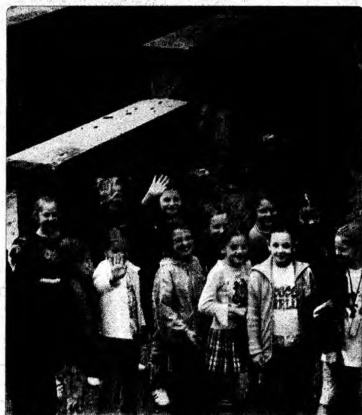
Copiii de la Colegiul Național Sportiv „Getate” Deva au așteptat, în ziua vernisării expoziției, momentul în care au putut să exploreze minunata lume creată de existența florilor de mină.