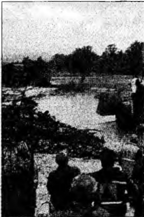
DN7 și calea ferată dintre Deva și Ilia au fost inundate de puhoaiile de apă revărsate în urma ruperii de nori