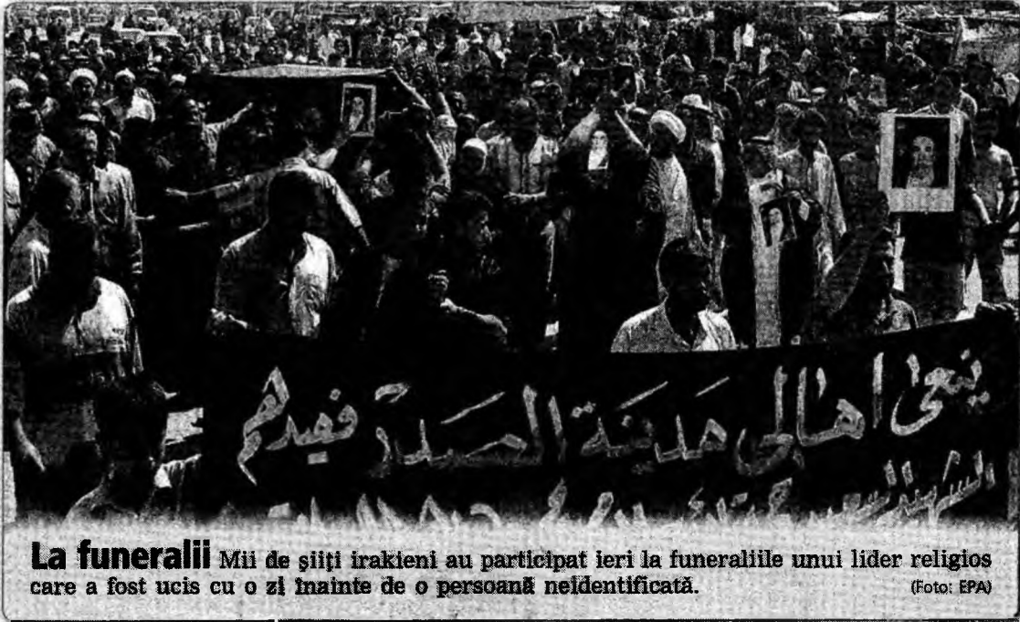
La funeralii Mii de șiiți irakieni au participat ieri la funeraliile unui lider religios care a fost ucis cu o zi înainte de o persoană neidentificată.

PSD mulțumește socialiștilor europeni, în numele membrilor și militanților săi, pentru solidaritatea lor, inclusiv în ceea ce privește efortul României de a adera la UE și îi asigură pe toți partenerii săi de dorința sa de a coopera loial și onest la afirmarea PSE ca un actor politic major al unei Europe unite.