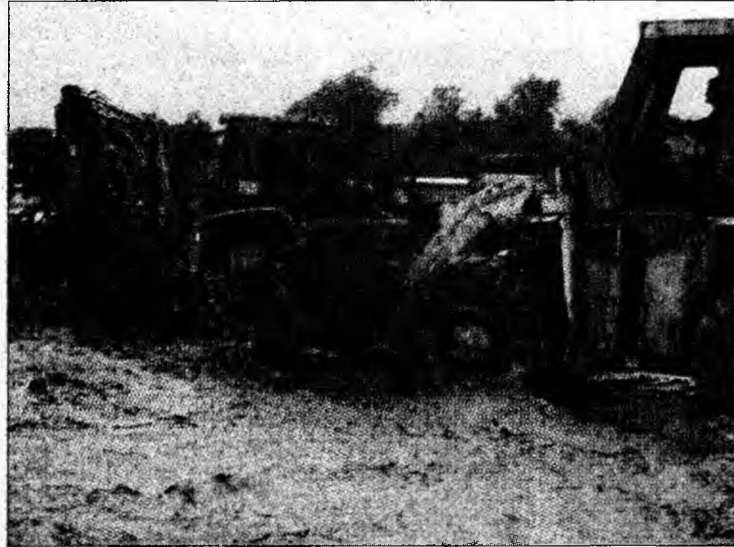
Utilajele au lucrat din greu să deblocheze DN7

Au mai fost afectate drumurile comunale dintre localitățile Vețel și Căoi, Vețel-Herepeia și Leșnic-Boia Bârzii, unde apa a depășit în unele locuri 30 de centimetri înălțime. În comuna Brănișca drumurile au fost afectate pe o lungime de 14 kilometri, iar în localitatea Cârjiți este inundat drumul județean 708, pe o lungime de 30 de metri, iar apa depășește