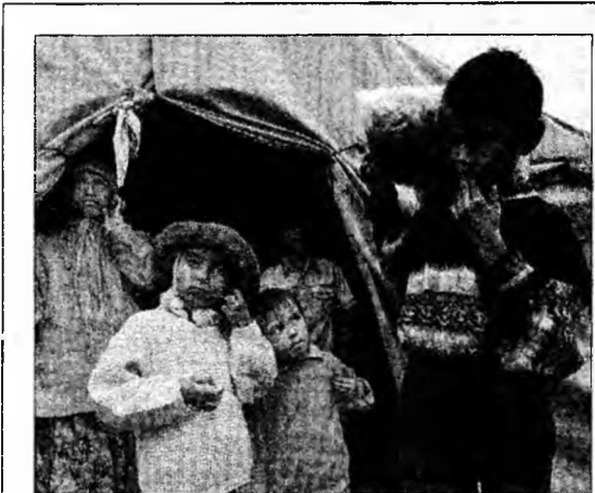
Sute de refugiați uzbeki la granița cu Kirgistanul