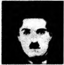
Charlie Chaplin

Prințul Rainier al III-lea, decedat la 6 aprilie, a înmănat trofeul la primul Grand Prix al Principatului Monaco, disputat în 1950 și câștigat de argentinianul Juan Manuel Fangio. Duminică, pentru prima oară, fiul său Albert, în vârstă de 47 ani, va înmăna trofeul învingătorului.