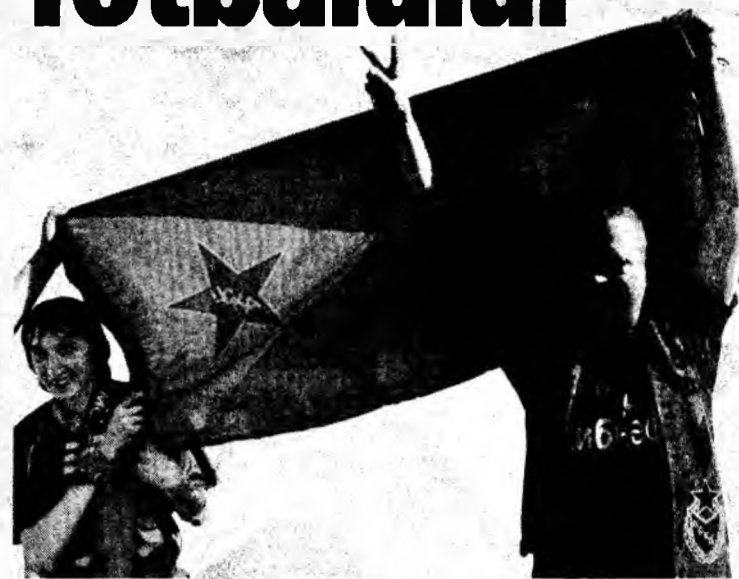
Suștinătorii ruși, mândri de izbânda echipei favorite.

Antrenorul Jose Peseiro este mândru de jucătorii săi și de faptul că pregătește echipa Sporting Lisabona, apreciind că acest sentiment este mai puternic decât înfrângerea suferită în finala Cupei UEFA.