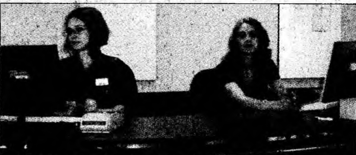
Angajatele casinoului așteaptă clienții să parieze