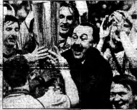
Bucuria a fost mare în tabăra rușilor.