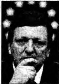
Jose Manuel Durao Barroso

Bagdad (MF) - Autoritatea religioasă sunnită a acuzat direct Organizația șiiită Badr de uciderea unor sunniți la Bagdad. Organizația Badr provine din Brigada Badr, aripa armată a Consiliului Suprem al Revoluției islamice din Irak, unul dintre elementele de bază ale Guvernului majoritar șiiit al lui Ibrahim al-Jaafari.