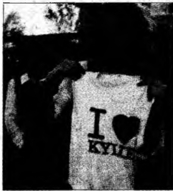
Fanii îi sunt alături.

Tatălui lui Minogue i s-a pus diagnosticul de cancer de prostată în 2002, dar a învins boala.