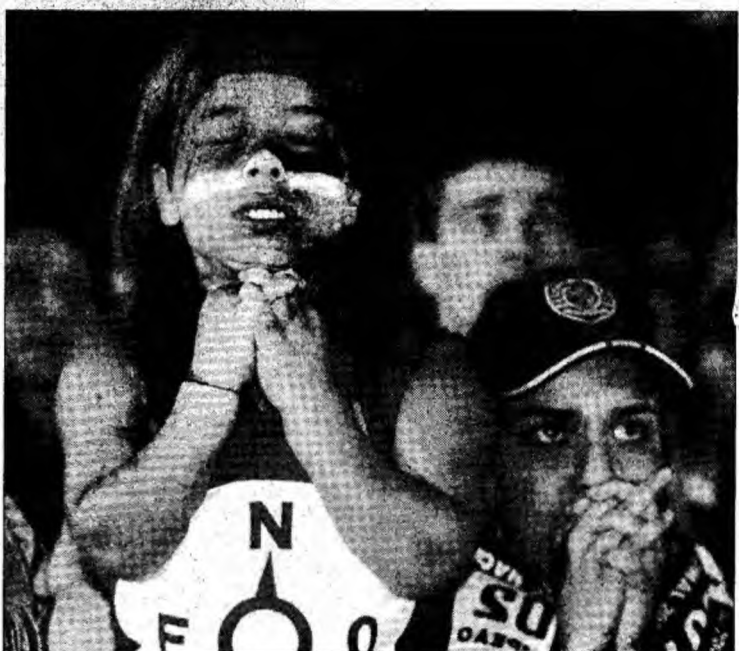
Fanii s-au rugat pentru victoria lui Sporting.

noroc. Au fost mai buni în apărare, dar nu în atac. Suntem dezamăgiți, dar Sporting rămâne una dintre cele mai bune echipe din lume”, au afirmat fanii, vizibil dezamăgiți, la ieșirea din stadion. Suete de suporterii au urmărit finala Cupei UEFA pe un ecran gigant, amplasat în centrul orașului Lisabona. În pofida dezamăgirii vizibile, portughezii au dat dovadă de fair-play și au aplaudat îndelung echipa moscovită. „Suporterii echipei Sporting trebuie să fie mândri de echipa lor, care a făcut totul pentru a câștiga acest trofeu. Însă, uneori, fotbalul este nedrept”, a declarat, la rândul său, internaționalul portughez Luis Figo.