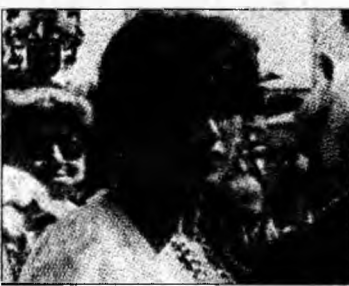
Hoțul ghicea în palmă