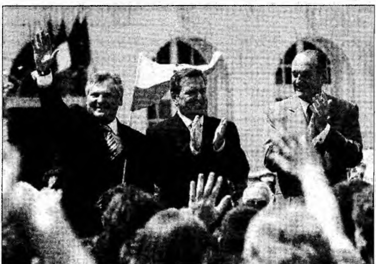
Aleksander Kwasniewski, Gerhard Schroeder și Jacques Chirac, s-au întâlnit ieri la Mancy (Franța), pentru a-și afirma susținerea față de Constituția Europei

Respingerea Constituției ar reflecta o serie de factori, cum ar fi nemulțumirea față de actualul Guvern francez, preocuparea legată de extin-