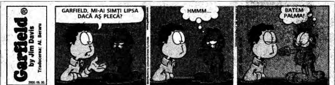
Garfield by Jim Davis Traducerea: Al. Beraru

GARFIELD, MI-AI SIMȚI LIPSA DACĂ AȘ PLECA?