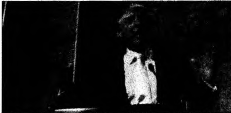
Donald Trump are un plan propriu.

Dacă prima piatră simbol al noii construcții a fost pusă la 4 iulie 2004, deja se fac