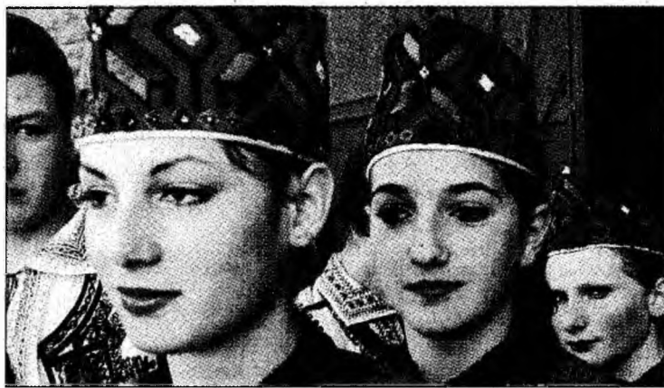
Dansuri populare cu „Stejărelul”

S-a deschis un așa-zis „Târg al narciselor”. De fapt este vorba despre minipiața organizată pe platoul din fața Căminului Cultural despre care am amintit deja. Dar, după ce s-a derulat un spectacol care a îndemnat la cânt și voie bună și spiritele s-au încins, totul merge de la sine!... Oamenii s-au distrat așa cum știu ei să o facă la țară, s-au simțit bine și au uitat de toate neajunsurile.