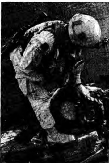
Exploziile fac noi victime, în Irak