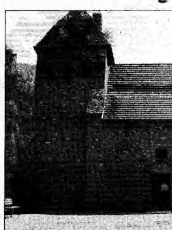
Biserica din Densuș

Lucrările de restaurare au fost făcute de Societatea „Castrum” din Timișoara și au constat în refacerea pavajelor, montarea unei instalații de încălzire, instalații de iluminat”. Tot în acest an mai este prevăzută și realizarea unui centru de informare care să promoveze comuna, a unui complex turistic cu un motel cu 40 de locuri și a unui muzeu memorial.