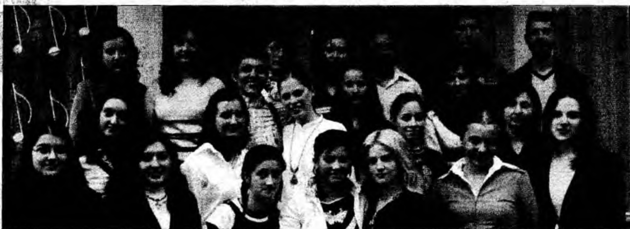
O ultimă fotografie de grup pe scările liceului unde s-au inițiat în tainele artei.