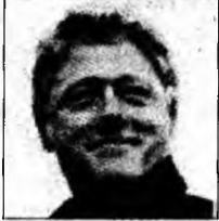
Bill Clinton

Consiliul a reamintit, de asemenea, că începând cu 1 iunie, prin aplicarea cotei TVA de 19% la tariful practicat de societățile de cablu, costurile acestor abonamente vor crește.