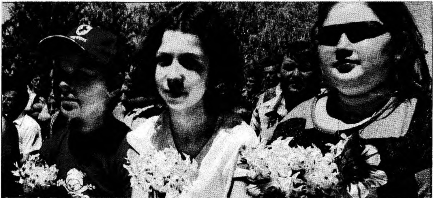
Gingășie și fragilitate printre măcăciuni la Sălașu de Sus

Revenind la victoria lui Băsescu, cu siguranță că marinerul va reuși să speculeze la maximum reușita sa. Iar poporul va vedea în el un om hotărât, capabil să rezolve orice situație. Cu toate acestea însă, guvernul trece la rândul lui printr-o criză. Și nu știu în ce măsură președintele României va reuși să o rezolve. Pentru simplul motiv că în Guvern și în Parlament, Băsescu e scos încet, încet din cărți.