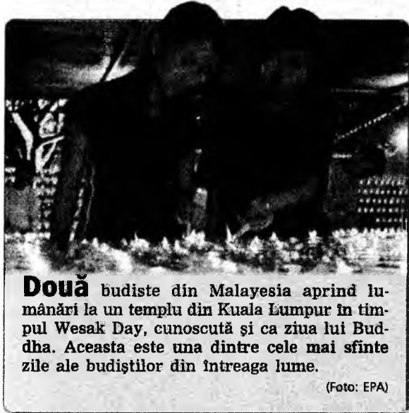
Două budiste din Malaysia aprind lumânări la un templu din Kuala Lumpur în timpul Wesak Day, cunoscută și ca ziua lui Buddha. Aceasta este una dintre cele mai sfinte zile ale budiștilor din întreaga lume.