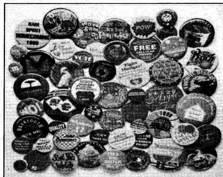
Designul insinelor variază în funcție de cerințele clienților

căreia se vor asambla componentele: două capace transparente unul superior și altul inferior, o folie de acetofan și imaginea decupată pe suportul de hârtie.