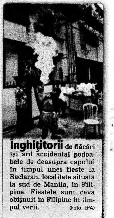
Inghițitorii de flăcări își ard accidental picioarele de deasupra capului în timpul unei fieste la Baclaran, localitate situată la sud de Manila, în Filipine. Fiestele sunt ceva obișnuit în Filipine în timpul verii.