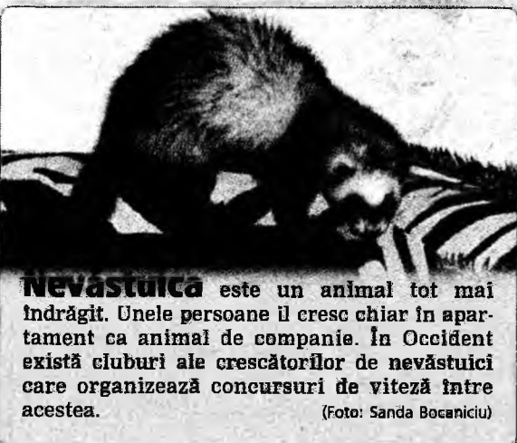
Nevăstuica este un animal tot mai îndrăgit. Unele persoane îl cresc chiar în apartament ca animal de companie. În Occident există cluburi ale crescătorilor de nevăstuici care organizează concursuri de viteză între acestea.

natul intrăm în UE”, iar pe alte mese se aflau simbolurile ale orașelor de unde provin concurenții. Organizatorii au pus la dispoziția echipelor o masă, 10 kilograme de carne, 15 metri de intestine, șepci și șorțuri. Echipele au adus masa pentru umplerea intestinelor, condimente și tot ceea ce a fost necesar pentru prepararea cârnaților, dar și ornamente pentru masă.