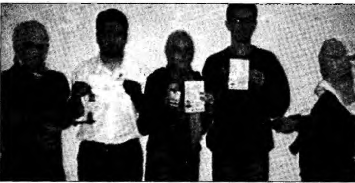
După 54 de zile, cei trei ziaristi au fost eliberați.

Reacțiile pe plan local au apărut imediat după difuza-