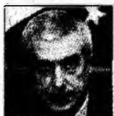
Călin Popescu Tăriceanu

București (A.S.) - Ieri seară, președintele Traian Băsescu s-a întâlnit cu premierul Tăriceanu, cu președinții Camerelor, liderii grupurilor parlamentare, membrii Curții Constituționale și Ministrul Justiției. În urma discuțiilor s-a profilat oportunitatea unui compromis, ce va fi analizat în Parlament, care să permită reformarea Justiției fără a mai fi nevoie de alegeri anticipate. În acest context Premierul a declarat că își va reconsidera demisia astfel încât să nu se ajungă la alegeri anticipate.