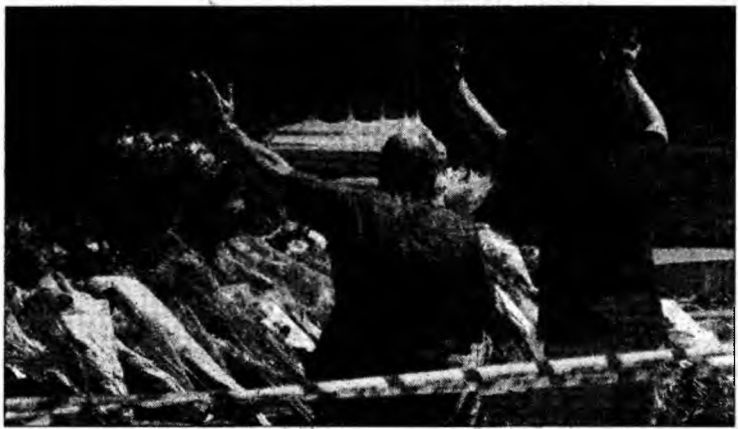
Trecătorii își exprimă respectul pentru victimele atentatului de la Londra

Atentatele comise joi la metroul și într-un autobuz din Londra s-au soldat cu cel puțin 52 de morți și aproape 700 de răniți.