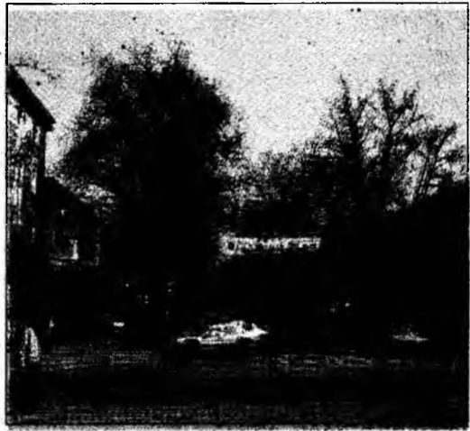
Transportul local de călători va fi concesionat

Hunedoara (C.P.) - Primăria Municipiului Hunedoara va concesiona serviciul de transport public local de călători. În acest sens, consilierii locali au aprobat deja studiul de oportunitate și documentația de pregătire a licitației pentru concesionarea acestui serviciu. Valoarea minimă a redevenței va fi de 3.544,25 lei noi - 35.442.530 lei vechi lunar. Contractul de concesiune se va încheia pe o durată de 10 ani.