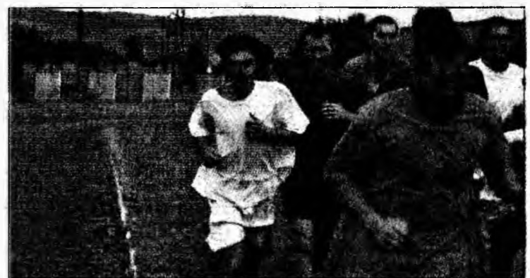
Jucătorii echipei CS Deva la antrenament