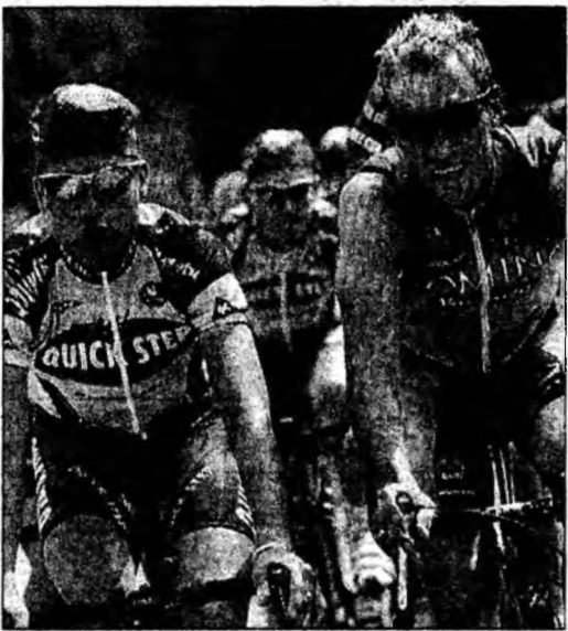
Rutierii au fost supuși ieri unui test inopinat.

În cazul în care valoarea hematoocritelor, hemoglobinelor sau reticulocitelor este mai mare decât normalul, ciclistul în cauză va fi nevoit să aștepte 15 zile până își va primi înapoi licența. Imediat după aceea, sportivul este supus unui test de urină care să arate dacă a folosit eritropoietină. În cazul în care rezultatul va fi pozitiv, ciclistul poate fi suspendat.