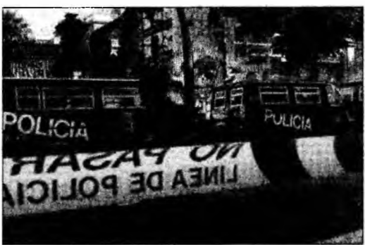
Polițist în fața Centrului cultural italian din Barcelona

București (MF) - Partidul Conservator se declară împotriva alegerilor anticipate, iar în cazul în care acestea vor avea totuși loc, va candida pe cont propriu, ministrii PC urmând să rămână în Guvern „până la capăt”.