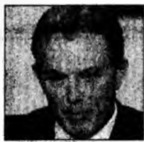
Tony Blair