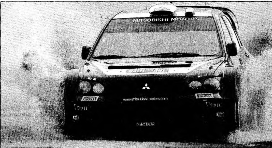
Mitsubishi a cerut reducerea numărului de etape pentru sezonul viitor.