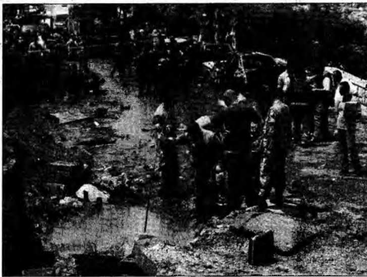
Deflagrația s-a auzit pe o rază de câțiva kilometri

Murr, ginerele președintelui Emile Lahoud, a fost transportat la spital, dar starea sa este bună.