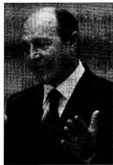
Traian Băsescu

„Sunt emoționat că există numeroase semnale de simpatie și solidaritate venite din partea simplilor cetățeni din România. În acest moment dificil, sprijinul acordat Marii Britanii și luptei împotriva terorismului are o valoare specială”, a menționat Quinton Quayle.