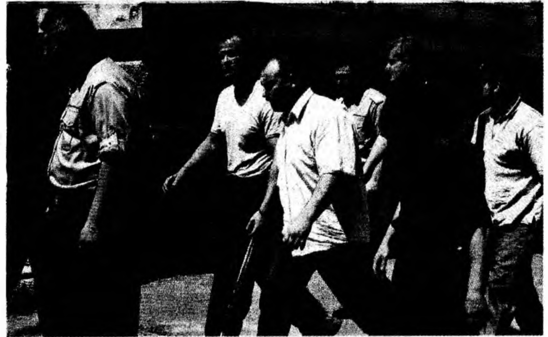
Grupul aurarilor în ziua arestării

Acum, când agricultorii se pregătesc să înceapă campania de seceriș și se află în plină perioadă de întreținere a culturilor prășitoare, prețul motorinei a ajuns la 31.000 lei litrul.