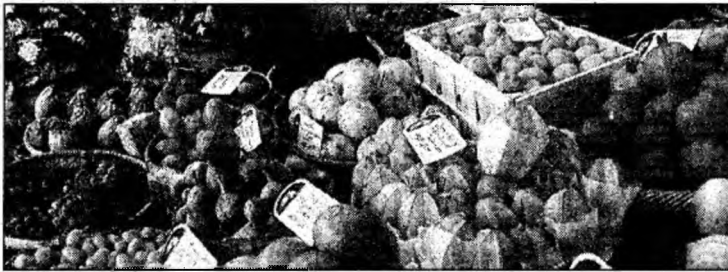
Chiar și religia contează ca factor de risc în siguranța alimentară

supravegherea și controlul pieței agroalimentare și importului, delimitarea și întărirea sistemelor de supraveghere și control intern și la frontieră, aplicarea eficientă a sistemelor de evaluare a riscului, informarea promptă și transparentă a consumatorilor și educarea și instruirea personalului.