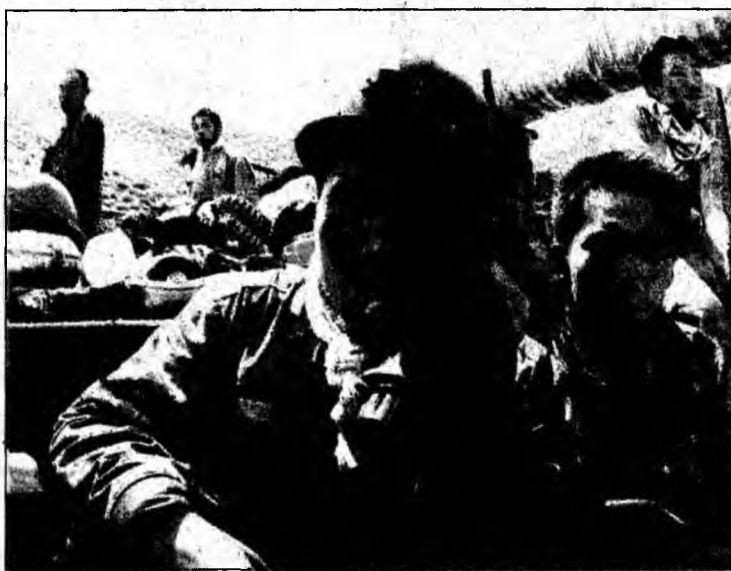
În momentul exploziei, 87 de persoane erau în mină

Luni, 40 de mineri fuseseră declarați morți, iar alți 43 erau dați dispăruți, în urma unei explozii cauzate de o acumulare de gaze într-o mină de cărbune din regiunea Xinjiang, din nord-vestul Chinei, potrivit agenției guvernamentale. Numai patru mineri au fost găsiți în viață, a informat agenția China Nouă.