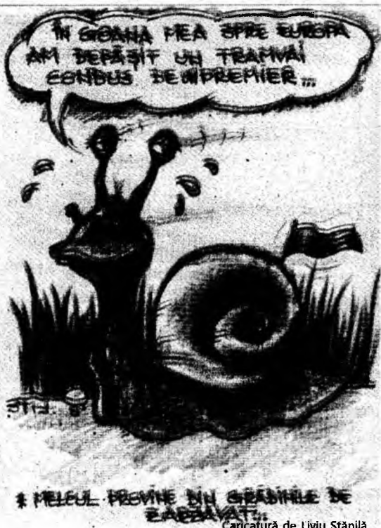
Caricatură de Liviu Stănilă

În județ D.N. 7 - GURASADA - TĂTĂRAȘTI - ZAM D.J. 687 - SÂNTUHALM - CRISTUR - HUNEDOARA În municipiul DEVA: - str. Horia - D.J. 786 - Șolmus - Călea Zarandului