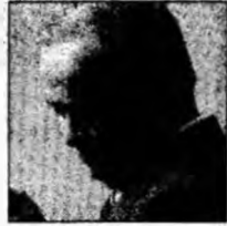
Islam Karimov

Sofia (MF) - Centriștii bulgari sunt dispuși să ofere postul de prim-ministru socialiştilor, dacă aceștia acceptă formarea unei coaliții împreună cu ei, a anunțat partidul actualului premier Simeon de Saxa Coburg-Gotha. Este pentru prima dată când MNS II, care trebuia să propună președintelui Gheorghe Părvanov un candidat pentru postul de premier, ia în considerare posibilitatea formării unui guvern condus de un socialist. PSB, formațiune care a câștigat alegerile legislative din 25 iunie, dar nu a reușit să obțină investitura unui guvern minoritar de coaliție din partea Parlamentului, a anunțat că va examina propunerea partidului de centru.