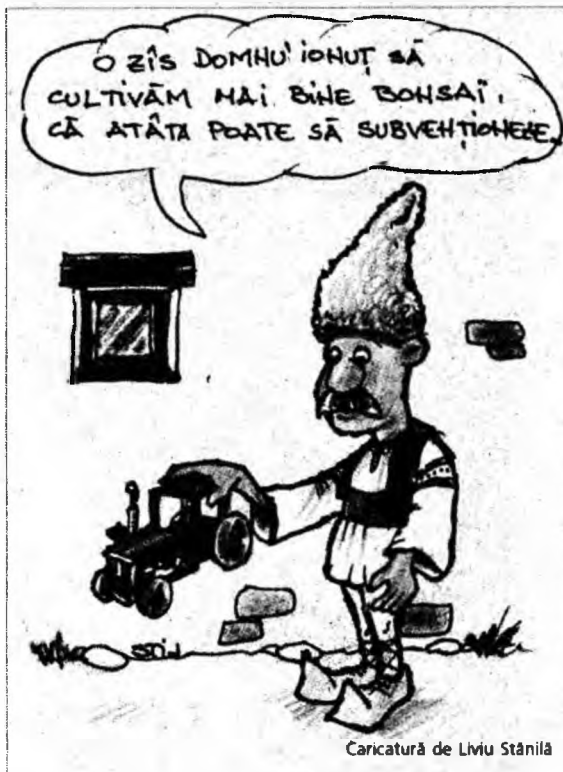
Caricatură de Liviu Stănilă

În județ D.N. 7 - GURASADA - TĂTĂRAȘTI - ZAM; D.J. 687 - SÂNTUHAİM - CRISTUR - HUNEDOARA; În municipiul DEVA: - str. Horia - D.J. 786 - Șoimuș - Calea Zărandului.