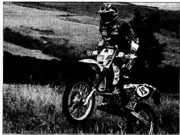
Carpat Express Rally va fi găzduit și de județul nostru

Anul acesta, Carpat Express se va desfășura în perioada 6 - 10 august și va traversa cele mai pitorești zone ale județelor Hunedoara și Alba. Lungimea lui este de