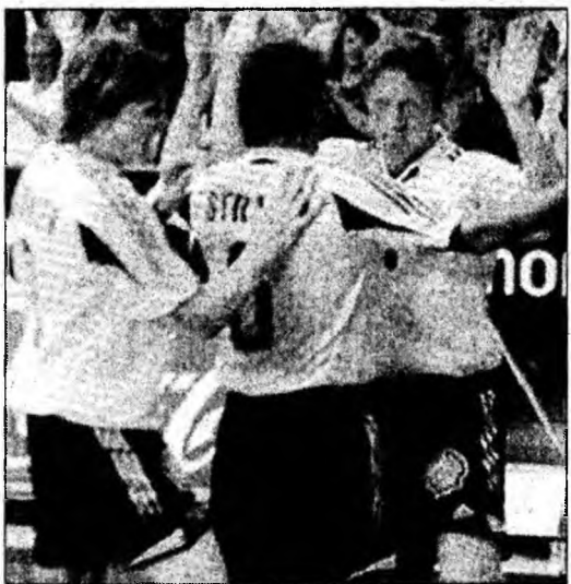
Rosenborg speră să se califice în grupe.

„Avem o șansă bună să ajungem în grupe. Steaua a fost aproape de victorie în meciul cu Dinamo”, a spus acesta, citat de cotidianul Dagbladet. Cei doi oficiali ai grupării Rosenborg vor asista și la meciul Steaua - Shelbourne, care va avea loc miercuri, la ora 20:30, în manșa secundă a turului doi preliminar al Ligii Campionilor. Mijlocașul Fredrik Winsnes a afirmat că nu cunoaște echipa Steaua, dar că formațiile din Europa de Est pot produce oricând surprize. „Oricum, românii sunt sub nivelul unor echipe precum Betis Sevilla sau Everton, cu care, din fericiție, nu am căzut”, a spus Winsnes pentru publicația Adresseavisen.