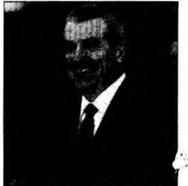
Premierul Tăriceanu

„Vor fi identificate problemele concrete cu care se confruntă aceste state și vor