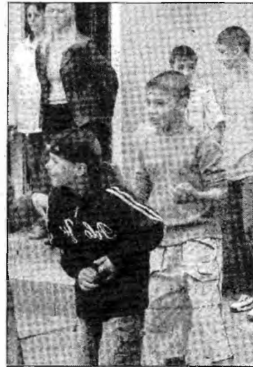
O șansă pentru copiii cu SIDA

Până acum, tot cu banii obținuți la diverse târguri, din vânzarea obiectelor confecționate de ei, au reușit să organizeze o excursie la o cabană din apropierea orașului lor, dar și atunci au avut noroc cu minierii de la Mina Lonea care au renunțat la masa lor de dinaintea intrării în schimb și le-au dat-o copiilor seropozitivi veniți în excursie.