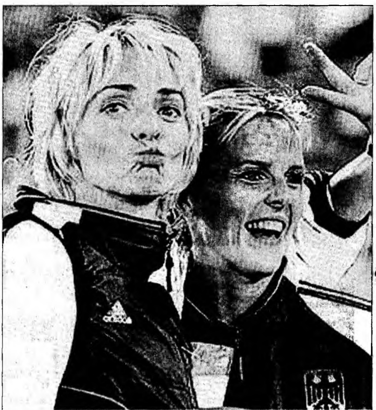
Heike Drechsler (s), o atletă cu un palmares impresionant

După Marion Jones la Mondialele din 2003 și Donovan Bailey în timpul Jocurilor Olimpice, Eurosport contează la Helsinki pe un alt invitat special, unul dintre marile staruri ale istoriei atletismului: Heike Drechsler. Ea este atleta cu cele mai impresionante succese multidisciplinare, fiind campioana la săritura în lungime, 100 m, 200 m și heptatlon. Heike Drechsler va fi ghidul telespectatorilor Eurosport pentru nouă zile de acțiune completă Live de pe stadionul olimpic din Helsinki, locul unde a obținut primul său titlu mondial în 1983. Heike va introduce fiecare sesiune, analizând probele zilei.