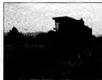
Grâul nu are preț

de aceștia oscilează între 2.500 și 3.500 de lei/kg. Iar explicația acestora cum că grâul nu ar fi panificabil nu stă în picioare. Anul trecut, prețul unui kilogram de grâu a fost de 4.500 de lei. De aceea, e de așteptat ca țăranii să-și țină pentru o perioadă grâul în hambare”, susține Emil Gavrilă.