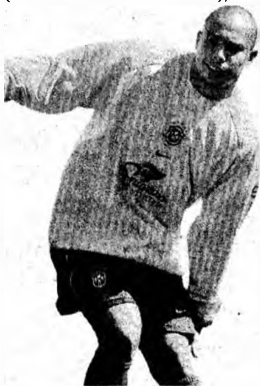
Ronaldo, în lot