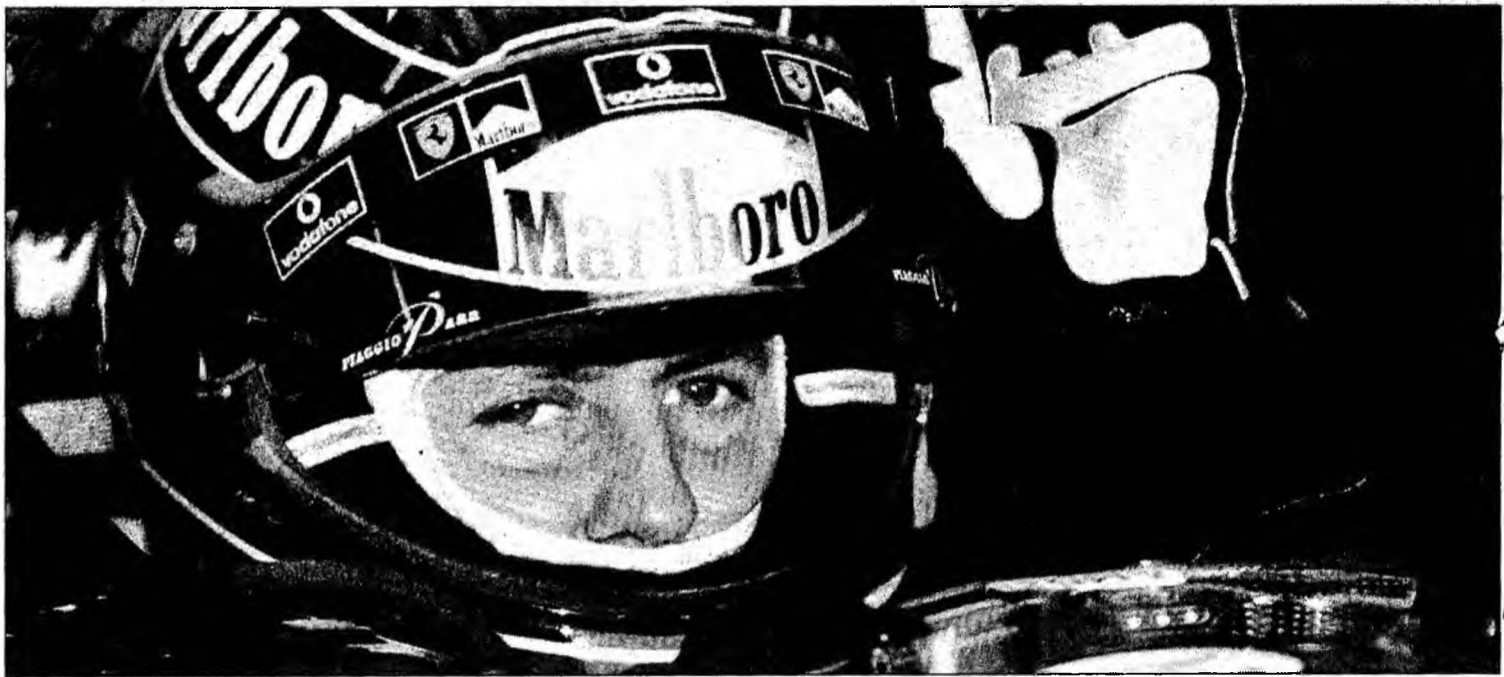
Germanul Michael Schumacher, campionul mondial en-titre