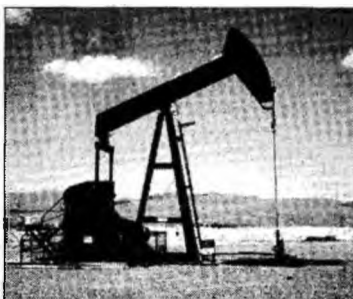
Prețul petrolului crește

Deva (C.P.) - Piața petrolului se clatină după moartea liderului Arabiei Saudite, cea mai importantă țară exportatoare de țiței din lume, și după apariția unor probleme la două dintre cele mai mari rafinării din SUA. Prețul țițeiului brut de referință pe piața americană a crescut la 61,07 de dolari pe baril. Prețul petrolului s-a apreciat cu 40% de la începutul anului, fiind în prezent cu aproximativ un dolar sub nivelul record de 62,10 dolari pe baril, înregistrat la 7 iulie, dată la care au avut loc atentatele de la Londra. Arabia Saudită, cel mai mare producător și exportator de țiței brut din lume, va menține nivelul de producție necesar pentru asigurarea stabilității pieței petroliere mondiale, a declarat un oficial saudit, tocmai pentru a calma situația. Indiferent de asigurările date de diverse autorități, piața petrolului va continua să rămână una dintre cele mai instabile. Orice eveniment internațional pare să clatine relativa stabilitate a acesteia. E de la sine înțeles însă faptul că orice majorare a prețului la țiței determină scumpiri în lanț.