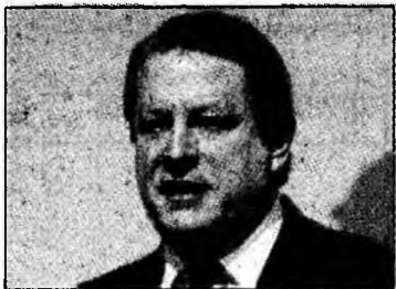
Al Gore

Al Gore, în vârstă de 57 de ani, a fost vicepreședinte în timpul celor două mandate ale lui Bill Clinton și a pierdut alegerile în favoarea lui George W. Bush, în 2001.