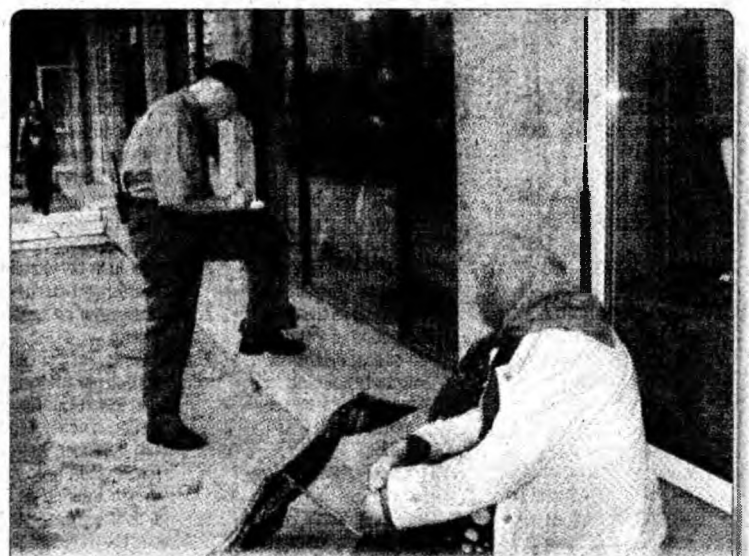
Cerșetoarea a fost amendată de polițistul comunitar conform Legii 61 și HCL 128/2002.

Salariul mediu net în județul Hunedoara se cifrează la 6.950.985 de lei, însă industria este cea mai bine plătită, cu un salariu mediu de 7.661.738 de lei.