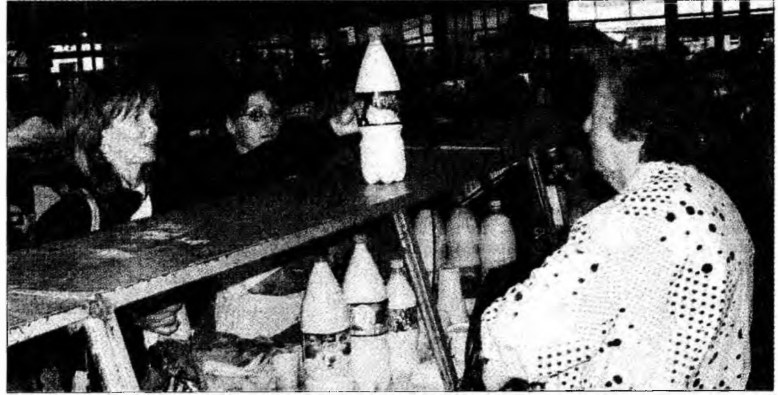
Un tip de comerț pe cale de dispariție

Deva - Cota individuală de lapte reprezintă o cantitate individuală de referință pentru livrări și/sau vânzări directe. Acțiunea pentru stabilirea cotelor individuale de lapte se va încheia anul viitor. Conform datelor Uniității de Ameliorare și Producție în Zootehnie Hunedoara, fiecare producător va completa lunar o declarație pe proprie răspundere, în care va trece cantitatea de lapte obținută lunar. Aceste date sunt centralizate și anul viitor, pe baza acestor date, producătorul va putea să-și stabilească propria cotă individuală de lapte. Începând cu anul 2006 se va interzice cumpărarea laptelui de la producătorii care nu dețin cotă individuală pentru li-