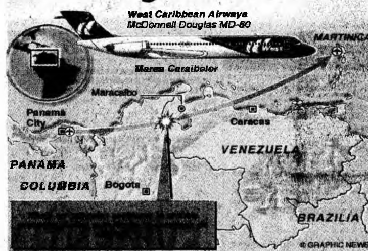
Avionul s-a prăbușit într-o zonă muntoasă

control din Caracas a pierdut legătura cu avionul în momentul în care acesta se afla în zona Marchiques, din statul Zulia. Autoritățile locale