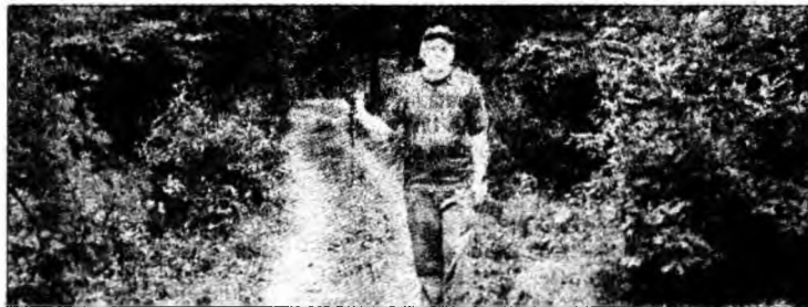
Se impune obligativitatea pazei pădurilor