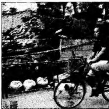
Casă prăbușită în Kazo

Un bilanț provizoriu al cutremurului indică rănirea a cel puțin 15 persoane, majoritatea suferind răni ușoare, în urma prăbușirii acoperișului unui gimnaziu la Sendai. Autoritățile japoneze au suspendat și alerta de tsunami declanșată după seism.