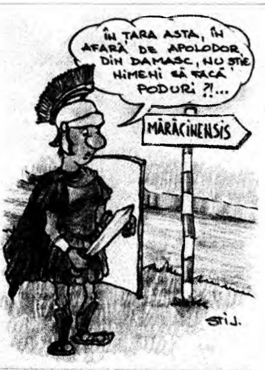
Caricatură de Liviu Stănilă

În Deva aparatele radar vor fi amplasate pe B-dul 22 decembrie - Calea Zaranidului - Zona Sântuhalm