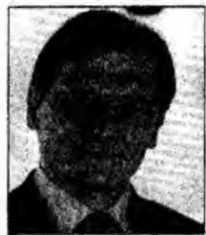
Wolfgang Schuessel