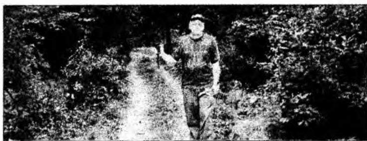
Se impune obligativitatea pazei pădurilor