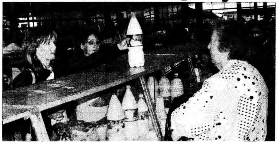
Un tip de comerț pe cale de dispariție

Deva - Cota individuală de lapte reprezintă o cantitate individuală de referință pentru livrări și/sau vânzări directe. Acțiunea pentru stabilirea cotelor individuale de lapte se va încheia anul viitor. Conform datelor Unității de Ameliorare și Producție în Zootehnie Hunedoara, fiecare producător va completa lunar o declarație pe proprie răspundere, în care va trece cantitatea de lapte obținută lunar. Aceste date sunt centralizate și anul viitor, pe baza acestor date, producătorul va putea să-și stabilească propria cotă individuală de lapte. Începând cu anul 2006 se va interzice cumpărarea laptelui de la producătorii care nu dețin cotă individuală pentru li-