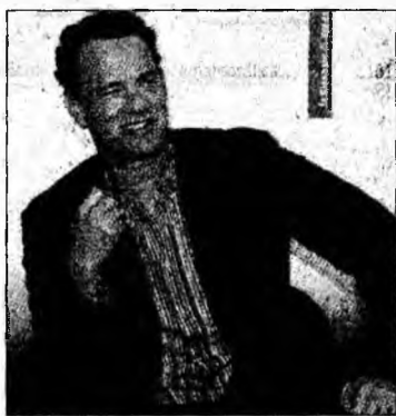
Tom Hanks