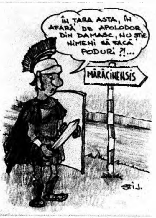
Caricatură de Liviu Stănilă

În Deva aparatele radar vor fi amplasate pe B-dul 22 decembrie - Calea Zarandului - Zona Sântuhalm