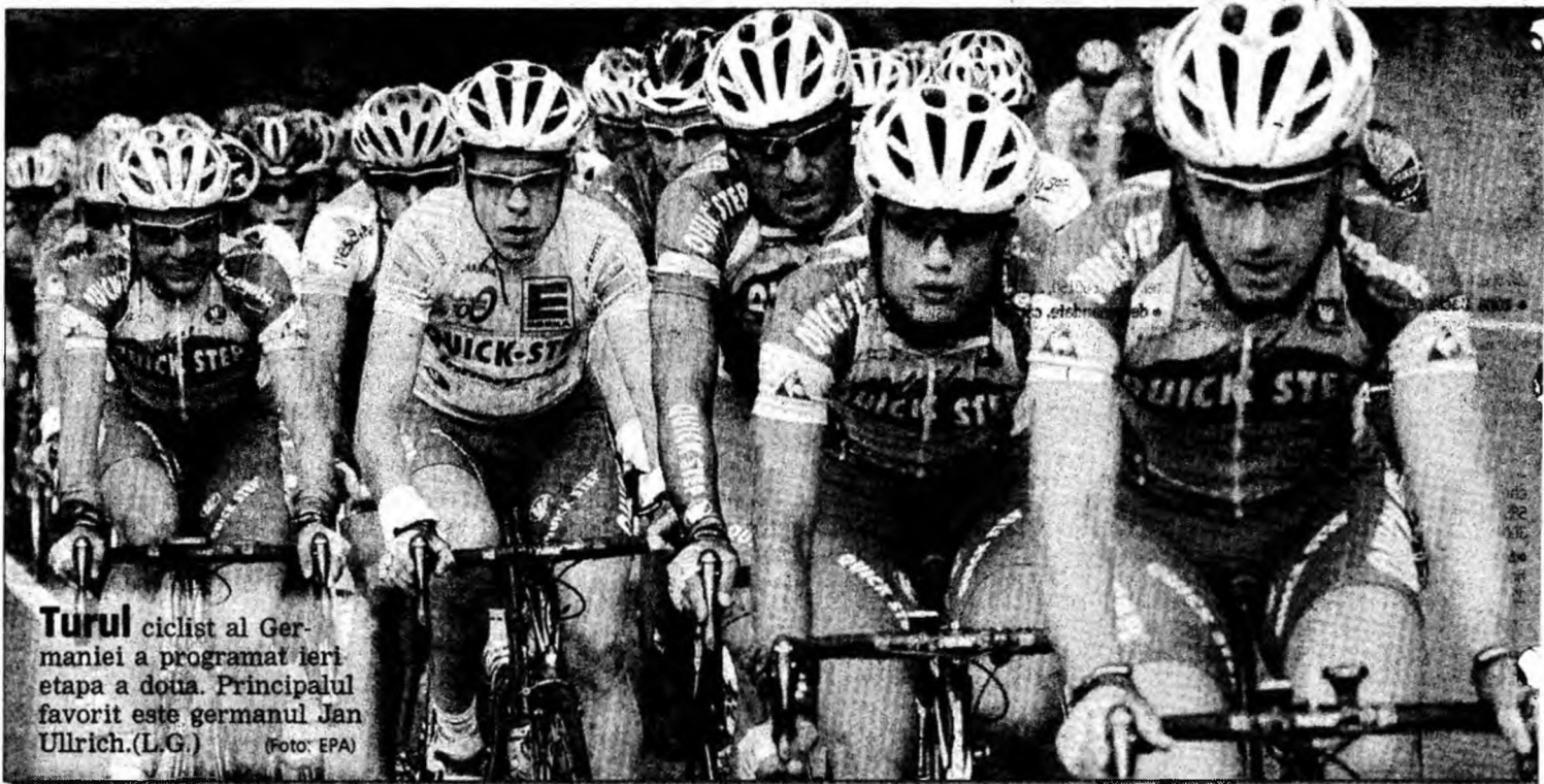
Turul ciclist al Germaniei a programat ieri etapa a doua. Principalul favorit este germanul Jan Ullrich.(L.G.)