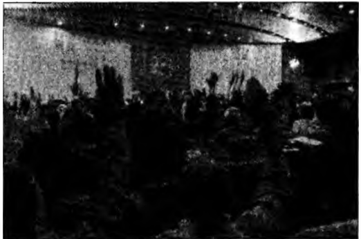
Modificarea Constituției provizorii în vederea prelungirii termenului-limită a fost aprobată

Cu puțin timp înaintea sesiunii, care a început cu mai puțin de o oră înainte de expirarea termenului inițial, ambasadorul Statelor Unite în Irak, Zalmay Khalilzad, prezent în Parlament, a declarat că proiectul de Constituție nu este definitiv.