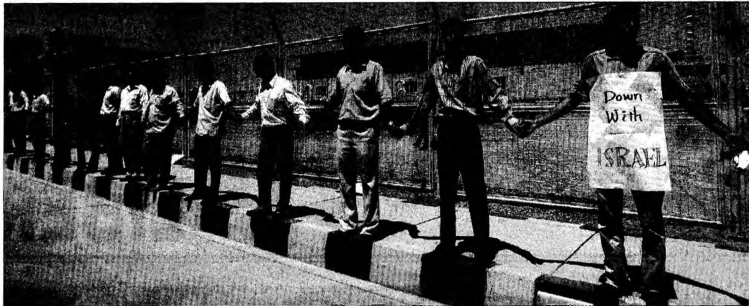
Manifestanții, majoritatea studenți Islamiști, au scandat în fața uzinei de la Isfahan „Moarte Americii, moarte Israelului”