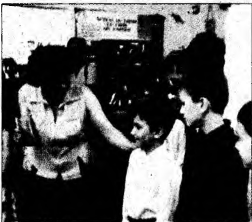
În vacanța de vară copiii descoperă lectura

Deva (S.B.) - Biblioteca Județeană „Ovid Densusianu” din Deva a pregătit micilor cititori, pentru perioada vacanței de vară, o serie de activități dedicate copiilor. Pe toată perioada vacanței, la Filiala Nr. 3, de la Școala Generală Nr. 6 din Deva, sunt organizate audiții de basme, sub genericul „Povești de aur - Din basmele românilor”. Ieri, la Filiala Bibliotecii Județene din Ville Noi - Deva, s-a derulat un concurs de poezie. Copiii prezenți s-au întrecut în a recita din opera poetului Vasile Alecsandri. Astăzi, 17 august, copii care îndrăgesc acest gen literar vor participa la vernisarea unei expoziții de carte tematică și la audiția unei casete dedicate împlinirii a 80 de ani de la moartea scriitorului Ioan Slavici.