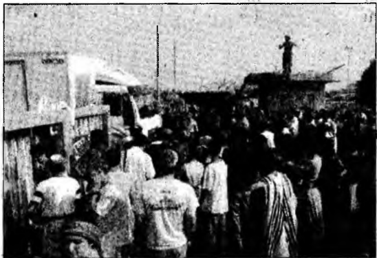
Protestatari evrei la intrarea în Neve Dekalim

Țările europene s-au raliat punctului de vedere american, amenințând că vor sesiza Consiliul de Securitate al ONU în cazul în care Teheranul nu va renunța la reconversia uraniului, iar președintele SUA, George W. Bush, nu a exclus posibilitatea de recurgere la forță.