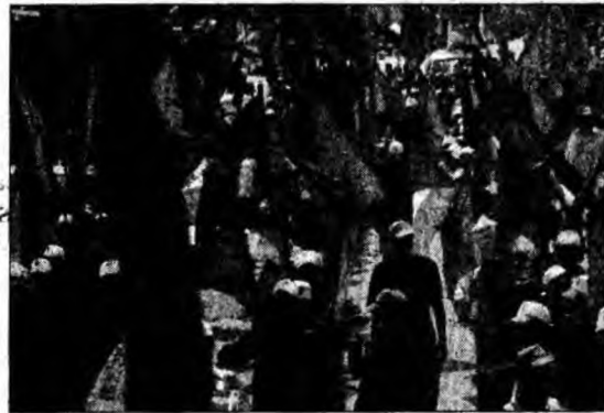
Palestineni sărbătorind retragerea