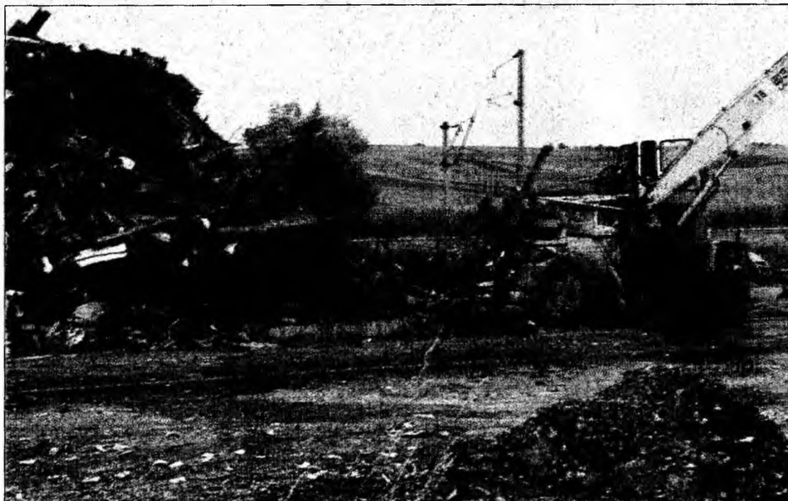
Fierul vechi - atracție pentru hoși și evazionști

Pentru acestea nu a întocmit adeverințe de primire și plată, iar vânzarea a fost făcută cu o factură fiscală. Bărbatul este cercetat pentru comiterea infracțiunii de evaziune fiscală și urmează să se stabilească valoarea fondului