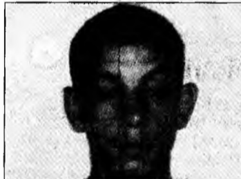
Cei doi infractori au fost prinși