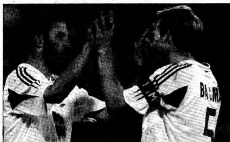
Norvegienii cred într-o victorie cu Steaua.