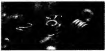
Bijuterii trace

Sofia (MF) - Arheologii bulgari au descoperit noi bijuterii din aur trace, vechi de aproximativ patru mii de ani. Aceasta este a doua descoperire arheologică majoră făcută în Bulgaria în ultimele săptămâni. În iulie, arheologii au descoperit mormântul unui presupus rege trac, plin cu bijuterii și obiecte de ornament, în apropierea orașului Zlatinitza, din sud-est.