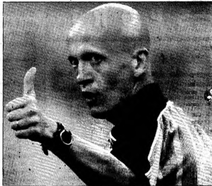
Arbitrul cel mai bine cotate în lume:

conflict de interese în faptul că arbitru este sponsorizat de aceeași societate care susține și gruparea AC Milan. Deși în acest an a ajuns la vârsta limită pentru retragerea arbitrilor italieni, Federația Italiană de Fotbal i-a permis lui Pierluigi Collina să mai arbitreze încă un sezon competițional, ținând cont de reputația sa excelentă și de faptul că a câștigat de șase ori titlul de cel mai bun arbitru din lume. El va putea astfel să arbitreze meciuri din campionatul Italiei și din Liga Campionilor până la data de 30 iunie 2006, dar nu și partide din cadrul Campionatului Mondial din 2006, care se va desfășura în Germania.