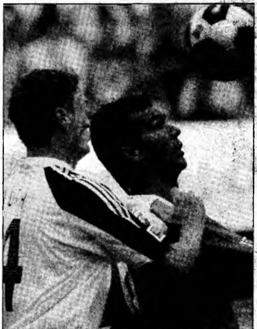
Jared Borgetti (d), cu 36 de goluri.

Mexico City (MF) - Atacantul Jared Borgetti a devenit cel mai bun marcator din istoria echipei naționale de fotbal a Mexicului, cu 36 de goluri, după ce a înscris unul dintre cele două goluri din partida cu naționala statului Costa Rica, scor 2 - 0, din preliminariile Campionatului Mondial 2006, zona CONCACAF. Datorită acestui gol, atacantul Jared Borgetti, care a împlinit, duminică, 32 de ani, și care evoluează la Bolton, i-a depășit pe jucătorii Carlos Hermosillo și Luis Hernandez, ambii cu câte 35 de goluri marcate.