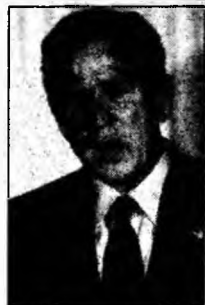
George W. Bush

Washington (MF) - SUA au respins, joi, propunerea președintelui rus, Vladimir Putin, privind stabilirea unui calendar de retragere a forțelor străine din Irak. „Cred că președintele american George W. Bush a exprimat foarte clar punctul nostru de vedere privind asistența acordată Irakului în materie de securitate. Atunci când Irakul va dispune de capacitățile necesare pentru a-și asigura apărarea, ne vom retrage”, a declarat purtătorul de cuvânt al Departamentului de Stat american, Sean McCormack. Președintele rus a propus elaborarea unui calendar pentru retragerea în etape a trupelor străine din Irak. „Mulți irakieni le consideră forțe de ocupație și aceasta este o realitate de care trebuie ținut cont”, a spus Putin, în cursul unei întrevederi avute cu regele Abdallah al II-lea al Iordaniei.