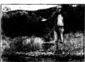
2000 de ani de ruine