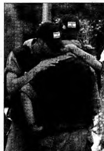
Soldați israelieni, în timpul evacuării forțate

În Cisjordania - unde planul israelian de evacuare prevede desființarea a patru colonii izolate din nordul teritoriului - au fost evacuate încă de luni implantările Ganim și Kadim. Au mai rămas două colonii.