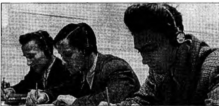
Tinerii de elită studiază gratuit

vor avea ca dată limită 1 octombrie, data poștei. Rezultatele vor fi anunțate în luna noiembrie 2005. Câștigătorii ediției 2004 urmează să plece în această toamnă la studii în universități prestigioase din Marea Britanie, Germania, Olanda, Franța, Suedia, Elveția, Italia, Canada, SUA.