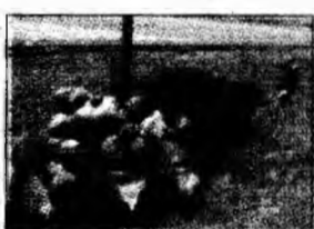
Microcipul lui Necuratu'