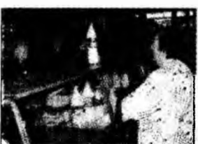
Adio lapte în PET de Cola