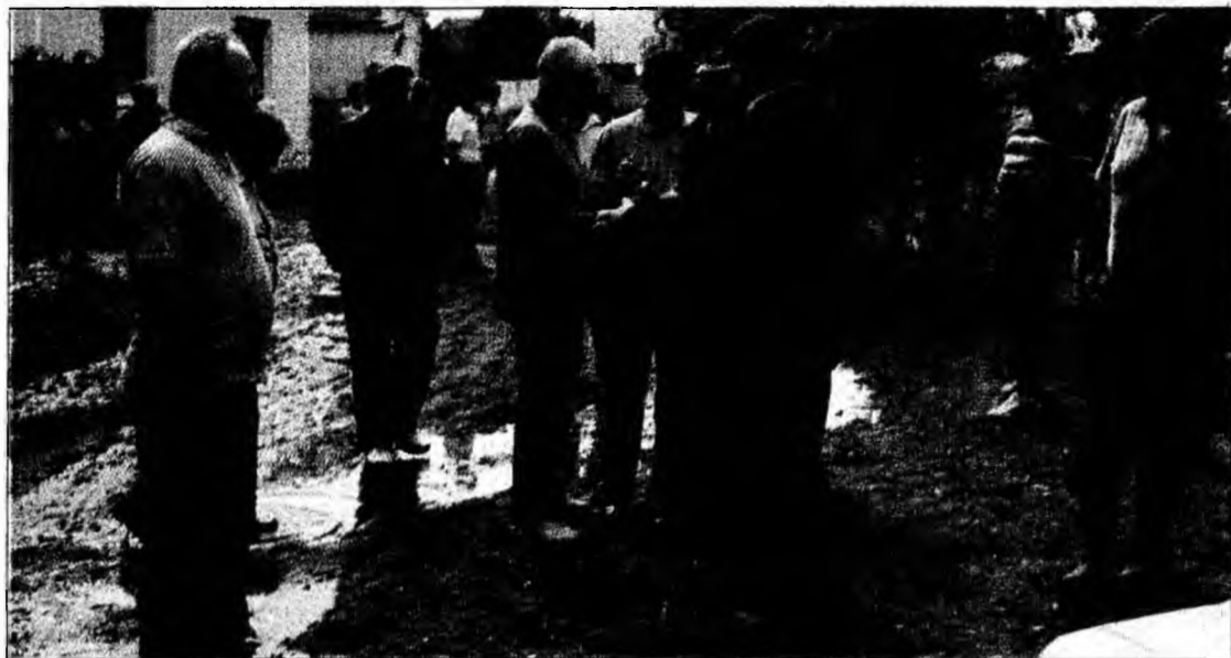
Apa scoate oamenii pe uliță

Pagubele cele mai însemnate sunt în comuna Totești, cu 21 gospodării în care apa a făcut prăpăd și a distrus 190 hectare teren cultivat. 102 ha de culturi agricole de aici au fost distruse în proporție de 100%. Pârăul Peștenița din