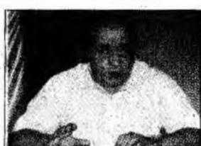
Polițiștii dansau cu lupii