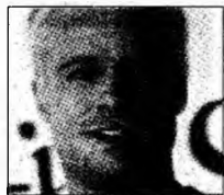
Brad Pitt

Atlantis va fi folosită pentru o viitoare misiune de aprovizionare a Stației Spațiale Internaționale, echipamentele ce trebuie transportate fiind prea grele pentru Discovery. Responsabilii agenției spațiale au optat pentru prudență atunci când au fixat data lansării următoarei nave.