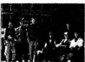
Șomaj, revin la tine!