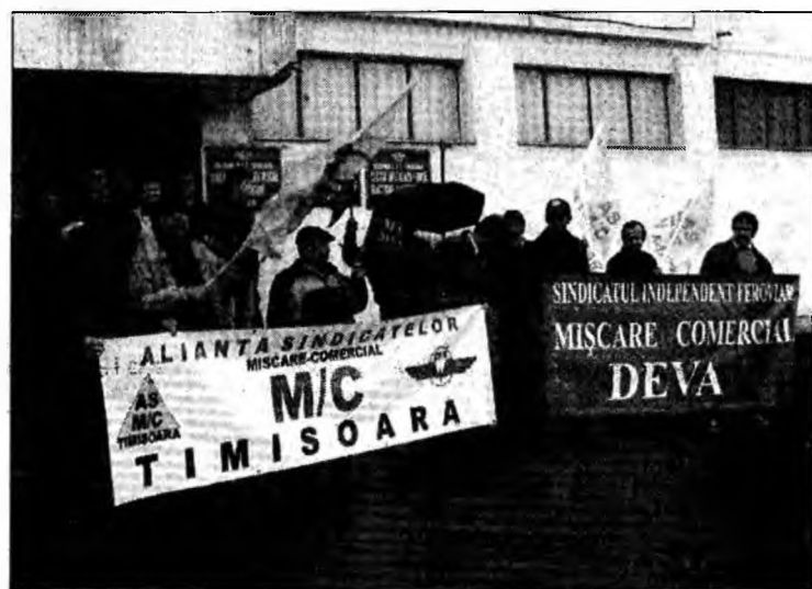
Aspect din timpul grevei ceferiștilor deveni

tică și arată dorința lor de a se lăsa deoparte disputele politice în favoarea oamenilor.