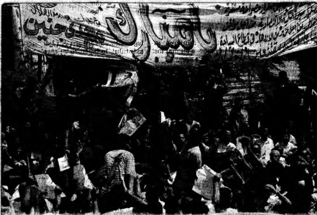
Susținere Suporterii actualului președinte egiptean Hosni Mubarak își manifestă susținerea în piața centrală din Cairo, cu ocazia primului scrutin prezidențial în care candidează reprezentanții mai multor partide.

El consideră că „România ar putea fi luată în seamă mai ales după ce ar veni cu un proiect propriu” de rezolvare a crizei transnistrene.