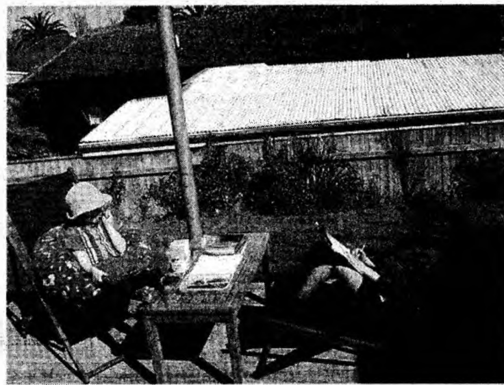
Familii cu copii minori beneficiază de prețuri promoționale

„Este deja extrasezon și acest lucru nu a fost strălucit din punctul de vedere al