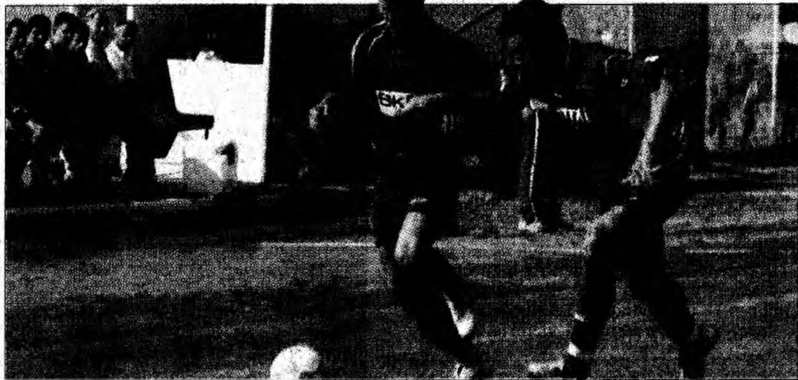
Hunedoreni au fost depășiți la majoritatea duelurilor directe pentru minge