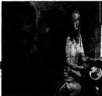
Portretul 3D

dat să mă văd prezentată astfel și să îmi dau seama că eu sunt cea din tablou. Dar opera dezvăluie mai mult despre mine decât a arătat vreodată vreo fotografie”, a declarat Rowling.