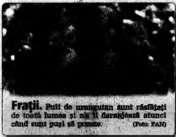
Frații. Puii de urangutan sunt răsfățați de toată lumea și nu îi deranjează atunci când sunt puși să pozeze.

Acest corp de elită va avea drept obiective și lupta împotriva altor calamități naturale, precum inundațiile și cutremurele.