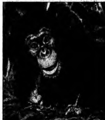
Surâd atunci când le zâmbim

Cimpanzeii care au fost ținuti într-un mediu în care îngrijitorii le-au răspuns la nevoile emoționale sunt mai comunicativi. Aceștia devin însă furioși atunci când ajutorul pe care îl așteptau nu venea destul de prompt.