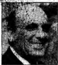
Shaul Mofaz