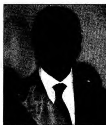
Kofi Annan

Conținutul raportului este destul de stânjenitor pentru