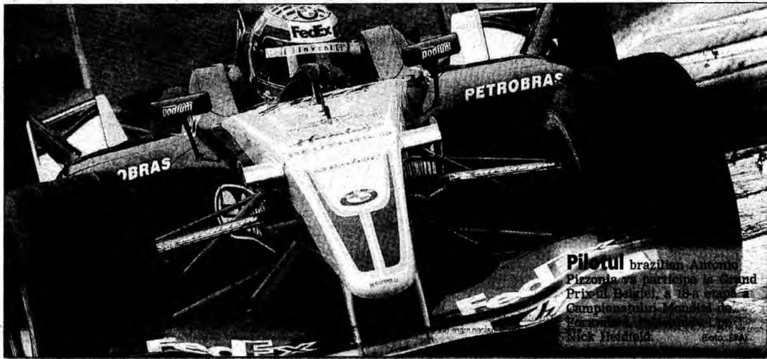
Pilotul brazilian Antonio Pizzonia va participa la Grand Prix-ul Italiei, a doua etapă a Campionatului Mondial de Formula 1.

cest meci selecția la echipa arbitrilor s-a făcut „pe pile”, Crăciunescu a replicat: „Dacă a făcut și el parte din echipă, înseamnă că n-a fost așa”.