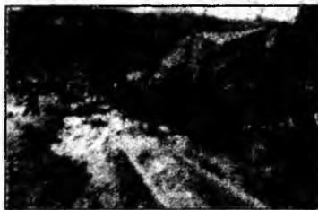
Provincia Kagoshima

Tokyo / Beijing (MF) - Taifunul Nabi, care a ajuns marți pe insula Kyushu din sudul Japoniei, a provocat, începând de duminică, moartea a cel puțin zece persoane, dispariția altor 11 și rănierea a 91 de locuitori, potrivit unor bilanțuri anunțate ieri de autorități. Bilanțul riscă să se agraveze, deoarece operațiunile de căutare se află în curs de desfășurare.