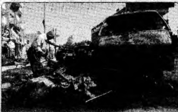
Explozie Rămășițele unei mașini afectate de o explozie ce a avut loc ieri la Bagdad și care s-a soldat cu cel puțin șase răniți.

Moussa Arafat, care avea numeroși inamici, supraviețuise unei tentative de asasinat în iulie 2003, când persoane necunoscute au lansat o grenadă asupra mașinii sale.