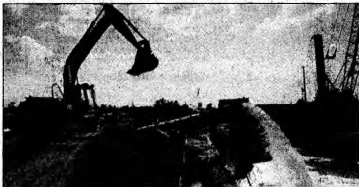
Doar trei din cele 148 de pompe funcționau marți

Ray Nagin a declarat că toți locuitorii, cu excepția celor implicați în operațiunile de salvare, trebuie să părăsească imediat zona. „Sunt toxine în apă, se înregistrează scurgeri de gaze, ne luptăm cu cel puțin patru incendii. Orașul nu este sigur”, a spus el. Apa ar putea fi contami-