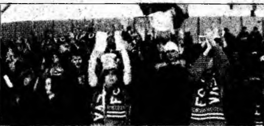
Galeria echipei FC CIP

Deva (C.M.) - Grupul de inițiativă al suporterilor vicecampionului național la fotbal, FC CIP Deva, îi invită pe toți cei care doresc să devină membri ai galeriei să se prezinte duminică, la ora 17.00, la Sala Sporturilor din Deva. Noua galerie a echipei deviene își va susține pentru prima dată în mod organizat favoriții cu ocazia partidei cu United Galați, care se va desfășura duminică, de la ora 18.00, în cadrul etapei a IV-a. Fie ca suporterii să reușesc să fie alături de echipă nu doar când echipa merge bine, ci și în momentele grele și să constituie cu adevărat omul în plus al FC CIP la partidele de pe teren propriu.