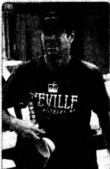
Ajutoare Actorul Dennis Quaid a fost marți în New Orleans ca reprezentant al International Hospital for Children pentru a distribui provizii.