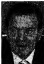
Gerhard Schroder

Consultările preliminare, apoi negocierile dintre partide pot dura săptămâni sau chiar luni, Constituția germană neprevăzând termene-limită în cadrul acestui proces.