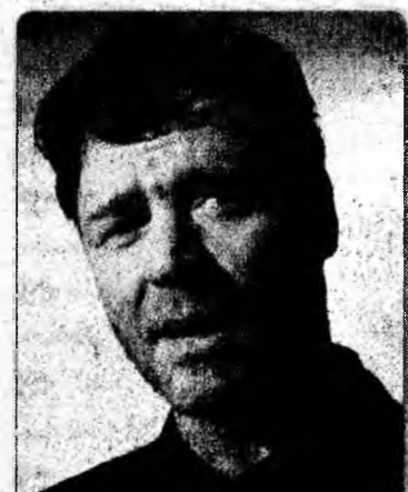
Premieră Russel Crowe a fost prezent ieri, în Sydney, la premiera celui mai nou film al său, „Cinderella Man”.