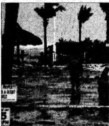
Florida, după Rita.

Companiile petroliere BP și Royal Dutch Shell au început să-și evacueze platformele petroliere din Golful Mexic.