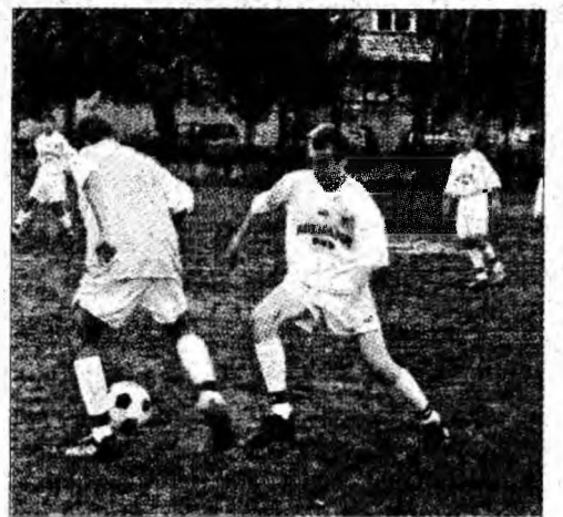
Start în Campionatul de Juniori C

Corvinul 2005 - CS Uricani CS Vulcan - Jiul Petroșani CS Lupeni - Aurul Brad CS Deva - Victoria Călan Inter Petrila - CFR Marmosim