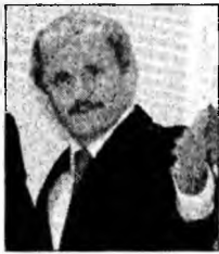
Mikulas Dzurinda

Tokyo (MF) - Premierul japonez, Junichiro Koizumi, a fost reconfirmat, ieri, în funcție de către Parlament, la zece zile după alegerile legislative care au conferit o majoritate absolută Partidului Liberal-Democrat. El a fost reconfirmat cu 340 de voturi pentru și 114 împotriva de către Camera Reprezentanților. Conform procedurii, Guvernul nipon și-a prezentat demisia colectivă înainte de începerea noii sesiuni parlamentare. Proiectul de privatizare a poștei, transformat de Junichiro Koizumi în principalul subiect al campaniei sale electorale, va fi din nou supus atenției deputaților în timpul acestei sesiuni de 42 de zile, care începe încheierea la 1 noiembrie.