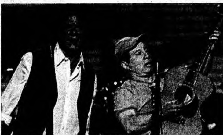
Art Garfunkel și Paul Simon la Madison Square Garden

Denumit „From the Big Apple to Big Easy” (supranumele celor două orașe, New York și New Orleans - n.r.), evenimentul a fost organizat simultan în două săli celebre,