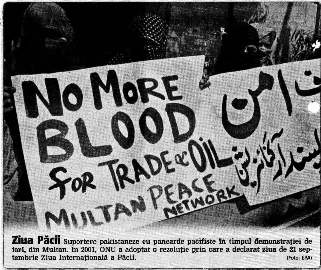
Ziua Păcii Suportere pakistaneze cu pancarde pacifiste în timpul demonstrației de ieri, din Multan. În 2001, ONU a adoptat o rezoluție prin care a declarat ziua de 21 septembrie Ziua Internațională a Păcii.