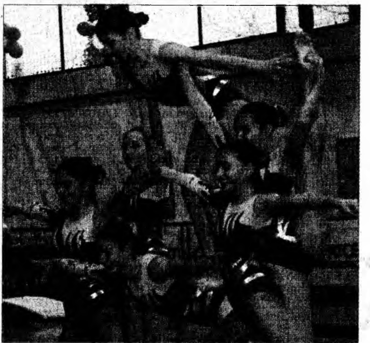
Exercițiu spectaculos oferit de gimnastele de la CSS Cetate Deva