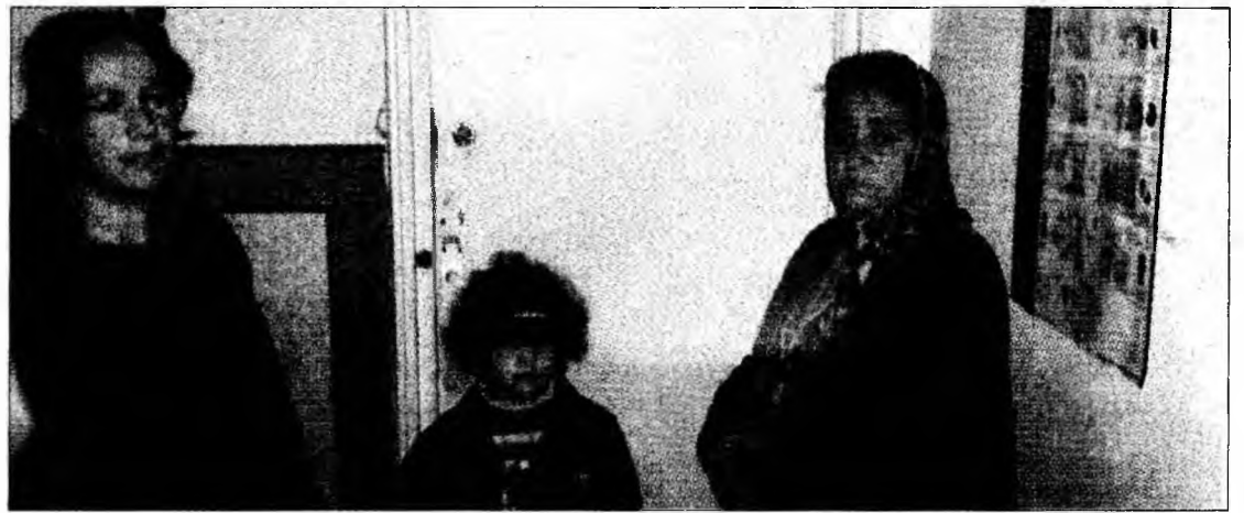
Cele două femei de etnie rromă au furat bunuri din trei locuințe ale căror uși erau deschise

Femeile operau de obicei în apartamentele ale căror uși