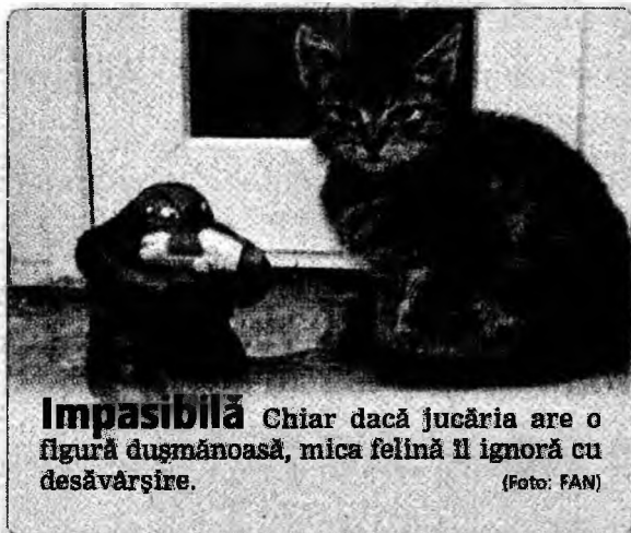
Impasibilă Chiar dacă jucăria are o figură dușmănoasă, mica felină îl ignoră cu desăvârșire.

Trupa Queen cântă și acum, cu un nou solist, Paul Rodgers. Brian May a subliniat: „Am spus mereu că dacă găsim pe cineva, atunci totul se va face natural și organizat și exact asta s-a întâmplat”.