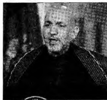
Președintele afgan, Hamid Karzai

La două zile după alegerile parlamentare la care au participat aproape șase milioane de afgani, președintele a apreciat că „natura războiului împotriva terorismului” s-a schimbat și a precizat că Guvernul său ar putea partici-