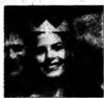
Cu părinții

Londra (MF) - Cărțile Harry Potter promovează, prin școala Hogwarts, un model de școală în Marea Britanie, în care disciplina este cuvântul cheie, relatează BBC News Online, citând un oficial din Ministerul britanic al educației. Un sistem de „școli în școli” ar promova un simț al apartenenței și ar da elevilor senzația de comunitate.