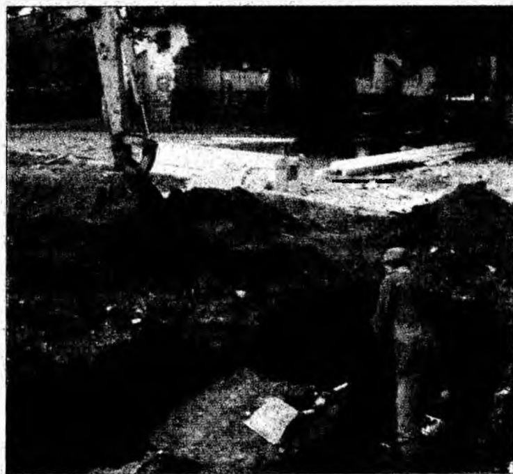
Șantierul arheologic din Geoagiu

Pe lângă monezi echipa de arheologi a mai scos la lumină șase schelete umane, provenite din două metropole, una de secol XII și cealaltă de secol XV.