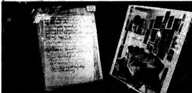
Ciorna melodiei „I'm only Sleeping”

Ciorna melodiei „I'm only Sleeping”, cântec scris de John Lennon în 1966 și inclus pe albumul „Revolver”, este unul dintre cele mai valoroase obiecte oferite la licitație, valoarea sa de vânzare