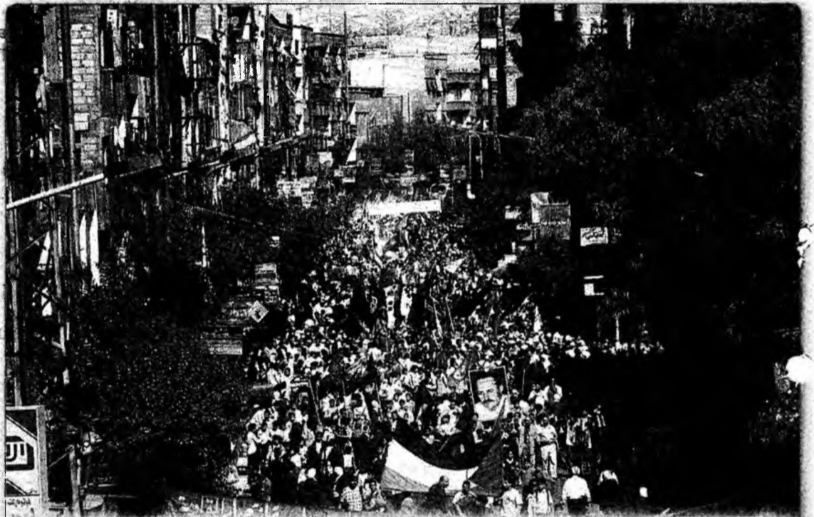
Marș aniversar Peste 5000 de palestinieni au mărșăluit ieri pe străzile unei tabere de refugiați de lângă capitala Siriei, Damasc, pentru a marca a cincea aniversare de la începutul revoltei palestiniene.

Membrii UE nu au reușit încă să ajungă la un acord privind documentul care stabilește principiile de bază ale negocierilor, care ar trebui să înceapă luni la Luxemburg. Ambasadorii țărilor UE urmează să întâlnească din nou, azi, la Bruxelles, într-o nouă încercare de a ajunge la un acord, strict necesar înaintea începerii negocierilor.