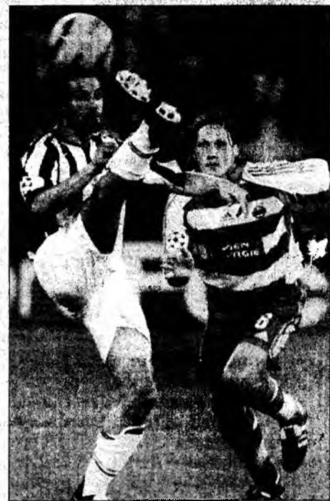
Deși nu a marcat, Del Piero a jucat bine.