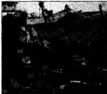
Vaporaș distrus

(MF) - Cel puțin 16 persoane au murit după trecerea taifunului Damrey, luni, prin insula Hainan (sudul Chinei). Taifunul a provocat inundații și întreruperea alimentării cu energie electrică. Autoritățile