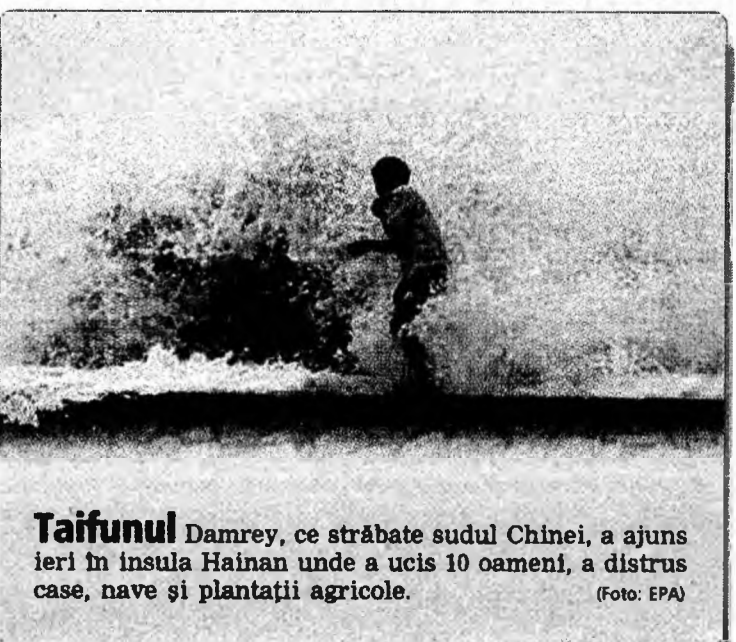
Taifunul Damrey, ce străbate sudul Chinei, a ajuns ieri în insula Hainan unde a ucis 10 oameni, a distrus case, nave și plantații agricole.

Tot prin programul SEI (Sistem Educațional Informatizat), ce este dedicat susținerii procesului de predare-învățare în învățământul universitar cu soluții informatice moderne, școlile hunedorene vor primi calculatoare. În acest an școlar vor fi instalate în școlile din județ 86 de rețele de calculatoare