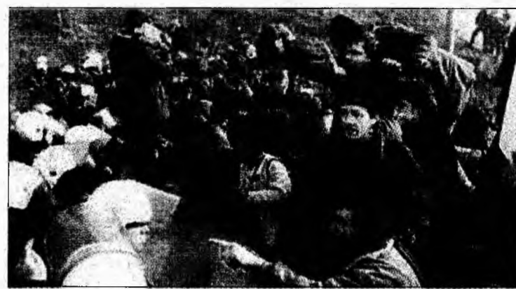
Mineriada de la Costești