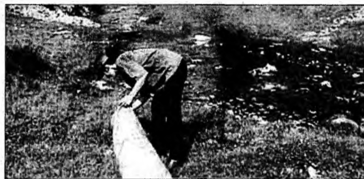
Acțiunile de ecologizare îndepărtează parțial dezastrul