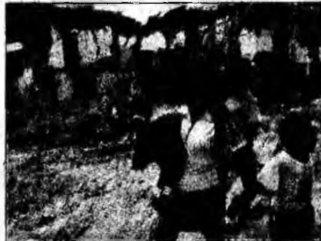
Casă distrusă din Lamas