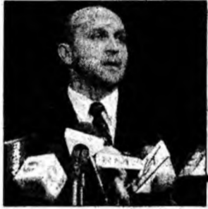
Kazimierz Marcinkiewicz

Fort Hood (MF) - Lynndie England, membră a armatei americane implicată în scandalul abuzurilor din închisoarea Abu Ghraib, a fost condamnată la trei ani de închisoare pentru rele tratamente aplicate deținuților irakieni și a fost exclusă din armată. Tânăra (22 ani) a izbucnit în plâns în momentul în care s-a anunțat sentința. Fotografia fetei, zâmbind în fața unui deținut irakian dezbrăcat și ținut în lesă, a făcut înconjurul lumii.