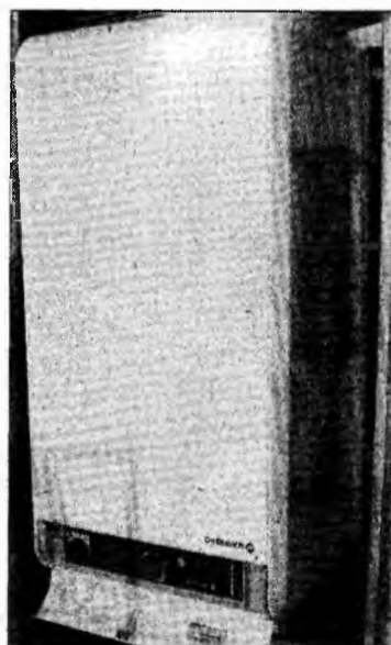
Montarea unei centrale costă

da 2005-2008. În acest an se estimează că vor fi cheltuite la nivel național 39 de milioane de lei.