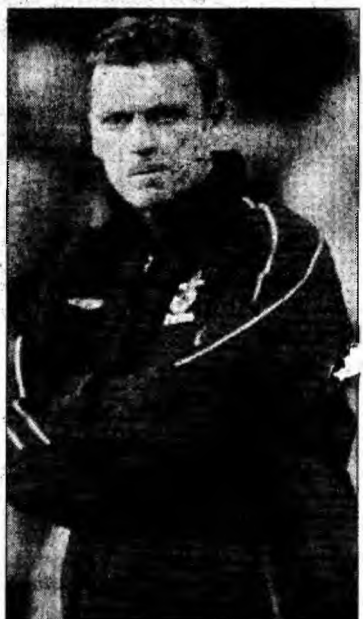
Moyes crede în Mos Crăciun

Partida Everton - Dinamo București, din manșa secundă a turului întâi al Cupei UEFA, va avea loc joi, de la ora 22, pe stadionul Goodison Park din Liverpool.