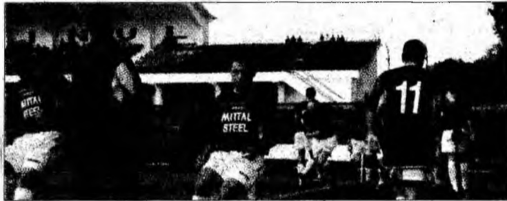
Jucătorii Corvinului în timpul unui antrenament

Geoagiu - Profitând de faptul că nu va juca în etapa de sâmbătă, din cauza retragerii echipei Armătura Zalău, FC Corvinul 2005 a plecat, marți, la Geoagiu-Băi, pentru un stagiu de pregătire. Pe lângă antrenamentele axate pe pregătirea fizică, hunedoreni vor susține, azi, de la ora 17.00, un meci amical cu divizionara D, Gloria Geoagiu. „Scopul acestui cantona-