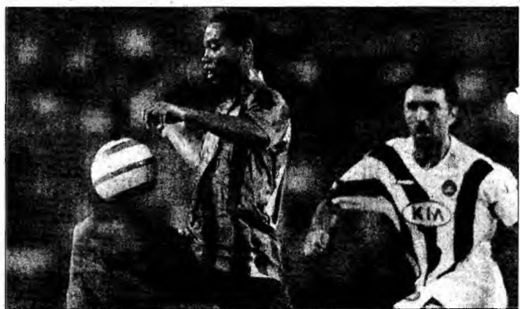
Brazilienii domină topul străinilor din Europa.

Cei mai mulți fotbaliști care au jucat în meciurile din primul tur al Ligii Campionilor sunt brazilieni (51), urmați, în această ierarhie, de spanioli (38), francezi (33), olandezi (27), italieni (25), belgieni și portughezi (câte 19), englezi (17), nemți și slovaci (câte 16), norvegieni, greci și argentinieni (câte 14). Publicația germană apreciază această statistică drept „înfricoșătoare”, cu atât mai mult cu cât în grupele Ligii Campionilor evoluează trei