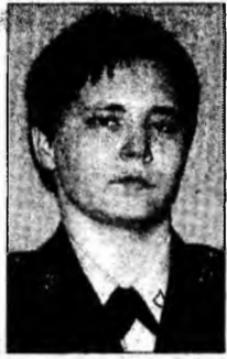
Lynndie England

Varșovia (MF) - Kazimierz Marcinkiewicz, un economist în vârstă de 46 de ani, a fost propus pentru funcția de prim-ministru al Poloniei, de partidul conservator Lege și Justiție (PiS), care a câștigat alegerile parlamentare de duminică, a anunțat liderul acestei formațiuni, Jaroslaw Kaczynski. Jaroslaw Kaczynski, cel care ar fi candidat în mod normal din partea PiS la funcția de premier, a hotărât să se retragă din această cursă pentru a nu sta în calea fratelui său, candidat la alegerile prezidențiale de la 9 octombrie.