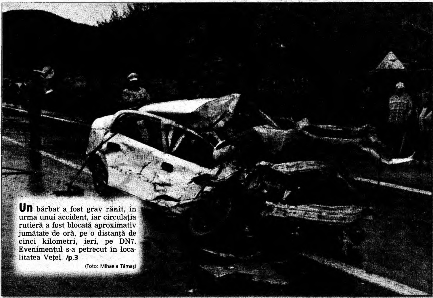
Un bărbat a fost grav rănit, în urma unui accident, iar circulația rutieră a fost blocată aproximativ jumătate de oră, pe o distanță de cinci kilometri, ieri, pe DN7. Evenimentul s-a petrecut în localitatea Veșel. /p.3

tre ele, și mi se pare exagerat să luăm la grămadă un împrumut de 600 de miliarde de lei și apoi să ne jucăm cum vrem cu acești bani. Cel mai bine e să facem împrumuturi pentru fiecare investiție în parte”, a mai declarat Păran. Replica președintelui CJ, Mircea Moloș, nu s-a lăsat așteptată. /p.3