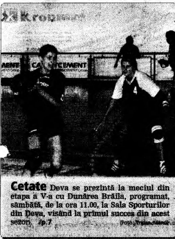
Cetate Deva se prezintă la meciul din etapa a V-a cu Dunărea Brăila, programat, sâmbătă, de la ora 11.00, la Sala Sporturilor din Deva, visând la primul succes din acest sezon. /p.7

Vremea va fi în general răcoroasă, se vor semnala ploii pe arii extinse. dimineața la pranz seara