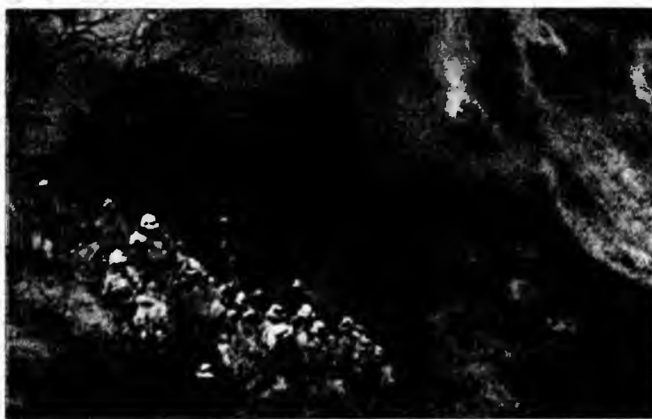
Flăcările au cuprins San Fernando Valley

Autoritățile au emis ordine de evacuare și au deplasat circa 1.500 de persoane din zonele afectate de incendiu în adăposturi special amenajate. Vineri, școlile