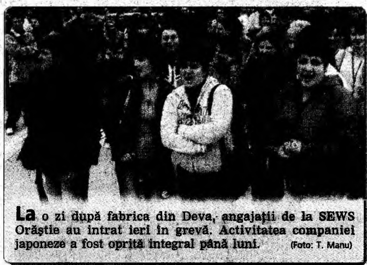
La o zi după fabrica din Deva, angajații de la SEWS Orăștie au intrat ieri în grevă. Activitatea companiei japoneze a fost oprită integral până luni.

dorește constituirea unui cadru comun pentru crearea unei zone de oportunitate economică și socială, cu o amenajare policentrică a teritoriului. „La alegerile din 2008, sper să fie ales un singur primar pentru această conurbare. Nu știm cum se va numi, dar așteptăm sugestii și din partea cetățenilor. UE nu discută, atunci când e vorba de investiții importante, decât cu mari aglomerări urbane”, a spus președintele CJ, Mircea Moloș.