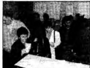
Șomerii, sursă de venit