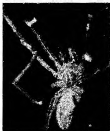
Păianjenul-fosilă