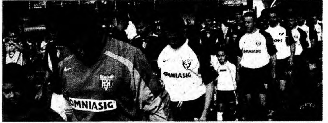
Jucătorii Jiului speră să nu mai părăsească terenul cu capetele plecate