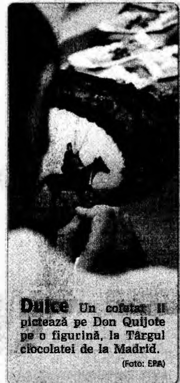
Dulce Un cofetar îl platează pe Don Quijote pe o figurină, la Târgul ciocolatei de la Madrid.