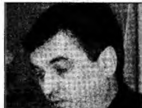
Nea Petrică liberalul!