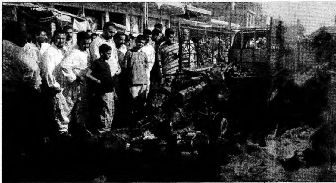
La Balad, zeci de irakieni s-au adunat ieri să vadă ce a mai rămas în urma exploziilor

El a remarcat inclusiv dublarea, în ultimele luni, a numărului de dosare de mare corupție, precizând că va fi informat periodic de către ministrul Monica Macovei și Vasile Blaga asupra sentințelor care vor fi emise în astfel de cazuri și că va urmări evoluția situației în perioada următoare.