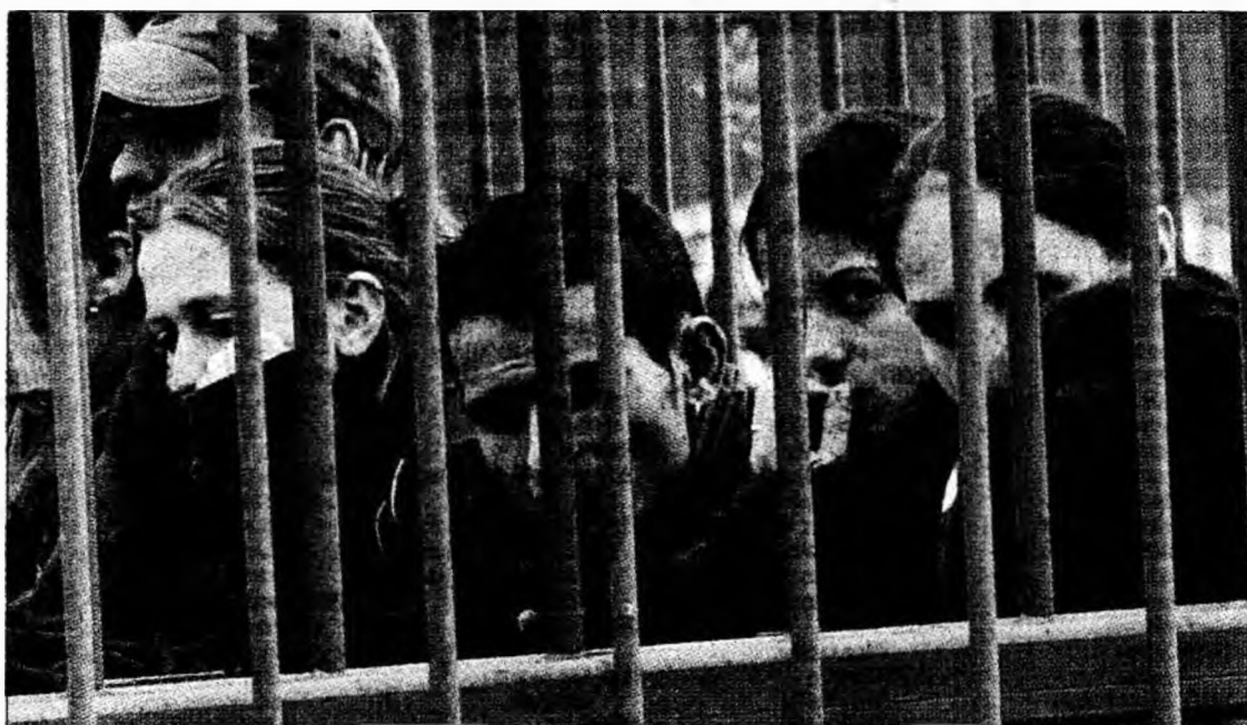
După protestul de la Deva și angajații de la SEWS Orăștie au intrat în grevă

Practic, muncitorii de la SEWS refuză mărirea salarială propusă de conducere atât timp cât ea este cuprinsă în prima de fidelitate. Bani pe care, în cazul unei absențe motivate de la locul de muncă, angajatul nu-i va primi. Un aspect delicat de neglijat (care ar trebui să intre în