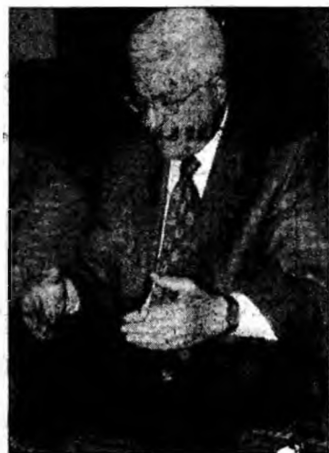
Mișcarea președintelui Abbas a devansat gruparea Hamas

Hamas a obținut rezultate foarte bune în primele două etape ale alegerilor, impunându-se mai ales în marile orașe.