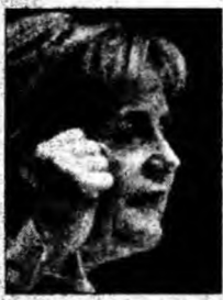
Angela Merkel

Sute de islamiști iranieni au protestat ieri la Teheran împotriva Statelor Unite și a Marii Britanii, acuzându-le de amestec în ceea ce privește politica nucleară a Iranului.