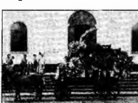
Moare cortegiul funerar

După ce-a rezolvat problema cazării porcilor în cocine de cinci stele, țafa UE s-a aplicat asupra morșilor noștri. Și folosind metode specifice (vorba poliștilor), a identificat o problemă urgentă. Așa că ne-a interzis să mai ținem mortu'n casă și ne-a cerut să-l ducem la casa mortuară. Acuma, sincer vorbind, poate are și UE asta dreptate. Cui îi arde după moarte, să dea nas în nas cu tipu' de la gaz sau cu administratorul blocului venit după taxele comune?