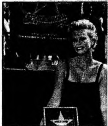
Charlize Theron

Opt ani mai târziu, a primit Oscarul pentru cea mai bună actriță în filmul „Monster”, în care a jucat rolul unei criminale în serie.