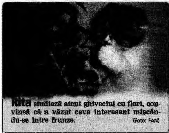
Hita studiază atent ghiiveciul cu flori, convinsă că a văzut ceva interesant mișcându-se între frunze.