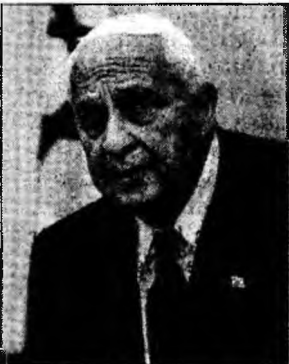
Ariel Sharon

Ierusalim (MF) - Premierul israelian, Ariel Sharon, și-a reafirmat susținerea față de Foaia de parcurs, declarând că dorește să pună capăt speculațiilor potrivit cărora Israelul are un plan secret pentru Cisjordania. „Aam auzit un zvon potrivit căruia am avea în vedere alte planuri. Nu este adevărat, deja avem unul: Foaia de parcurs. Nu avem nici un plan mai bun pentru viitorul Israelului și doresc să subliniez acest lucru din cauza speculațiilor pe marginea acestui subiect”, a explicat el. Doi colaboratori ai lui Sharon au adus în discuție posibilitatea ca, în cazul unui blocaj diplomatic, Israelul s-ar putea retrage unilateral din anumite zone ale Cisjordaniei și ar putea anexa altele.