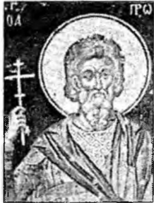
Sf. Mc. Prov