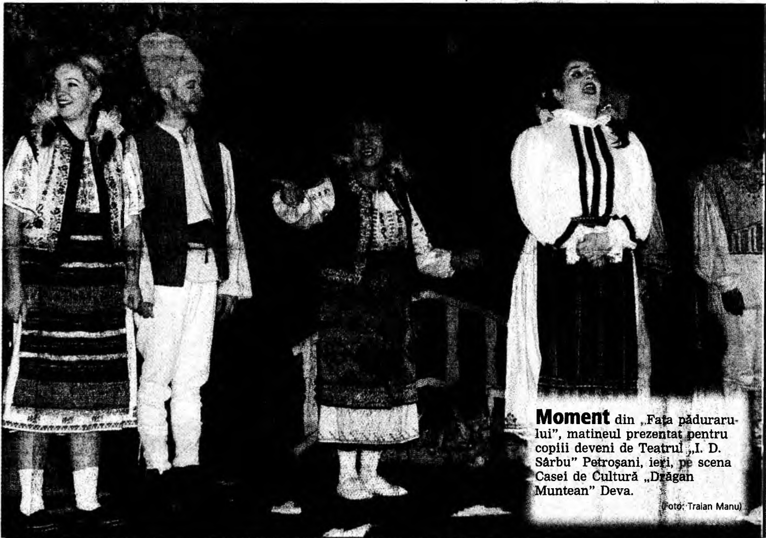
Moment din „Fața pădurarului”, matineul prezentat pentru copiii deveni de Teatrul „I. D. Sârbu” Petroșani, ieri, pe scena Casei de Cultură „Drăgan Muntean” Deva.