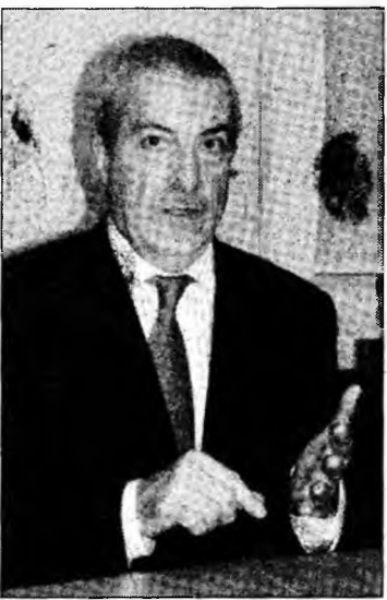
Premierul Țăriceanu

Calitatea de membru al unei organizații interzise prin Legea antiterorism din 2000 poate atrage pedepse de până la zece ani de închisoare.