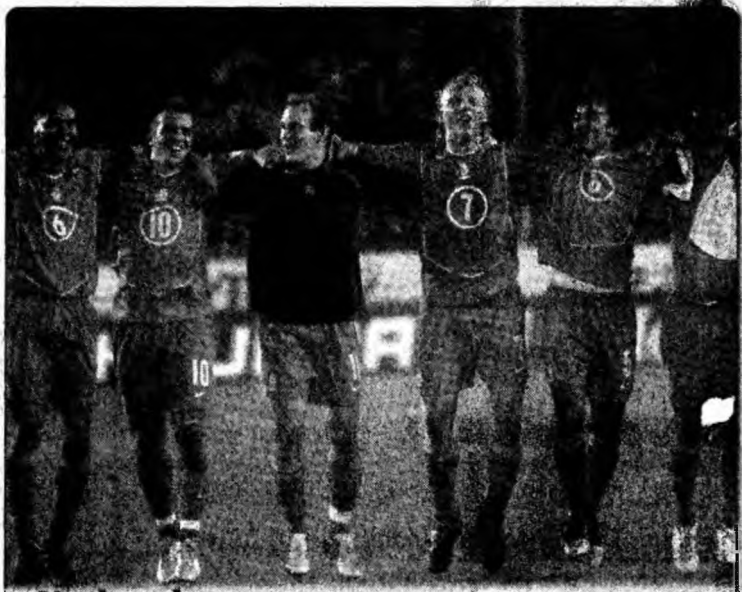
Naționala Olandei are deja biletele pentru turneul final al CM din Germania

Slovenia are la îndemână și varianta egalului, având golaveraj superior, în timp ce Rusia este nevoită să învingă pentru a ajunge la baraj.