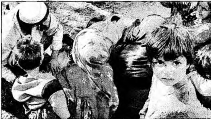
Așteaptă disperți un ajutor

Cei cinci copii erau luni încă în viață: trei băieți la sfârșitul amiezii, un altul în cursul serii și o fată, marți, la ora locală 4:00. Colonelul Jean-Jacques Mornat, responsabil în cadrul Securității Civile din Franța, a precizat