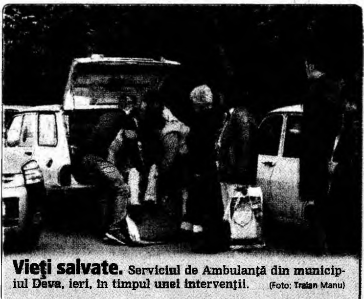
Vieți salvate. Serviciul de Ambulanță din municipiul Deva, ieri, în timpul unei intervenții.