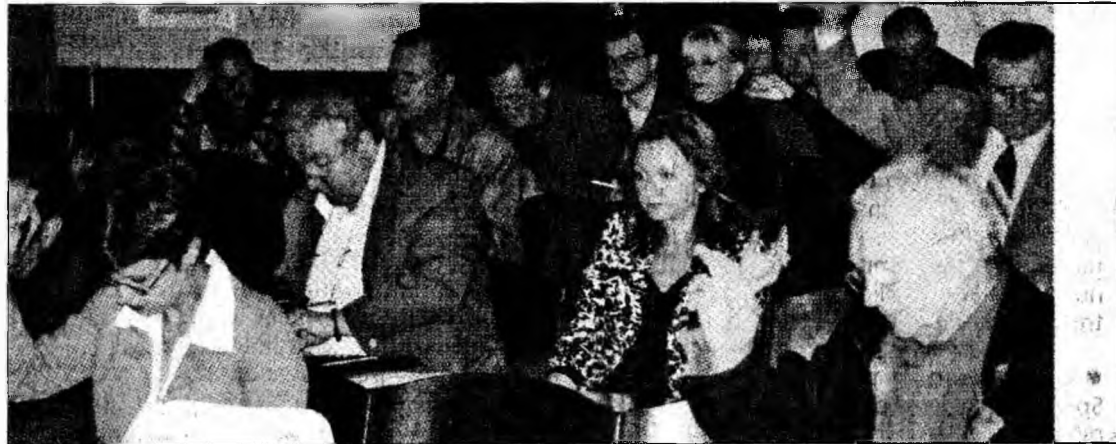
Ședință de Consiliu Local la Deva

Proiectul a fost respins, cu toate că nimeni nu a votat „împotriva”. S-au înregistrat însă 5 „abțineri” consemnate în rândul consilierilor PSD, PRM și ai PD. Practic, mai era nevoie de un vot „pentru”, ca proiectul să fie aprobat.