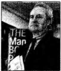
Banville

Los Angeles (MF) - Actrița americană Gwyneth Paltrow va juca rolul principal într-o comedie romantică ce va fi regizată de fratele său, Jake (30 ani), relatează cotidianul specializat Variety. Filmările pentru producția „The Good Night”, un film cu un buget de 15 milioane de dolari, ar trebui să înceapă în luna noiembrie la New York și la Londra.