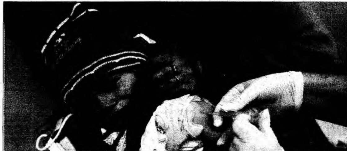
Vaccinul e recomandat doar persoanelor care prezintă risc înalt de îmbolnăvire

Există și o categorie de persoane pentru care vaccinul este contraindicat și poate duce la deces. Una dintre aceste categorii include persoanele alergice la proteinele din ouă, pentru că acestea sunt conținute în vaccin. Nici femeile însărcinate în primul trimestru de sarcină nu tre-