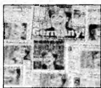
Merkel în presa germană