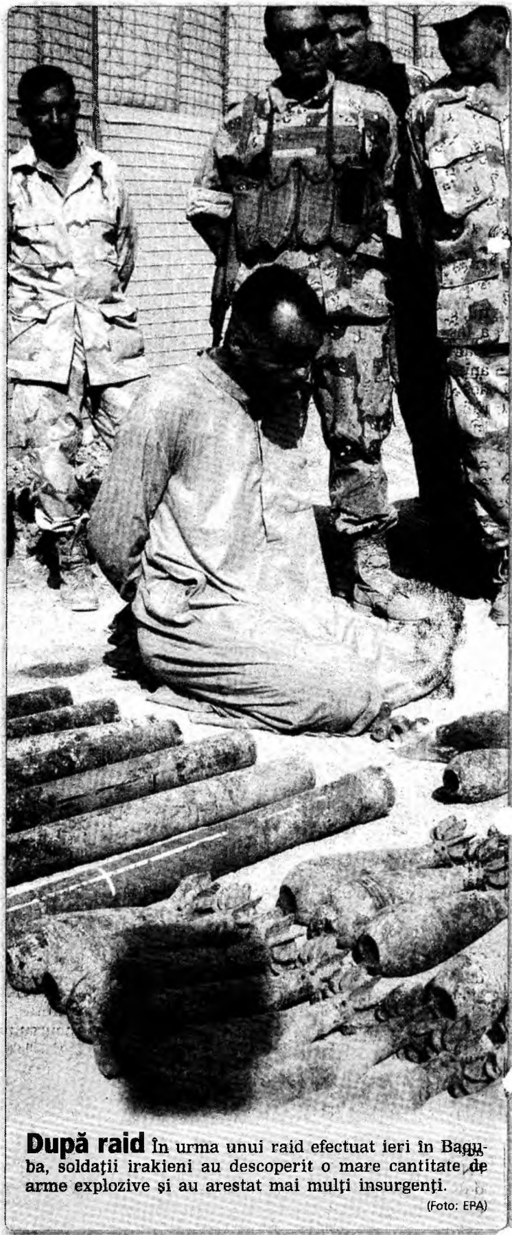
După raid în urma unui raid efectuat ieri în Baghba, soldații irakieni au descoperit o mare cantitate de arme explozive și au arestat mai mulți insurgenți.

Mai mult, liderii federațiilor sindicale din învățământ consideră că oricine va fi propus la conducerea Ministerului Educației ar trebui să adopte aceeași poziție în ce privește dimensionarea bugetului alocat în 2006 învățământului, pentru că sistemul nu va mai putea funcționa cu atât de puțini bani.