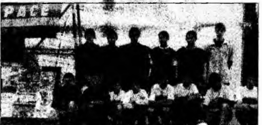
Echipa Mănăstirii Sf. Francisc

Deschiderea oficială se va face în prezența colaboratorilor și conducerii liceului și va fi semnată „Declarația de Sinceritate” de către toți cei care vor participa la activități. În perioada 17-21 octombrie va fi organizat un turneu de fotbal având ca invitați: Grădinița cu Program Special, Casa de Copii, Mănăstirea Sf. Francisc, Grupul Școlar „Teglas Gabor”, clasele de limba germană de la Colegiul Național Decebal, echipa de fotbal - Biserica Reformată și echipa de fotbal Casa de rugăciuni.