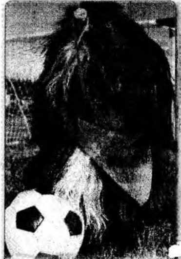
Ben Câinele din rasa Shih Tzu este unul din cei 6.200 de participanți la cea mai mare expoziție canină din Germania, de la Dortmund, care se va deschide vineri.