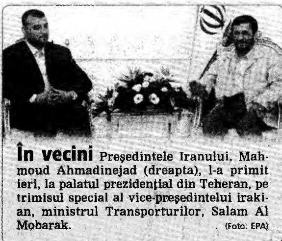
În vecini Președintele Iranului, Mahmoud Ahmadinejad (dreapta), l-a primit ieri, la palatul prezidențial din Teheran, pe trimisul special al vice-președintelui irakian, ministrul Transporturilor, Salam Al Mobarak.

Premierul Țăriceanu a anunțat că va solicita membrilor Consiliului Național al Coaliției să accepte limitarea bugetului alocat Camerei Deputaților și Senatului la același nivel ca în acest an, având în vedere că fondurile disponibile trebuie orientate către proiectele sociale. „Pentru acest an, găsesc de cuviință că este necesar ca aceste cheltuieli să fie plafonate și să nu mai crească față de nivelul din 2005”, a spus Țăriceanu.