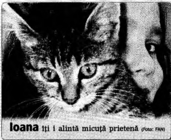
Ioana îți i alintă micuță prietenă

Beijing (MF) - China, care va lansa astăzi cel de-al doilea său zbor spațial cu oameni la bord, a dezvoltat un program foarte ambițios, pentru a dispune de o stație spațială înainte de a trece la explorarea lunară. În caz de reușită, naveta Shenzhou VI va fi ocazia perfectă pentru chinezi de a merge mai departe, prin trimiterea unui echipaj de doi oameni pentru o perioadă mai mare, de cinci zile, cu scopul de a face experimente științifice.