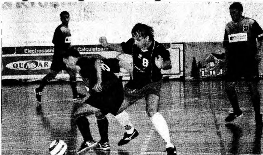
Jucătorii de la Quasar au progresat mult față de primele etape ale Diviziei B

„Suntem mulțumiți de rezultate și vom aborda și meciurile următoare cu intenția de ne menține pe o linie ascendentă. Sperăm ca la finalul turului să ocupăm unul dintre locurile fruntașe ale clasamentului, pentru ca în retur, pe măsura acumulării