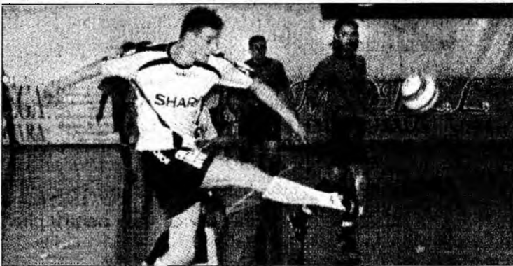
Ofensiva va fi strategia de bază a FC CIP