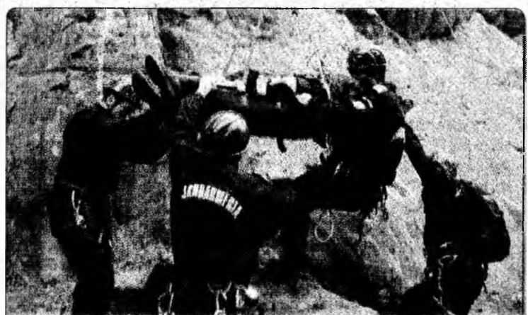
Jandarmii care acționează în cadrul structurilor montane vor beneficia de echipament și dotări cu materiale, după modelul colegilor lor din Franța. /p. 3

de circa 129 milioane lei noi”, a declarat Lucian Heiuș, directorul instituției. Tot în acest an, finanțelor hunedorene le-a fost distribuită o sumă de 2,8 milioane lei noi ca urmare a lichidării patrimoniului debitorilor aflați în procedură de lichidare. În cazul debitorilor care nu mai au active de valorificat în cadrul procedurii reorganizării judiciare și a falimentului, s-a cerut atragerea răspunderii patrimoniului administratorilor, în 80% dintre situații cererea fiind admisă de către instanțele de judecată.