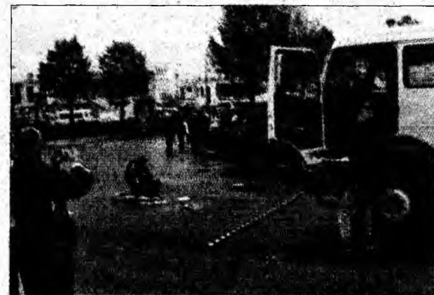
Măsurători la accidentul de la gară