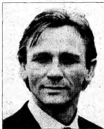
Daniel Craig

■ Actorul Daniel Craig va juca rolul în al 21-lea episod din serie, filmul „Casino Royale”.