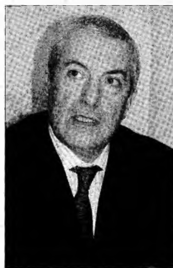
Călin Popescu Tăriceanu

Președintele liberal le-a spus, însă, în vedere să se decidă, până la 1 noiembrie, asu-