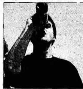
Dușca de la schimbul 3