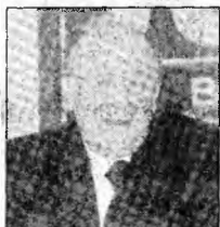
Ion Iliescu