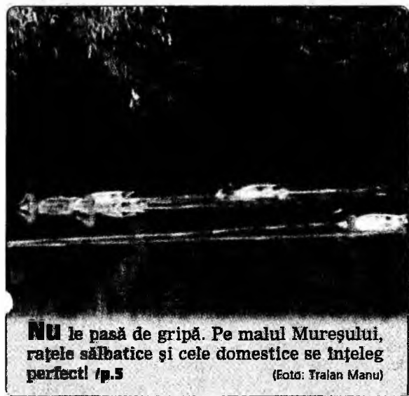
NU le pasă de gripă. Pe malul Mureșului, rațele sălbatice și cele domestice se înțeleg perfect! /p. 5

tală verde. Au fost recuperate 50 de grame canabis verde vândut anterior altor tineri. Cei doi sunt cercetați în libertate pentru „operațiuni fără drept, cu droguri de risc” și riscă o pedeapsă cu închisoarea de la 5 la 15 ani, dar pentru că sunt minori, pedeapsa va fi redusă la jumătate.