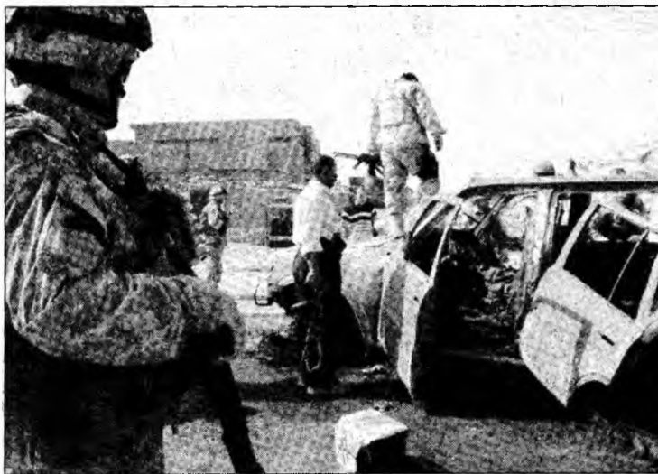
Trei sedii ale Partidului Islamic Irakian, care și-a îndemnat simpatizanții să voteze în favoarea proiectului de Constituție, au fost ieri ținta unor atacuri

Pe listele electorale sunt înscrisi 15.550.928 de alegători, dintr-o populație totală de circa 26 de milioane de persoane. Autoritățile au organizat 6.235 de birouri de vot, cu 31.809 urne, iar alegătorii sunt așteptați între orele locale 7.00 și 17.00 (4.00 - 14.00 GMT).