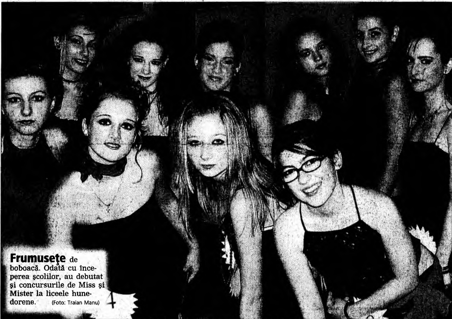
Frumusețe de boboacă. Odată cu începerea școlilor, au debutat și concursurile de Miss și Mister la liceele hunedorene.