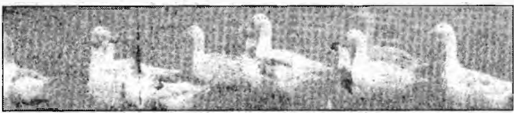
Rațele sălbatice și cele domestice conviețuiesc

Și totuși, dacă mâine apare gripa aviară, cine răspunde?