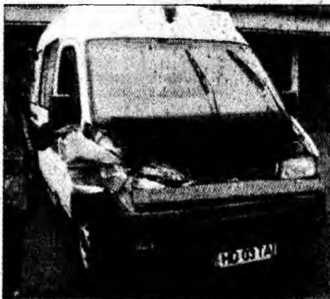
Pagubele sunt de 50-60 milioane lei

În jurul orei 11:00, o ambulanță din Deva a plecat cu patru bolnavi din localitate, spre Petroșani, unde urma să