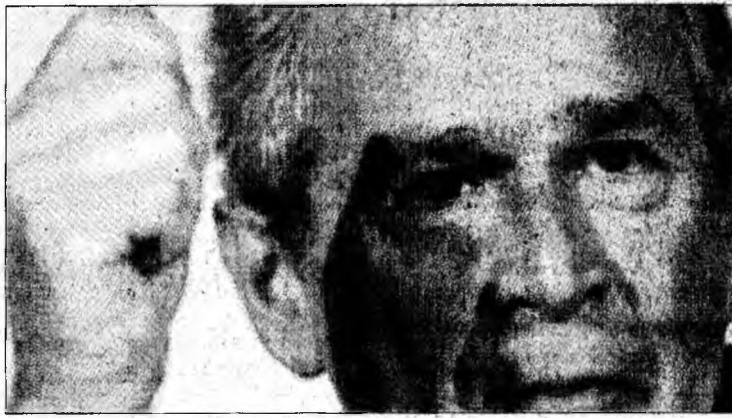
Face față greu stresului inerent funcției

■ George W. Bush scrâșnește din dinți și clipește des atunci când este în dificultate.