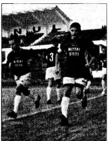
Va fi prima victorie?