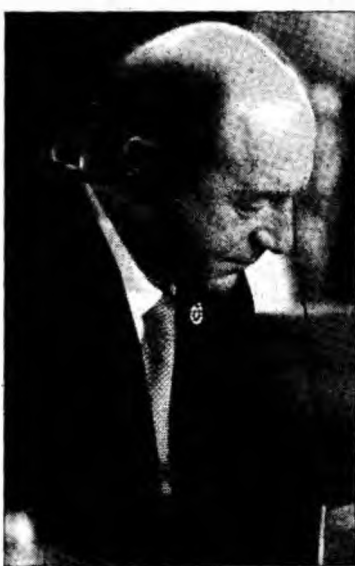
Președintele Traian Băsescu la Zagreb

„Extinderea UE către întreaga zonă a Balcanilor de Vest (fostele republici iugoslave și Albania) este răspunsul adecvat pentru prevenirea crizelor și asigurarea dezvoltării în regiune”, a declarat președintele Traian Băsescu.