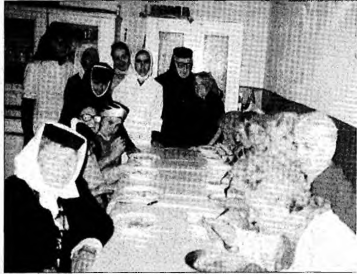
Subvenția este de 89 RON / persoană asistată

toxico-dependente; persoane victime ale traficului de persoane; persoane migrante și refugiați; persoane tinere care părăsesc sistemul de protecție a copilului; persoane fără adăpost.