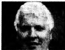
Resmeriță la Lupeni