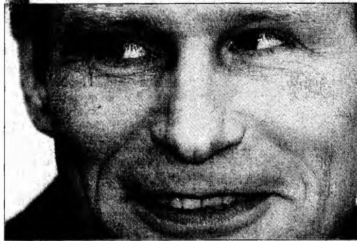
„Canibalul din Rotenburg”, Armin Meiwes.

Berlin (MF) - Armin Meiwes - numit „Canibalul din Rotenburg” și condamnat în 2004 pentru că a ucis și mâncat o persoană cu consimțământul acesteia - va fi din nou judecat, începând din 12 ianuarie, a anunțat un purtător de cuvânt al tribunalului din Frankfurt, relatează AFP. În aprilie 2005, Curtea federală de justiție din Karlsruhe a ordonat rejudecarea lui Meiwes, condamnat la opt ani și jumătate de închisoare, la finalul unui proces foarte mediatizat. Curtea a apreciat că tribunalul de înaltă in-