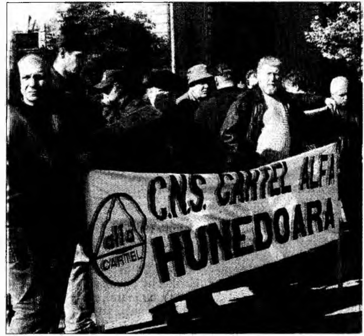
Proteste vor continua sub altă formă

Grevele profesorilor nu mai reprezintă de mult un eveniment pentru elevi. De câțiva ani fiecare toamnă este marcată de protestele acestora. Cei mai mulți dintre elevi au ajuns să nu se mai bucure de „pauzele” de activitate oferite, vrând-nevrând, de către dascălii lor, pentru că nici recu-