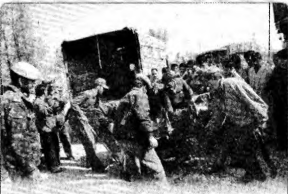
Atentat sinucigaș O mașină-capcană a explodat ieri, la Srinagar, capitala de vară a Kashmirului indian. În deflagrație au murit 5 oameni și 15 au fost răniți.

Sud-estul Anatoliei, populat în majoritate de kurzi, este teatrul unui conflict sângeros între forțele de securitate turce și rebelii kurzi din PKK.