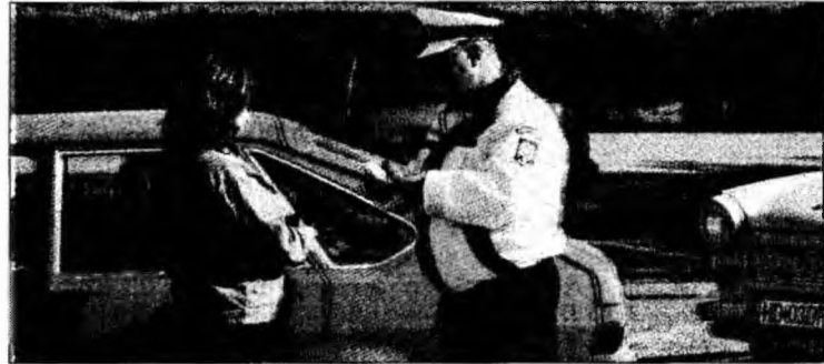
Polițiștii au aplicat 42.000 de amenzi de circulație

Deva - Statistic, la un număr de aproximativ 80.000 de autoturisme înmatriculate în județul Hunedoara, în acest an, unul din 70 de șoferi a rămas fără permis. Datele furnizate de Poliția Județului Hunedoara arată că, în primele nouă luni ale acestui an, au fost „ridicate” 1264 de permise și 1191 de certificate de înmatriculare. Cea mai frecventă cauză a fost abaterea repetată de la normele de