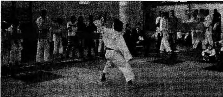
S-au luptat pentru laurii de campioni

Petroșani - Recent s-au încheiat Campionatele Naționale de Karate Shito Ryu, de kumite, pentru cadeți și juniori. Aproximativ 100 de karatiști de la 15 cluburi din țară s-au bătut pentru laurii de campioni. „Cu toate că de la competiție au lipsit reprezentanții de la cluburile Steaua și Italo, au participat cei de la Dinamo, care și-au luat partea leului. Și noi am avut o prestație bună, iar la juniori