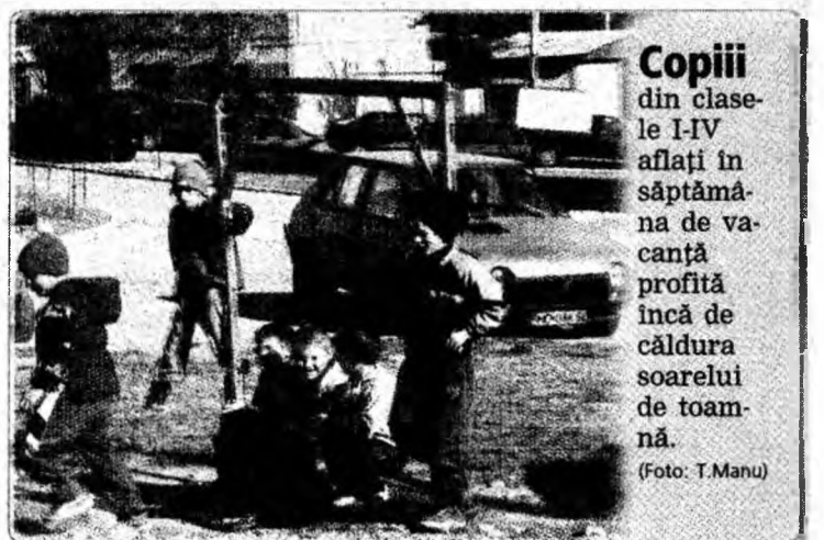
Copiii din clasele I-IV aflați în săptămâna de vacanță profită încă de căldura soarelui de toamnă.

mâncare și cazare. Eu am închiriat un studio la 15 minute de mers pe jos până la Parlament pentru care plătesc lunar 700 euro. Transportul aerian este suportat de ei sau 29 eurocenți per litru de benzină. Spre exemplu, pentru cele patru zile cât sunt în România am primit 1072 euro. E adevărat, Guvernul nostru alocă doar 25 euro pe lună pentru roaming, însă în ansamblu banii sunt suficienți”, spune Duca.