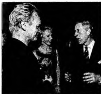
Sting și Charles la recepție.

Washington (MF) - Prințul Charles și ducesa de Cornwall au ajuns marți în Statele Unite. Ei au vizitat Ground Zero din New York și, de asemenea, au participat la o recepție la Muzeul de Artă Modernă. Cei doi au fost văzuți stând de vorbă cu mai