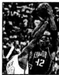
Primul meci după talfun