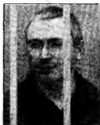
Mihail Hodorkovski Apel

Londra (MF) - Ministrul britanic al Muncii și Pensilor, David Blunkett, a demisionat ieri. Asupra lui s-au făcut presiuni pentru a demisiona după ce a încălcat codul de etică lucrând pentru o companie fără a avea avizul prealabil din partea unei comisii specializate a Camerei Comunelor. În centrul controversei se află funcția de director al companiei, pe care Blunkett a deținut-o timp de două săptămâni, înainte de alegerile din mai, când nu mai făcea parte din Guvern. Este pentru a doua oară când Blunkett demisionează. El a demisionat din funcția de ministru de Interne în decembrie 2004, când a fost acuzat că și-a folosit funcția pentru a obține o viză de ședere pentru dădaca partenerii sale.