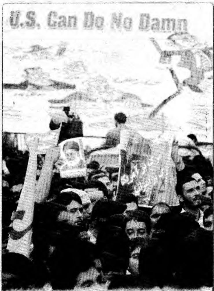
Mii de iranieni au ieșit în stradă la Teheran, ieri, pentru a marca aniversarea luării de ostajitate de la ambasada SUA din capitala Republicii Islamice, acțiune în urma căreia relațiile dintre cele două state s-au schimbat fundamental. La 4 noiembrie 1979, studenții islamisti au luat cu asalt ambasada SUA, sechestrând circa 50 de diplomați timp de 444 de zile.

Premierul a precizat că i-a comunicat președintelui Traian Băsescu faptul că l-a sunat pe procurorul general pentru a se informa în cazul lui Dinu Patriciu.