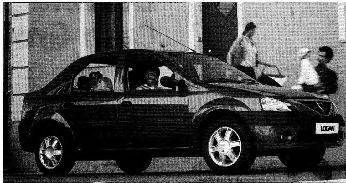
Există interes pentru varianta Logan diesel

„În acest an reprezentanța noastră a vândut 1200 de autoturisme și estimăm că vânzările vor atinge la finele anului 1400-1500 de unități”, a