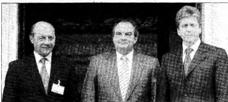
Președintele Traian Băsescu, premierul grec Constantinos Karamanlis și președintele bulgar Gheorghe Părvanov

Un martor ocular a declarat că imobilul a fost afectat serios de explozie. „Dispozitivul era ascuns într-un coș de gunoi. S-au spart ferestre, clădirea a fost afectată, tavanul s-a prăbușit parțial. O explozie identică a avut loc la 2 august, vizând tot aceste companii.