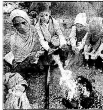
Se apropie iarna.

adăposturilor” pentru supraviețuitorii, a declarat generalul. El a solicitat comunității internaționale să trimită mai multe medicamente, vaccinuri împotriva tetanosului și material medical. Națiunile Unite și-au exprimat dezamăgirea față de lipsa de fonduri acordate Pakistanului, avertizând că ajutorul internațional ar putea fi suspendat.