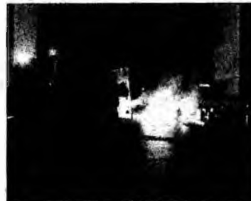
Incidente la Clichy-sous-Bois.

din regiunea pariziană. Aceste incidente ilustrează din nou tensiunile din localitățile sărace din jurul Parisului, unde locuiesc numeroase familii de imigranți.