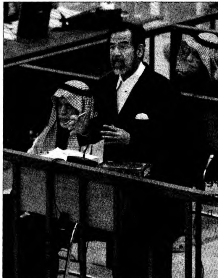
Saddam Hussein în boxa acuzaților