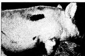
Deșeurile vor fi incinerate

Deva (C.P.) - Cei 15 proceșatori de carne și primăriile din județ beneficiază de bani de la buget pentru colectarea animalelor moarte și a deșeurilor rezultate din prelucrarea cărnii și trimiterea lor la incinerare. „Procesatorii au deja încheiate contracte cu o firmă specializată în prestarea acestor servicii. Un procesator din județ a achiziționat o incinerator ecologic și urmează a fi pus în funcțiune după obținerea avizelor. Populația trebuie să anunțe existența animalelor