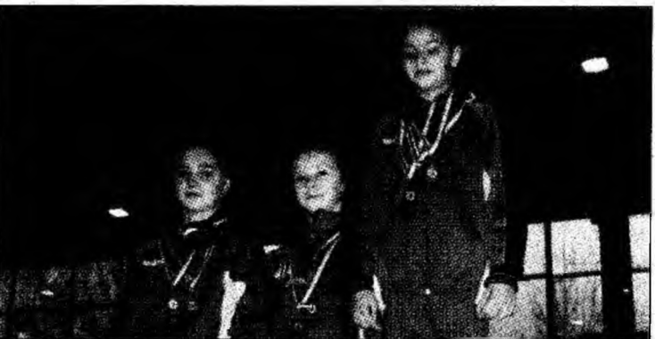
Trei dintre gimnastele devence medaliate în Ungaria