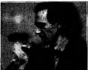
Ralph Fiennes

După ce a dezmințit aceste zvonuri, Fiennes a refuzat să mai facă vreun comentariu pe această temă. „Va da în judecată ziarul. Nu este nimic adevărat din ceea ce s-a scris în articolul respectiv. Este pur și simplu un caz de denigrare personală”, a declarat un bun prieten al lui Fiennes.