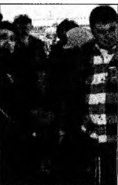
Suporterul leșinat la poarta stadionului

Petroșani (C.M.) - O persoană a leșinat din cauza busculadei create de numărul mare de suporterii care aproape s-au călcat în picioare la intrarea de la tribuna I a Stadionului Jiul înaintea partidei de sâmbătă cu Steaua. Incidentul a fost iscat de proasta organizare asigurată de oficialii Jiului și de excesul de zel al forțelor de ordine. Reprezentanții clubului au asigurat prea puține porți pentru intrarea în stadion, deși se știa că va fi un mare afluz de suporterii, iar jandarmii au încetinit accesul pentru că au întâmpinat publicul în trei valuri, percheziționând în trei etape la sânge fiecare om. Acest gen de evenimente umbresc eforturile făcute de conducerea Jiului pentru modernizarea stadionului care într-adevăr dau bazei sportive o alură occidentală.