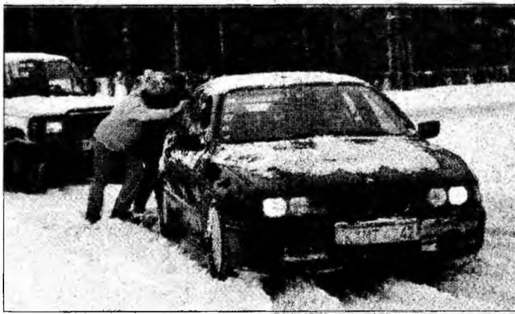
Blocați în zăpadă

În Franța, unde ninge de miercură trecută, cinci persoane și-au pierdut viața din cauza frigului. Un bărbat de 40 de ani a fost găsit mort din cauza hipotermiei, sâmbătă, într-o pădure din regiunea pariziană, și un altul, de 58 de ani, a fost descoperit mort din