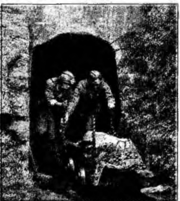
Scot răniții din mină

Accidentul a avut loc în mina Dongfeng din comuna Qitaihe, provincia Heilongjiang, în apropierea frontierei cu Rusia. Situația de la fața locului nu este cunoscută cu exactitate, autoritățile locale refuzând să dea informații despre accident.