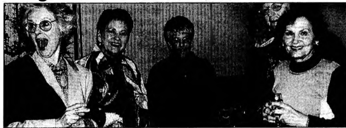
Din 2006 accizele la produsele de lux vor crește

Creșterile de prețuri vor veni în cascadă în 2006. Ele vor fi provocate de majorarea accizelor la toate produsele și de introducerea unor noi măsuri privind antrepoziția fiscală. Este vorba de creșteri de nivel la accizele la tutun, benzină, păcură, alcool și energie, conform înțelegerii cu UE, de la 1 iulie 2006.