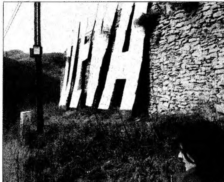
Cetatea - loc de exhibiții ilegale?