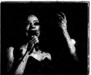
Diana Ross