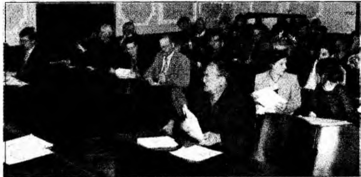
Consilierii au votat pentru curățenie. Numai să fie!

tul de delegare a gestiunii respectivului serviciu, prevede că activitatea de salubritate va fi executată în zonele II și III ale Devei. Totodată, au fost stabilite și componentele comisiei de evaluare a ofertelor pentru licitația publică deschisă, condusă de viceprimarul Ioan Inișconi, și a comisiei de soluționare a contestațiilor, condusă de viceprimarul Florin Oancea. Singura problemă a fost ridicată de către consilierul PSD Florin Ghergan, care a precizat că „trebuie să avem grijă ca nu cumva tarifele pentru salubritatea acestor zone ale Devei să fie mai