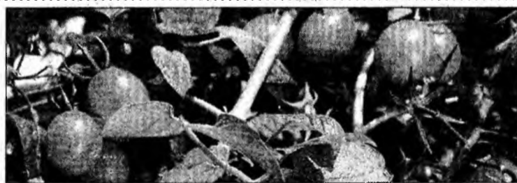
În agricultura ecologică se interzice folosirea de pesticide

îngrășăminte organice (bălegar, îngrășăminte verzi și composturi) sau îngrășăminte minerale naturale (fosfați, praf de rocă, calciu provenit din var). Se impune de asemenea rotația culturilor - în