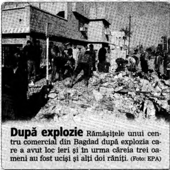
După explozie Rămășițele unui centru comercial din Bagdad după explozia care a avut loc ieri și în urma căreia trei oameni au fost uciși și alți doi răniți.

Bruxelles (MF) - Condoleezza Rice a dat, miercuri, semnalul unei schimbări majore a politicii Washingtonului prin declarația explicită conform căreia personalului american îi este interzis să utilizeze tratamente crude, inumane și degradante asupra deținuților. Această schimbare marchează o victorie semnificativă pentru senatorul republican John McCain, cel care propus un amendament care să interzică explicit aplicarea de tratamente crude, inumane și degradante prizonierilor de către personalul american în afara teritoriului SUA. Această schimbare reprezintă și o înfrângere pentru vicepreședintele Dick Cheney, care a luat măsuri pentru a bloca inițiativa senatorului McCain.