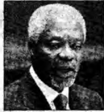
Kofi Annan