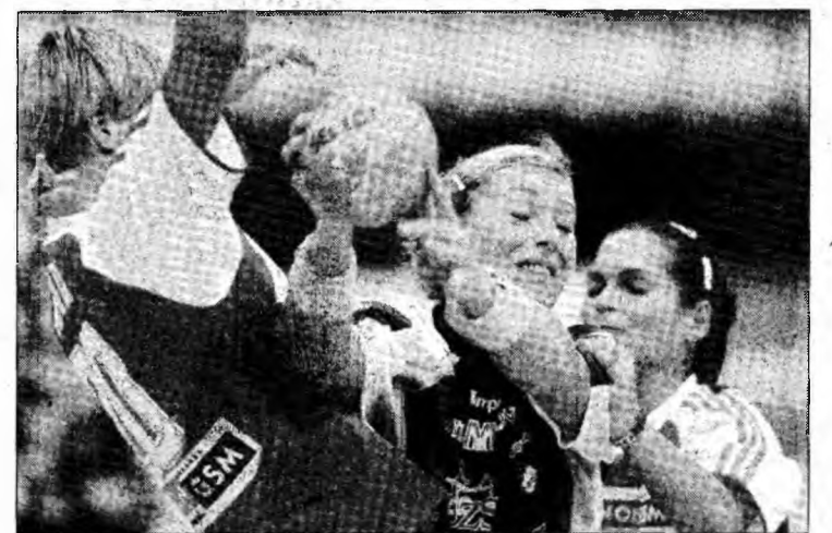
Trofeul este încă departe!

pentru transferul coechipierului lui Chivu, atacantul Antonio Cassano. În ceea ce-l privește pe Cassano, sursa