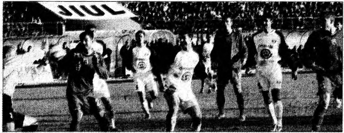
Să sperăm că nu se va întâmpla ca în meciul cu Steaua

Până la urmă, meciul se dispută astăzi, iar oficialii Jiului cred că acum se poate obține un punct în Giulești. „Vrem să încheiem bine anul,