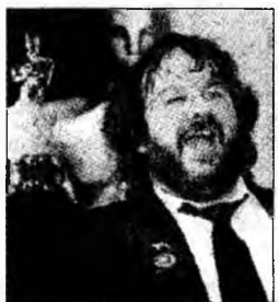
Acum și înainte