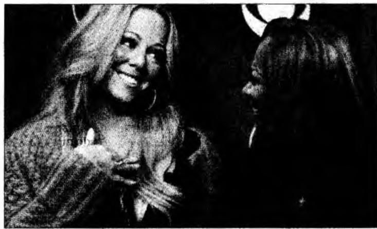
Mariah Carey discută de nominalizări cu Patti LaBelle

Paul McCartney este nominalizat la trei categorii, inclusiv la „Cel mai bun album” pentru „Chaos and Creation