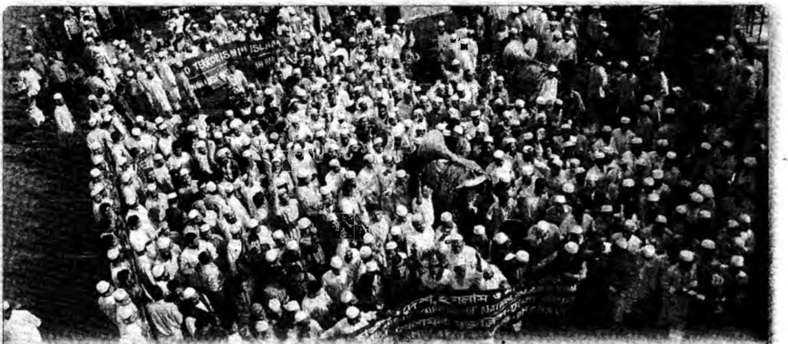
Marș de protest Activiștii islamisti din Bangladesh au protestat împotriva atentatului sinucigaș care a avut loc ieri lângă moscheea națională din orașul Paltan Dhaka și în urma căruia au murit cel puțin opt oameni, alți 70 fiind răniți.

Paris (MF) - Țările occidentale au condamnat cu vehemență afirmațiile președintelui iranian Mahmud Ahmadinejad, care a sugerat că statul israelian, catalogat drept o „tumoare”, ar trebui transferat în Europa. Joi, liderul de la Teheran a stârnit noi controverse, declarând că Austria și Germania ar trebui să cedeze o parte din teritoriul lor Israelului dacă se consideră într-adevăr vinovate de masacrarea evreilor în timpul celui de-al doilea Război Mondial. Israelul a catalogat aceste afirmații drept „scandaloașe și rasiste”.