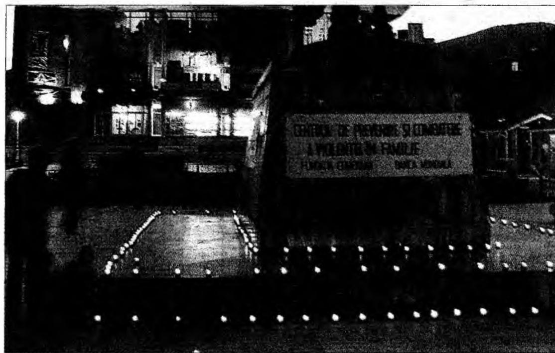
Seară de veghe în memoria victimelor violenței

Un exemplu al lipsei de curaj al victimelor este cel al unei bătrâne de 60 de ani, care a apelat la centrul devenea. Deși a fost abuzată întreaga sa viață de soț, a