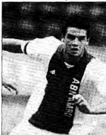
Cristi Chivu

■ Două mari cluburi italiene se bat pentru a-l achiziționa pe fundașul român.