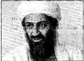
Osama ben Laden

Washington (MF) - Comandantul militarilor americani din Afganistan a declarat, joi, că Osama ben Laden este considerat ca fiind în viață și că trupele americane îl caută în continuare. Karl Eikenberry a precizat că nu are motive să creadă că ben Laden ar fi murit în timpul cutremurului din Pakistan, de la 8 octombrie. În ultimul timp, responsabili militari americani au avut tendința de a minimaliza amenințarea pe care ar putea-o reprezenta ben Laden, subliniind că acesta se ascunde în munții din Pakistan. Potrivit lui Eikenberry, capturarea liderului al-Qaida rămâne un obiectiv pentru Statele Unite. „Trupele noastre nu se vor opri atât timp cât nu va fi găsit, capturat sau ucis”, a subliniat el.