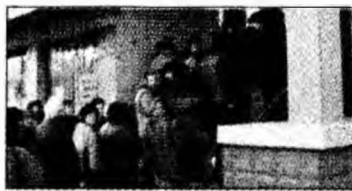
Coadă la medicamente

pe drumuri. Pentru ce asta am cotizat 35 de ani?”, se întreabă nemulțumit omul.