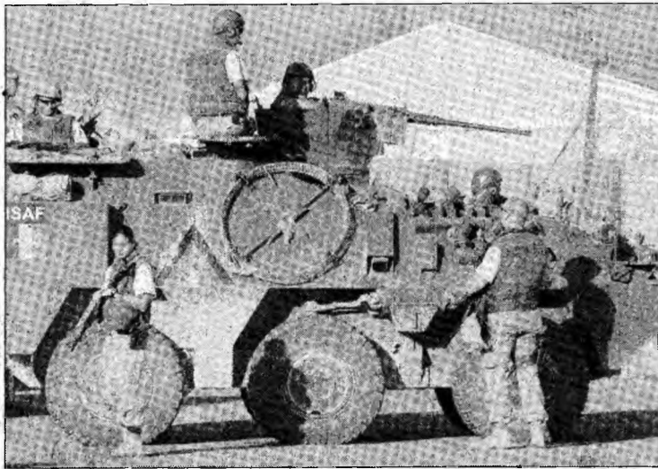
Militari belgieni din cadrul ISAF la Kabul

Marea Britanie, Olanda și Canada vor furniza cei mai mulți soldați care vor constitui efectivele în cadrul acestei extinderii a misiunii Forței Internaționale de Asistență pentru Securitate (ISAF), care