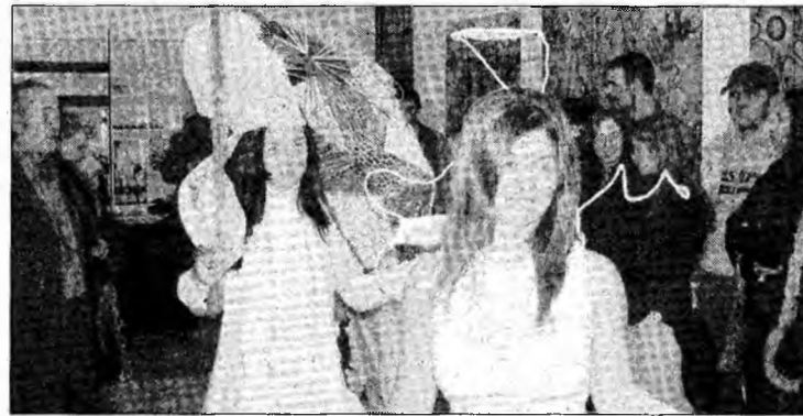
Două dintre „costumele creative” prezentate

Pe simeze, numerosul public a admirat lucrări de pictură, grafică, ilustrație de carte, fotografii realizate după metode moderne. În expoziție mai există machete și un panou cu activitatea liceului. De asemenea, la vernisaj s-a proiectat un film de scurt