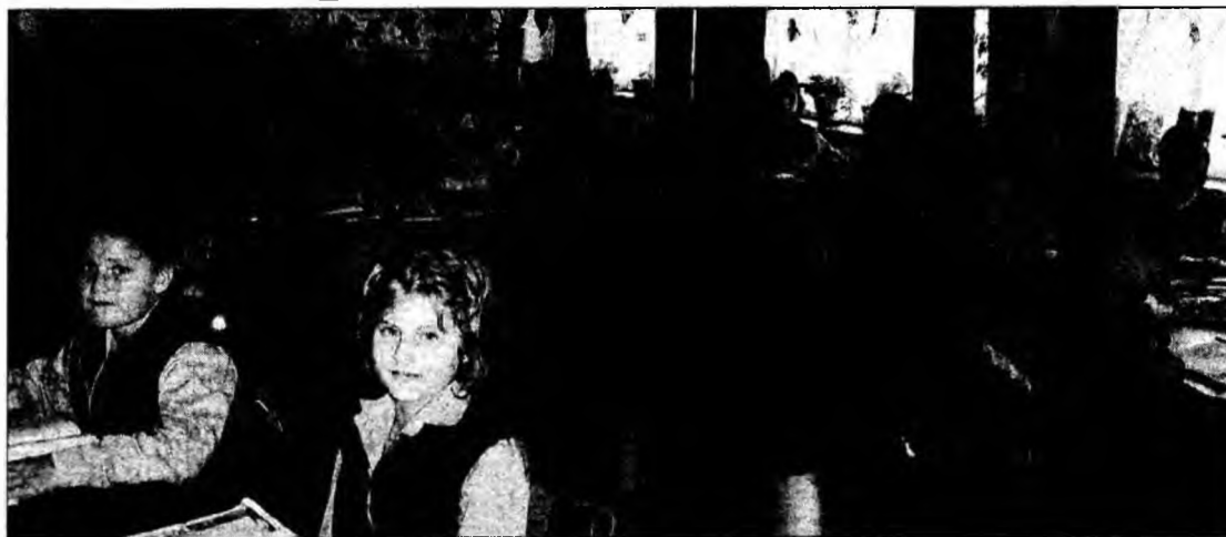
Sală de curs

Săptămâna viitoare va mai avea loc și o altă premieră: se vor acorda premii consistente, de cinci milioane de lei, pentru cele mai bune lucrări