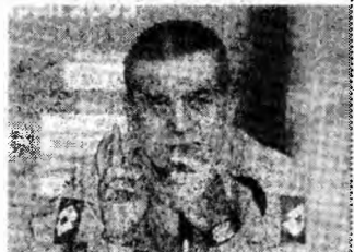
Anghel Iordănescu

București (MF) - Formația saudită Al Ittihad, antrenată de tehnicianul român Anghel Iordănescu, a ratat calificarea în finala CM al cluburilor, după ce a pierdut, ieri, la Tokyo, cu scorul de 2-3, partida disputată în compania formației braziliene Sao Paulo. Golurile formației pregătite de Anghel Iordănescu au fost marcate de Mohammed Noord, în minutul 33, și Hamad Al Montashari, în minutul 68. Pentru Sao Paulo au înscris Amoroso, în minutele 16 și 47, și Rogerie Ceni, în minutul 57, din penalti. Al Ittihad va disputa finala mică a competiției, duminică, în compania învinsei din cea de-a doua semifinală, care se va disputa, azi, între echipa costaricană Deportivo Saprissa și formația engleză Liverpool.