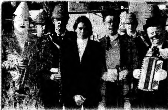
De la circ Prințesa Stephanie de Monaco a fost prezentă, marți, la conferința de presă de la Monte Carlo, legată de cea de-a 30-a ediție a Festivalului Internațional de Circ 2006.

● S-au aprins vaporii. Un nou incendiu a izbucnit ieri dimineață la unul dintre rezervoarele de la depozitul de carburanți din Buncefield. S-au aprins vaporii de petrol scurși dintr-un rezervor. Focul a fost ținut sub control.