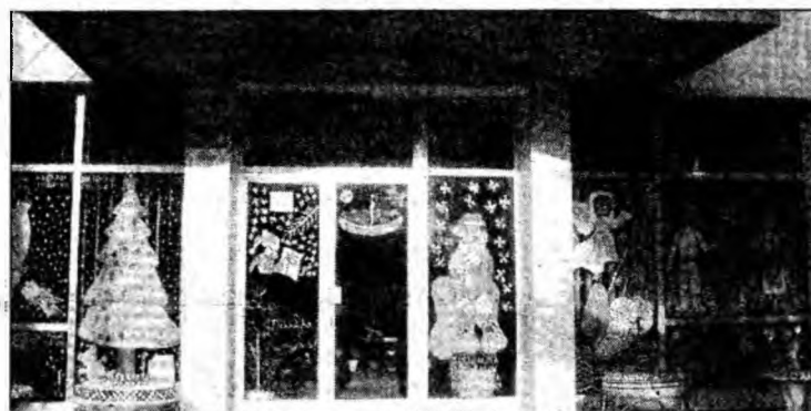
Pregătiți de sărbători