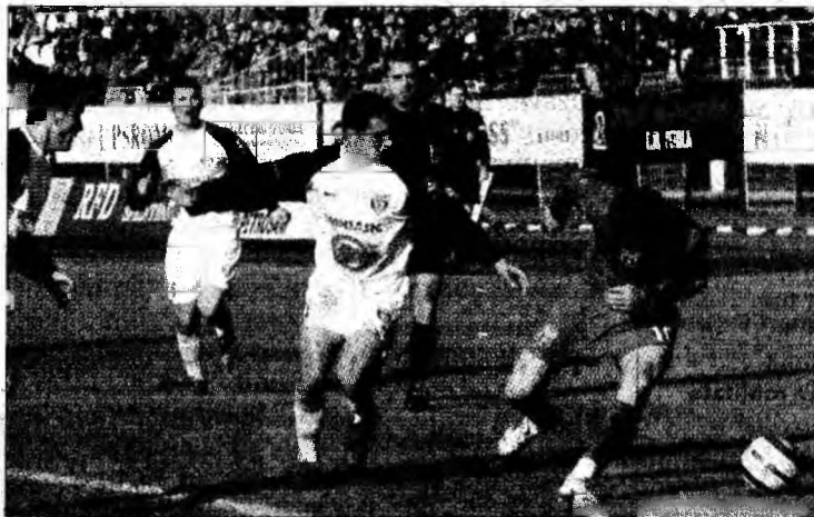
Meciul cu Steaua a fost cel mai bun joc al Jiului, pe teren propriu