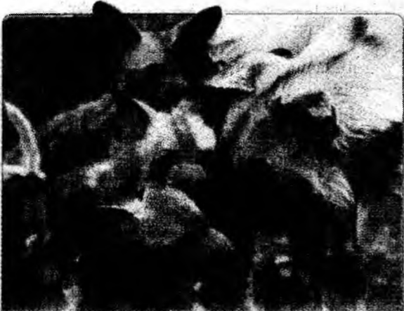
La zoo Puii de câine sălbatic african stau în jurul mamei lor, Moreni, la grădina zoologică din Basel, Elveția.

Londra (MF) - Regina Elisabeta a II-a a Marii Britanii a redactat și a transmis o știre pe fluxul Reuters, cu ocazia inaugurării noului sediu londonez al agenției de presă. „Regina a inaugurat noul sediu Reuters din Londra”, acesta a fost materialul redactat. Regina a scris știrea și i-a dat drumul pe flux marți, la ora locală 11.39, în timp ce efectua un tur al sediului Reuters din Canary Wharf.