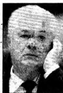
Vladimir Voronin