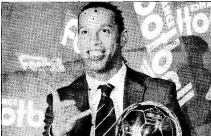
Ronaldinho a câștigat în 2005 și Balonul de Aur