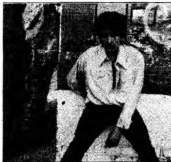
Bob Dylan