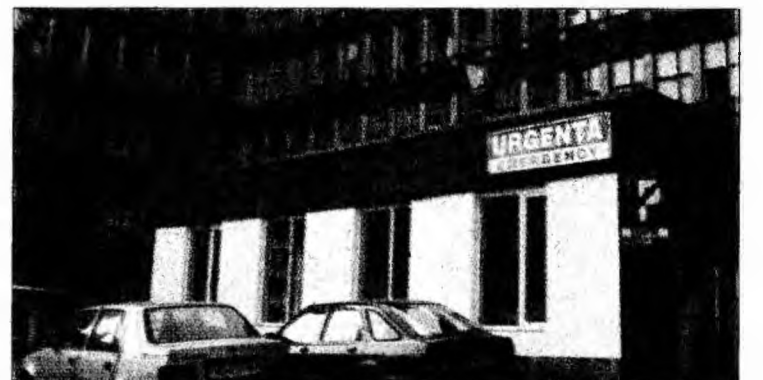
Spitalul Municipal Hunedoara

Curtea de Apel Alba Iulia le-a dat câștig de cauză și există și un ordin de executare silită, legea s-a schimbat din 28 iulie 2005. „Pentru că am primit doar un spor de 50% pentru analize, am intentat un proces de contestație”, spun biologii. „Analizele de acest tip reprezintă 2% din totalul analizelor efectuate la noi în spital. În urma ultimei hotărâri legislative, cei care efectuează aceste analize sunt plătiți în funcție de analize. Am fost acuzat că am externalizat efectuarea de analize și este adevărat. Dar am făcut-o cu acordul consiliului de administrație al spitalului.