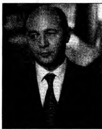
Traian Băsescu

Președintele a luat parte pentru prima dată la ședințele CSM în 12 ianuarie, mai exact la ședința de constituire a noului CSM. El a pledat atunci pentru asigurarea inde-