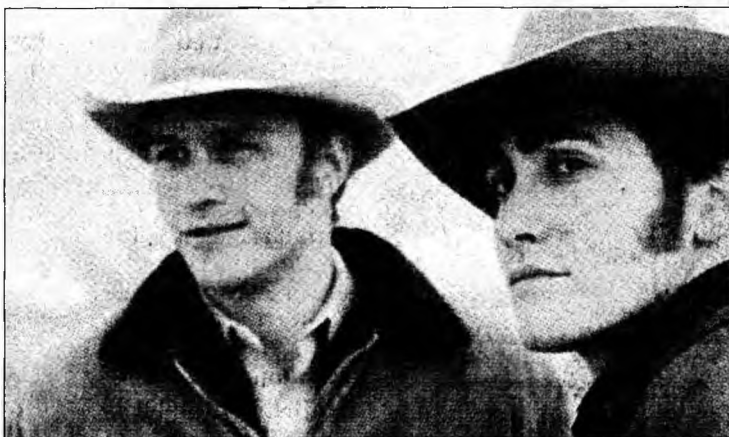
Heath Ledger și Jake Gyllenhaal în „Brokeback Mountain”

Filmul mai este nominalizat, printre altele, la categoriile cel mai bun film de dramă și cel mai bun regizor (taiwanezul Ang Lee). Heath Ledger ar putea primi premiul pentru cel mai bun actor, iar Michelle Williams pe cel pentru cea mai bună actriță într-un rol secundar. Filmul relatează povestea de dragoste