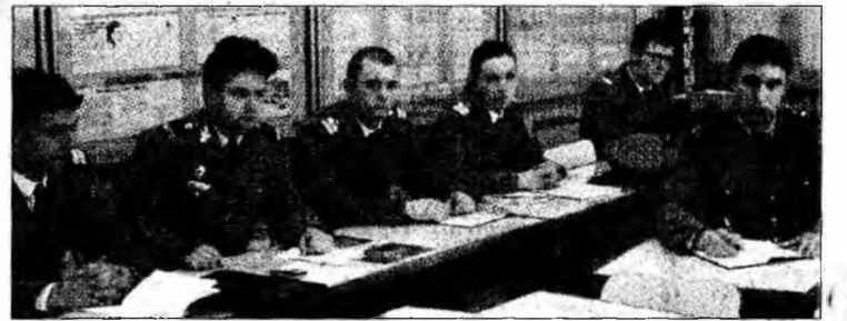
Elevi la Școala militară

pentru cei care doresc să urmeze o astfel de carieră. „Am avut rezultate deosebite, în județ, cu toți cei care au ales o carieră militară. Pentru recrutare, se parcurg câteva probe obligatorii cum ar fi vizita medicală, testare psihologică și verificarea pregătirii fizice. În acest sens am fost bine reprezentați în ultimii cinci ani de tinerii hunedoreni care s-au clasat la admitere pe primele trei locuri valoric și numeric”, declară lt. col. Nicolae Dincă, șeful Oficiului Informare Recrutare