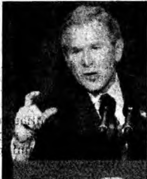
George W. Bush

Washington (MF) Casa Albă s-a distanțat, marți, de cifrele avansate de președintele George W. Bush în ceea ce privește numărul victimelor irakiene ale războiului. „Președintele nu a făcut decât să reia cifrele avansate de mass-media”, a declarat purtătorul de cuvânt al Casei Albe, Scott McClellan, asigurând că o parte „substanțială” a acestor decese au fost cauzate de către teroriști. Bush afirmă, luni, că estimează la „30.000, mai mult sau mai puțin”, numărul irakienilor uciși începând din martie 2003. Aceasta este prima ocazie, au susținut analiștii, în care șeful statului a făcut această evaluare, evitată până acum de administrația de la Washington.