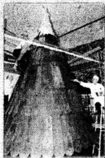
Ciocolată Un brad realizat din 200 kilograme de ciocolată, înalt de 5,30 metri, a fost expus marți în hotelul Amari din Bangkok.

prezintă patru zeități, variații ale aceleiași figuri. Una dintre ele reprezintă o zeitățe acvatică care oferă pește, a doua figură este un zeu al pământului care sacrifică o căprioară, a treia plutește în aer și a patra se află pe un câmp plin de flori. Lucrarea este unică pentru că a fost realizată cu câteva sute de ani înainte de epoca clasică a civilizației maiășe.