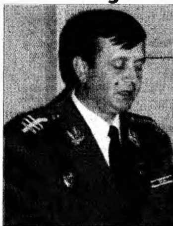
Colonel Viorel Sălan

Deva - În timpul misiunilor de pază din acest an, jandarmii hunedoreni au reușit să prindă mai mulți indivizi care încercau să falseze unor persoane valută falsă. Au fost executate peste nouă mii de misiuni de pază și protecție a transporturilor de valori. În acest an, jandarmii hunedoreni au executat misiuni de asigurare a ordinii publice la 15 mitinguri, cinci marșuri, 11 acțiuni de pichetare, două