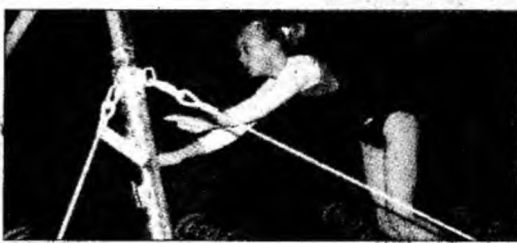
Gimnastele „urcă” spre medalii

venții reușite au fost cele mai bune jucătoare ale naționalei României în partida câștigată (37-26), marți, în fața Germaniei. După meciul care a asigurat tricoul prezenta în semifinale, cea alintată de suporterii deveni "Super-Alice" a spus că își dorește să joace finala Campionatului Mondial. "La început a fost greu, dar apoi ne-am dat drumul la joc, am fost unite și a ieșit bine. Sper să fie la fel în semifinale și în finală. Astăzi a fost ziua mea, dar am înscris pentru echipă", afirma „Super-Alice”.